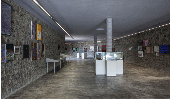
Şekil 2. Depo müze.