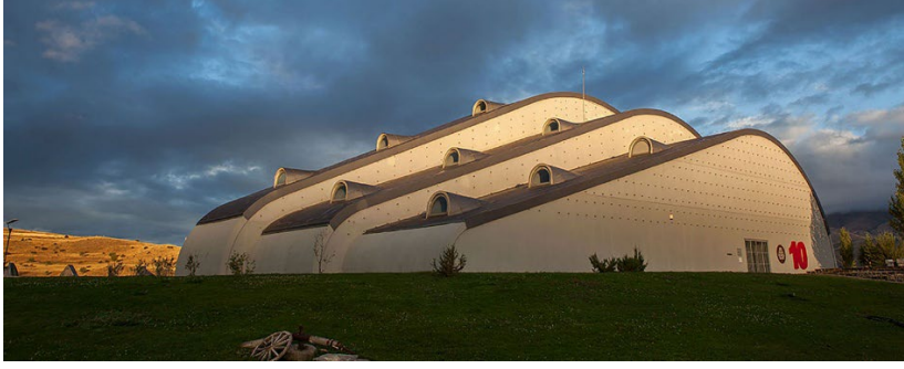
Şekil 1. Baksı Müzesi.