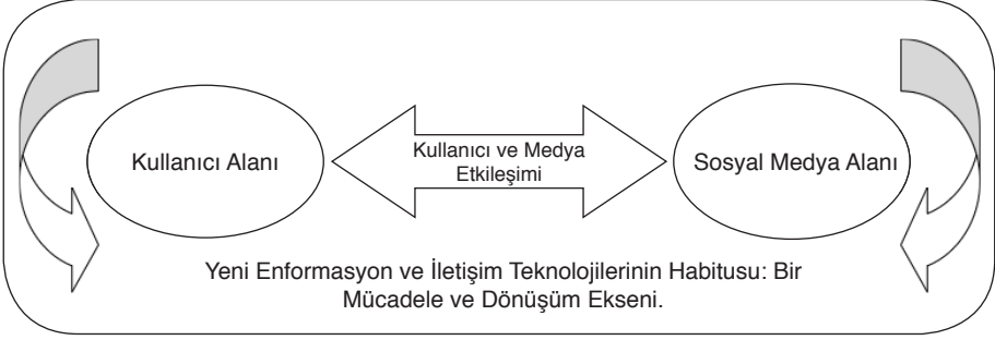
Şekil 1: Yeni Enformasyon ve İletişim Teknolojilerinde Kullanıcı Emeği ve Dönüşümü (Wacquant; 2014:205 ve Hallikainen, 2014:14 tartışmalarının değerlendirilmesiyle araştırmacı tarafından hazırlanmıştır).

Şekil 1 içerisinde yer alan mücadele ve dönüşüm eksenini aslında maddi olmayan emeğin tüm kurtarılmasında ve üstelik kullanıcının henüz sürece katılımından daha önce belirlendiği alanı oluşturmaktadır. Christian Fuchs (2014a:97), sosyal medya ağlarının, kapitalist toplumlarda değişen zaman rejiminin açık bir ifadesi olduğunu belirtir ve izleyici emeğinin daha geniş bir kapitalist sermaye birikim rejimi içerisinde ele alınması gerektiğini vurgularken gerçekte tam da bu etkileşimi değerlendirmektedir. Ancak böylesi bir etkileşim, maddi olmayan emeğe dair çalışmaların en azından son döneminde kapitalizme dair anlamlı bir soruyu sormamaktadır.