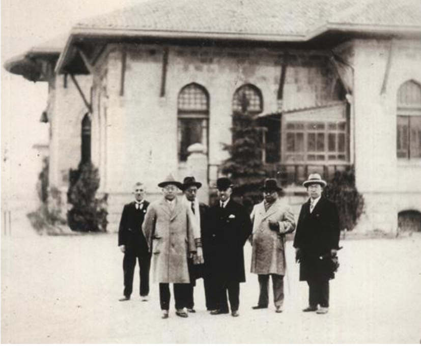
Resim 3 , Soldan ikincisi Sun Ke, soldan üçüncüsü Hu Hanmin, Ankara 1928), http://www.cnpoems.com/people/114446/photos , Erişim tarihi: 30.01.2018.