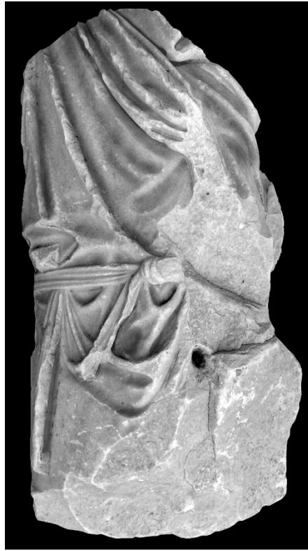
Resim 9: Metropolis'ten Khiton ve Kuşaklı Heykel Örneği