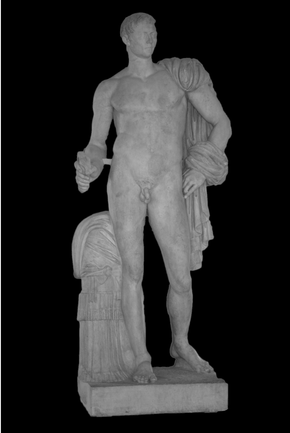
Resim 11: Tusculum'daki Romalı Komutan Heykeli. (Cadario 2016: 303)