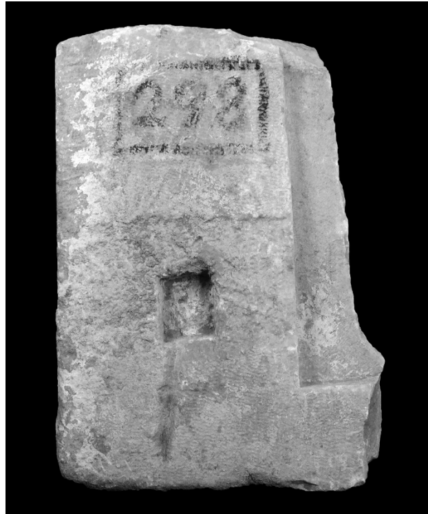
Resim 15: Saę Ayak ve Kaide Parçası Arka Yz Grnm