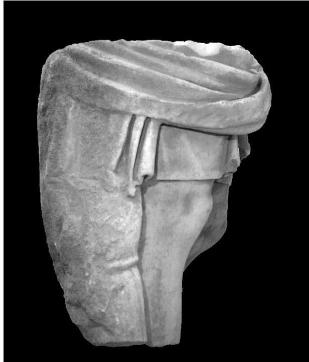
Resim 4: Kısa Khiton Giyimli Ayakta Erkek Heykeli Sağ Profilden Görünümü