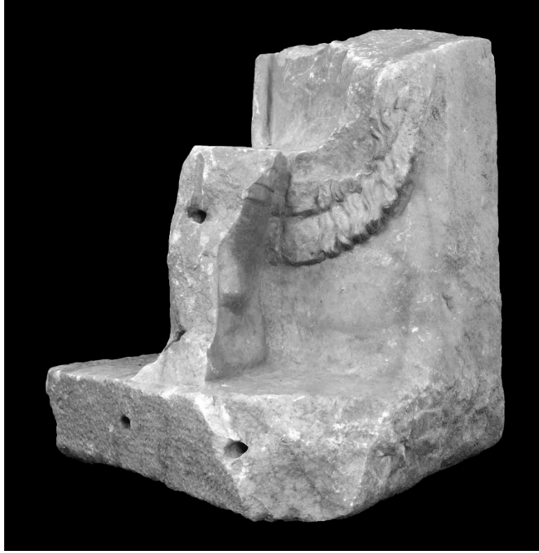
Resim 14: Saę Ayak ve Kaide Parçası n Yz, Sol apraz Grnm