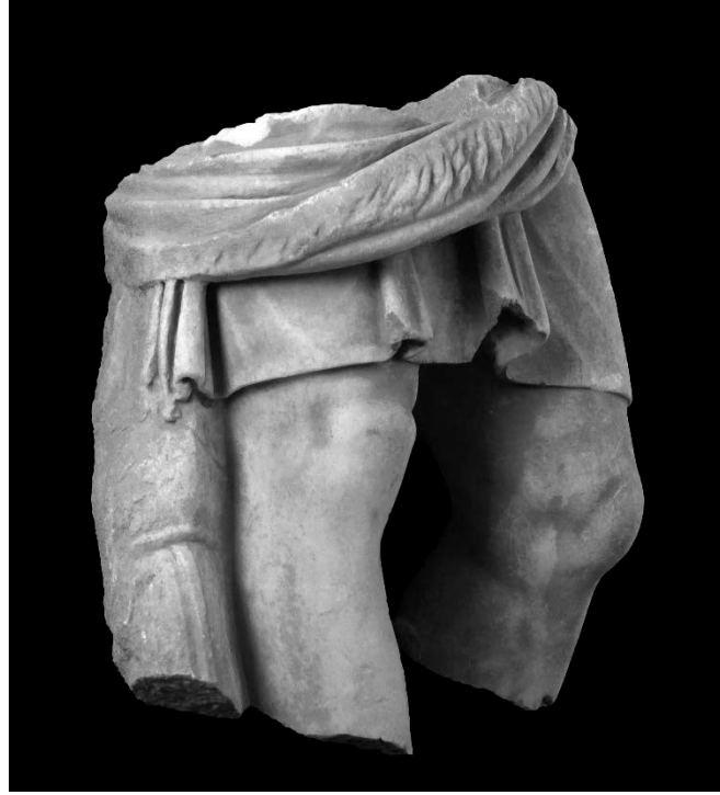
Resim 3: Kısa Khiton Giyimli Ayakta Erkek Heykeli Ön Yüz, Sağ Çapraz Görünümü