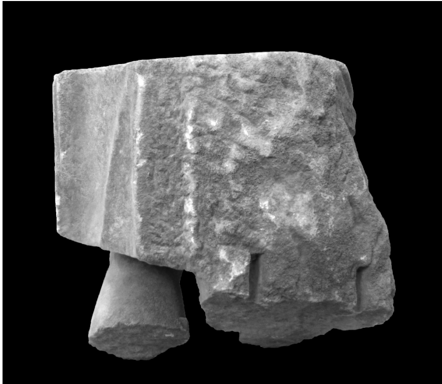
Resim 6: Kısa Khiton Giyimli Ayakta Erkek Heykeli Arka Yüz Görünümü