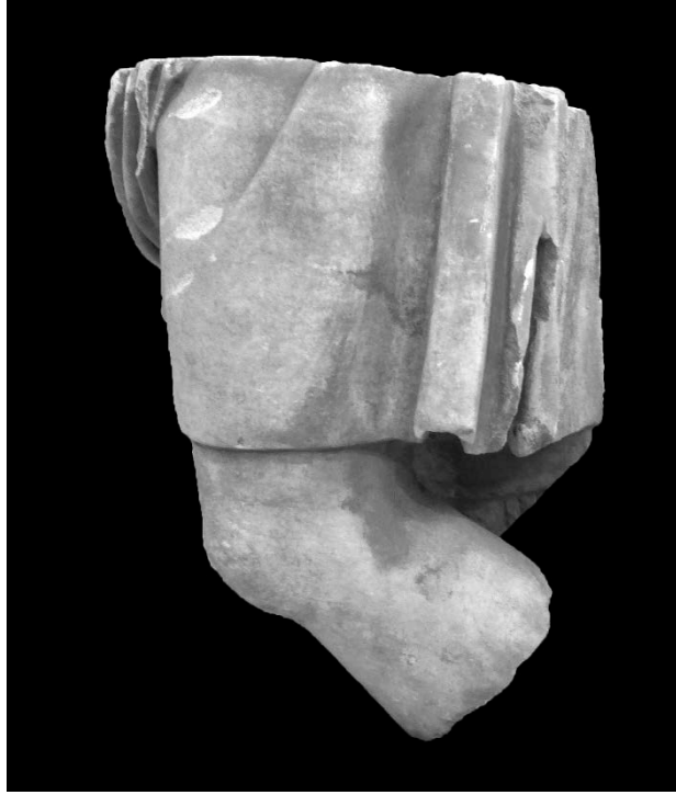
Resim 5: Kısa Khiton Giyimli Ayakta Erkek Heykeli Sol Profilden Görünümü