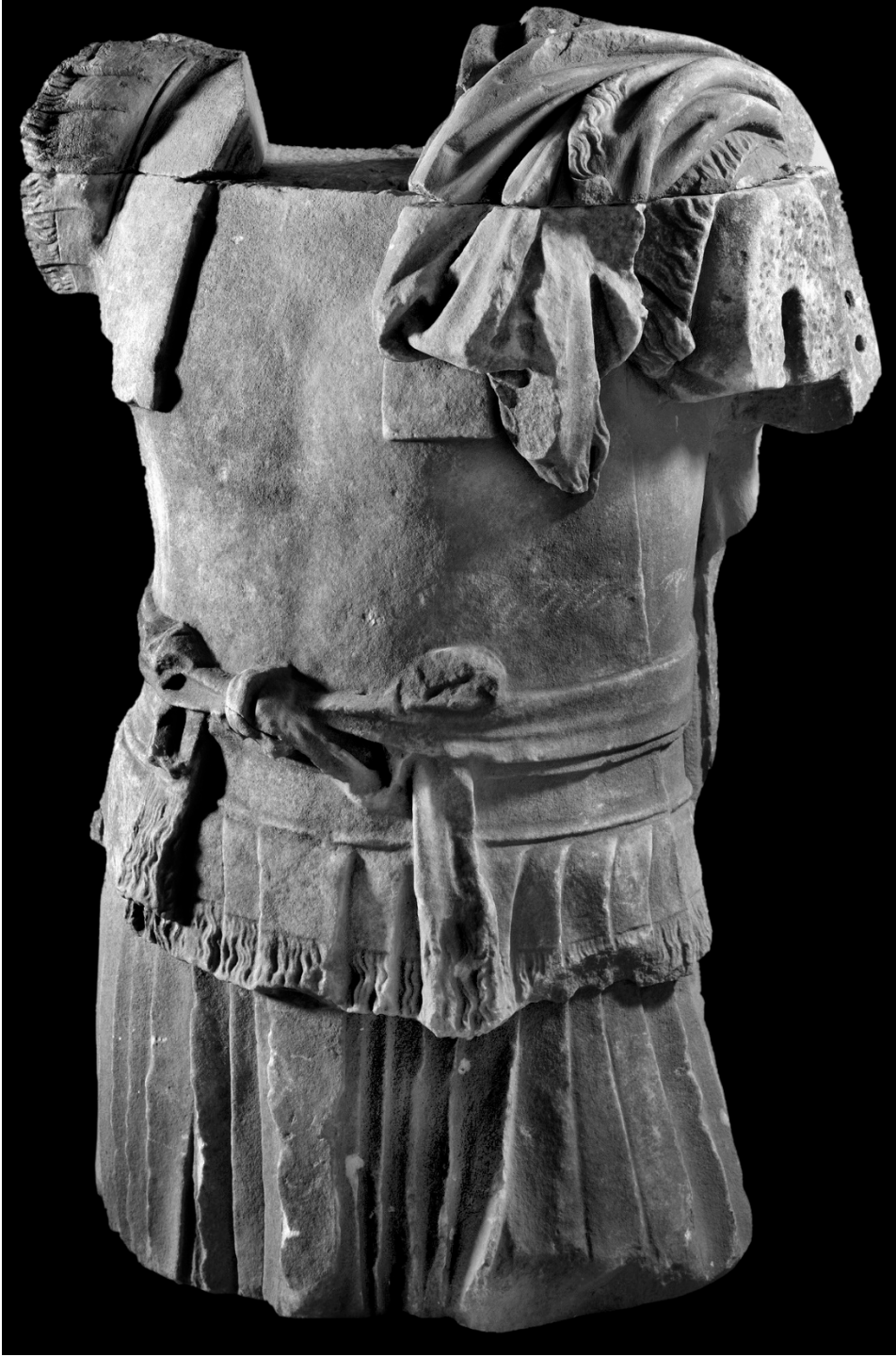
Resim 7: Metropolis'ten Zırhlı Torso Örneği