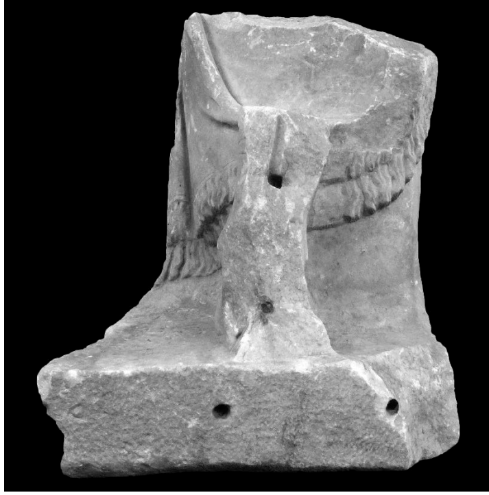
Resim 12: Sağ Ayak ve Kaide Parçası Ön Yüz Görünümü