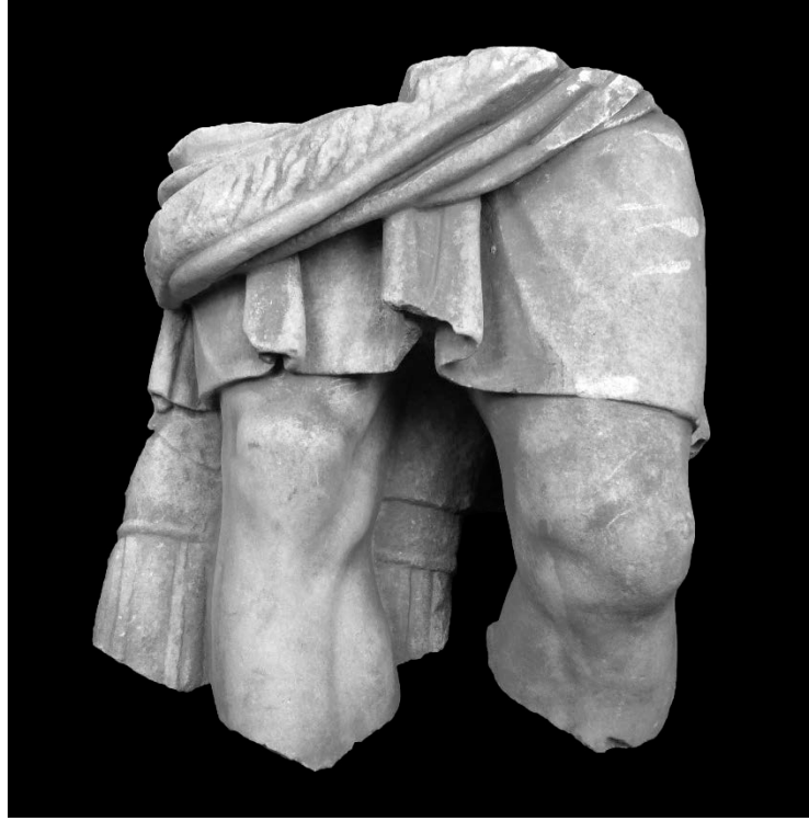
Resim 1: Kısa Khiton Giyimli Ayakta Erkek Heykeli Ön Yüz Görünümü