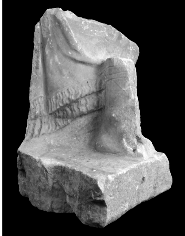
Resim 13: Sağ Ayak ve Kaide Parçası Ön Yüz, Sağ Çapraz Görünümü