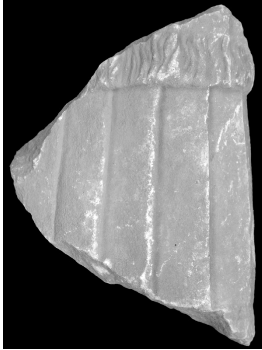
Resim 8: Metropolis'ten Zırlı Heykel Parçası