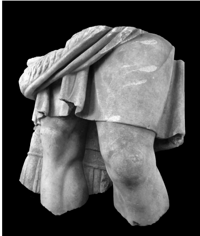
Resim 2: Kısa Khiton Giyimli Ayakta Erkek Heykeli Ön Yüz, Sol Çapraz Görünümü