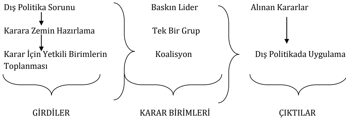
Şekil 1. Karar Alma Sürecinin Aşamaları 23