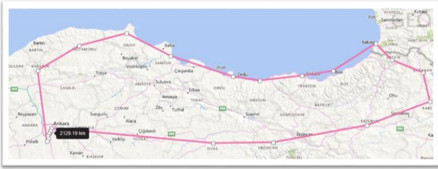
Şekil 3: Karadeniz ve Batum Turu Güzergâhı

Şekil 3’te görüldüğü üzere Karadeniz ve Batum turu kapsamında Kastamonu, Sinop, Samsun, Ordu, Gümüşhane, Trabzon, Rize, Artvin ve Batum illerinin gezildiği görülmektedir. Bu turlar çoğu zaman Samsun’dan başlamakta olduğu gözlenmiştir