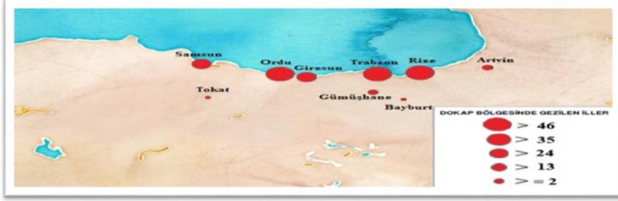
Şekil 5. DOKAP İllerinin Gezilme Durumlarının Görseli

Trabzon ili dikkat çekmektedir. En çok gezilen illerin görseli, frekanslarına göre ayarlanmış görsel harita ile Şekil 5’te yer almaktadır.