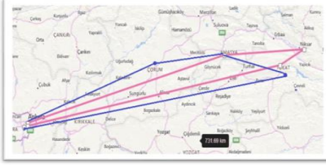
Şekil 1. Amasya & Çorum & Tokat & Niksar Tur Güzergâhı

tur kapsamına alındığı ve genel olarak Karadeniz turlarına nazaran daha az sayıda olduğu görülmektedir.