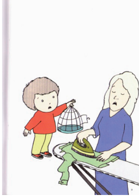
Fatih Erdoğan (Resimler: Fatih Erdoğan), Kuşumu Kim Kışkırladı?, s.9.

İncelenen kitap resimlerinde en sık görülen kadın temsili "anne"dir. Kitapların dokuzunda geleneksel bir anlayışla oluşturulan anne, çocuklarıyla ilgilenen, ev işlerini gören kahraman olarak sunulur. Resimlerde, çoğunlukla aile çocuk yetiştirmenin birinci derecede sorumluluğunu anne figürüne verir. Kadın karakterler giyim biçimleriyle daha çok özverili ve başkaları için kendini adama eğilimine sahip karakterler olarak geliştirilir. Örneğin, "Yaşasın Kar Yağıyor", "Kadife Tavşan", "Misimisi ile Pisipisi Temizlik Oyunu Oynuyor", "Aslı Pazarı Bekliyor" adlı yapıtlardaki resimlerde, anne karakterinin ev kadını rolü üstlendikleri görülür.