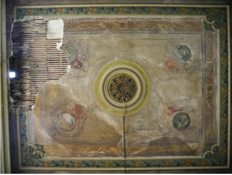
Res.24- 1215 Sokak No.32'deki konutun yařam odası tavanı.