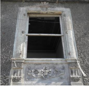
Res.15- 1215 Sokak No.32'deki konutun penceresi.

Π 13 harfleri, 1235 Sokak cephesindekinde ise E ve T 14 yazılmıştır (Res.16, 17). İzmir'de bu tür kısaltmalar batılılar gibi yaşama isteği bulunan Osmanlı kent soylularının evlerinde de görülmektedir (Kuyulu Ersoy 2015: 64). Benzer kilit taşı düzenlemesi 1226 Sokak No.4'teki konutta da mevcuttur. Söz konusu konutun pencere ve kapı lentosunun kilit taşı görünümü alanlarında, volütle başlayan "C" kıvrımının ortasında bulunan istiridye kabuğu kabartması her iki pencerenin lentosu ortasında yinelenmektedir. Pencere ve kapıları çevreleyen sövelerin lento ya da kemer ortalarındaki kilit taşı görünümü öğelerin veya kilit taşlarının bu tür motiflerle süslenmesi Buca (Erpi 1987: 213), Karşıyaka (Uçar 2013: 409-410) gibi İzmir'in çeşitli semtlerindeki konutlarda da mevcuttur.