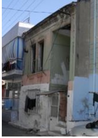
Res.6- 1226 Sokak No.4'teki konut.

Girişin batısında, bodrum katta yatay dikdörtgen şekilli bir, üst katta ise dikey dikdörtgen şekilli iki pencere mevcuttur. Bodrum kat dikkatlice incelendiğinde taş sövelerle çevrili yaklaşık kare şekilli bir açıklık bulunduğu ve bunun sonraki bir tarihte kapatıldığı anlaşılmaktadır. Kapatılmış durumdaki özgün açıklığın iki yandan kare şekilli taşların üst üste dizilmesiyle oluşturulmuş pilaterlerle sınırlandırıldığı görülmektedir. Bu açıklığın bir pencere ya da kapıya göre oldukça geniş olması, konutun özgününde bodrum katının ticaret amaçlı kullanıldığını, daha sonraki bir tarihte kapatılarak konuta dönüştürüldüğünü, bu dönüşüm sırasında bugünkü pencere açıklığının bırakıldığı tezini destekler niteliktedir.