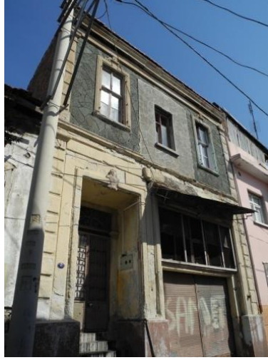
Res.8- 1225 Sokak No.44'teki konut.