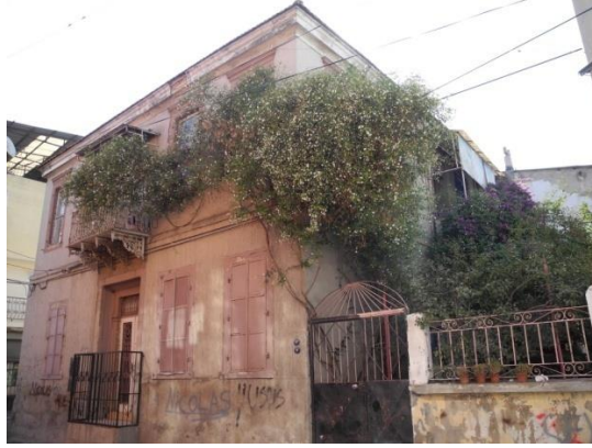
Res.14- 1120 Sokak No.20'deki konut.

1120 Sokak No.20'de bulunan konut orta hollü tipin bodrum + iki katlı bir varyasyonudur (Res.14). Asimetrik bir cephe tasarımı sergileyen konutta girişin üst tarafında balkona yer verilmiştir. Kapı üstü penceresindeki demir korkuluktaki 1901, konutun inşa tarihi olmalıdır.