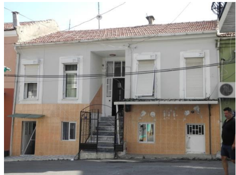
Res.13-1228 Sokak No.20'deki konut.