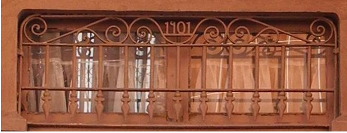
Res.18- 1120 Sokak No.20'deki konut

yer bulmuştur. Hilal semtinde olduğu gibi, İzmir'in Bergama (Kırlar 2012: 89) ilçesi, Afyon'un Sandıklı (Uçar 2012b: 252) ilçesinde yer alan ve tarihlendirmeleri 1900'lerin başı olan konutlarda kapı üstü pencerelerinin metal korkuluklarında da inşa tarihi yer almaktadır. "S" ve "C" kıvrımlarıyla meydana getirilmiş benzer süslemelere sahip korkuluk örneklerine ise 19. yüzyıl sonları ile 20. yüzyıl başlarında inşa edilmiş çok sayıdaki İzmir konutunda rastlanılmaktadır (Uçar 2012a: 30).