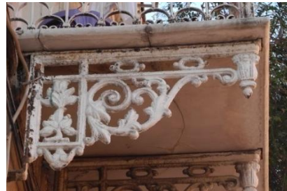
Res.20- 1120 Sokak No.20'deki konutun balkon konsolu.