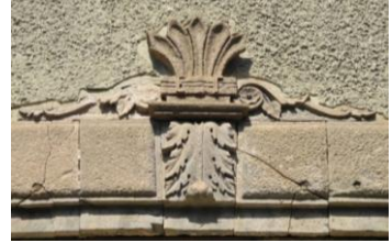
Res.16, 17- 1215 Sokak No.32'deki konutun dükkân açıklıklarının kilit taşları.

Sınırları belirlenmiş çalışma alanındaki geleneksel konut dokusunda görülen diğer bir süsleme malzemesi metal dir. Demir çubuklara "C" ve "S" kıvrımları verildikten sonra perçinleme ve/veya sarmalı bağlama yöntemiyle istenilen kompozisyonda birleştirilmektedir. Bu korkuluklar çift kanatlı giriş kapıları, kapı üstü pencereleri, balkon gibi birçok farklı yerde kullanılmıştır. 1120 Sokak No.20'deki konutta kapı üstü penceresinin korkuluğunda konutun inşasına ait 1901 tarihine yer verilmiştir (Res.18). Konutlarda inşa tarihine ilişkin bilgiye çoğunlukla konut giriş kapılarının taş lentoları üzerinde yer verilmesine rağmen, bu örnekte olduğu gibi kapı üstü pencerelerinin metal korkuluklarında nadir olarak bulunmaktadır. Benzer uygulama Anadolu'daki Türk evlerinde de