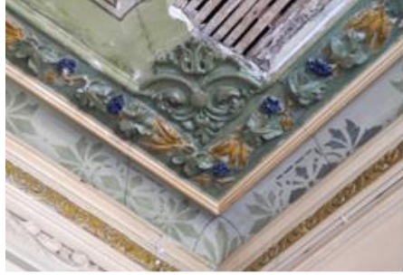
Res.22, 23- 1215 Sokak No 32'deki konutun giriş holü tavanı ve tavandan detay.

Hilal geleneksel konutlarında Batılı bir anlayışla düzenlenmiş tavan resimlerine de yer yerilmiştir. 1215 Sokak No. 32'deki konutta görülen bu resimlerde yuvarlak madalyon içerisinde kıyı görümlü manzara resimleri yapılmıştır. Bu resimlere konutun giriş holü tavanındaki alçı göbeğin dört köşesindeki ile yaşam odası tavanının dört köşesinde yerleştirilen barok kartuşlar içerisinde yer verilmiştir (Res.24). İzmir'de 19. yüzyıl sonları ile 20. yüzyıl başlarında inşa edilmiş konutlarda döneminin en beğenilen süsleme türlerinden biri ve modası olan duvar ve tavan resimlerine (Kuyulu Ersoy 2015: 63), Büyükkaraoşmanoğlu, Kızlarağası Hanı gibi hanlarda da yer verildiği bilinmektedir (Ersoy ve Uçar 2015: 43). Söz konusu konutun tavanı alçı ve kalem işi süslemeli birkaç bordürle kuşatılmış, bordürlerden en içtekinin her bir kenarı ortasına, bir gülbezeğin iki tarafına karşılıklı yerleştirilmiş birer kanatlı ejder figürü işlenmiştir (Res.25). Ejder figürlü kompozisyonlar sadece bu tür Rum konutlarında değil, Yahya Hayati Paşa Köşkü (Kuyulu Ersoy 2014: 540) gibi Türk konutlarında, kentteki ilk Türk-Müslüman hastanesi olarak kurulan Gureba-i Müslimin Hastanesi'nde (Bubur 2002: 170) de yer bulmuştur. Hilal geleneksel dokusunda bulunan 1215 Sokak No. 32'deki konut, tavan resimleriyle İzmir örneklerinin 15 sayısını arttırsa da konutun yıkılış sürecinin başlaması nedeniyle yok olma tehlikesiyle karşı karşıyadır.