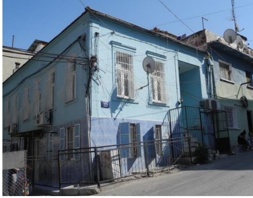
Res.2- 1215 Sokak No.30'daki konutun grn.

Yan holl, bodrum + tek katlı konutların diđer bir rneđi 1228 Sokak No.24'te grlmektedir (Res.3). Sokak kotundan basamaklarla ykseltilen giri derince bir ni ierisine yerletirilmitir. Giriin dođusunda yer verilen iki adet dikey dikdrtgen Őekilli pencere, arkasındaki yaama mekanını aydınlatmaktadır. Bodrum kat, birinci kat sahanlıđının altında bulunan kk bir kapıyla ayrı bir konut olarak kullanılmaktadır. Cephe, bir ucu yuvarlatılmı tuđlaların birer atlatmalı yerletirilmesiyle oluturulmu Őaak silmesiyle sonlandırılmıtır.