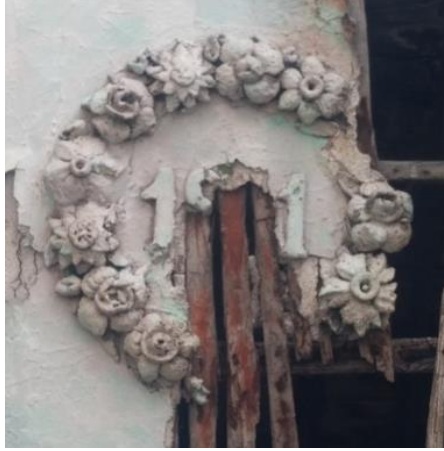
Res.21- 1226 Sokak No.4'teki konuttun giriş nişi tavanındaki alçı süsleme.

Alçı , Hilal'deki geleneksel konutların süslenmesinde kullanılan malzemelerden bir diğeridir. Konutların hava koşullarının olumsuz etkilerinden korunaklı dış cephelerinde ve özellikle konut iç mekan tavanlarında sevilerek kullanılmıştır. Çalışmada incelenen konutlar arasında 1226 Sokak No.4'teki konutun giriş nişi tavanında çeşitli çiçeklerle hazırlanmış bir çelengin ortasına tarih düşüldüğü görülmüştür (Res.21).