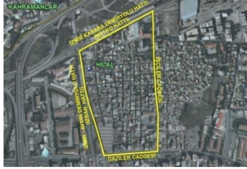
Res.1- Çalışma alanı sınırları