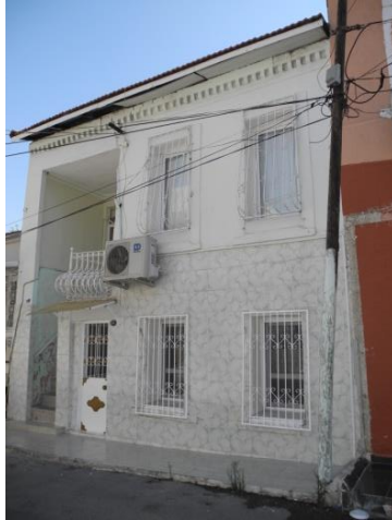
Res.3- 1228 Sokak No.24'teki konutun grn.

Yan holl, bodrum + tek katlı konutların diđer bir rneđi 1228 Sokak No.24'te grlmektedir (Res.3). Sokak kotundan basamaklarla ykseltilen giri derince bir ni ierisine yerletirilmitir. Giriin dođusunda yer verilen iki adet dikey dikdrtgen Őekilli pencere, arkasındaki yaama mekanını aydınlatmaktadır. Bodrum kat, birinci kat sahanlıđının altında bulunan kk bir kapıyla ayrı bir konut olarak kullanılmaktadır. Cephe, bir ucu yuvarlatılmı tuđlaların birer atlatmalı yerletirilmesiyle oluturulmu Őaak silmesiyle sonlandırılmıtır.