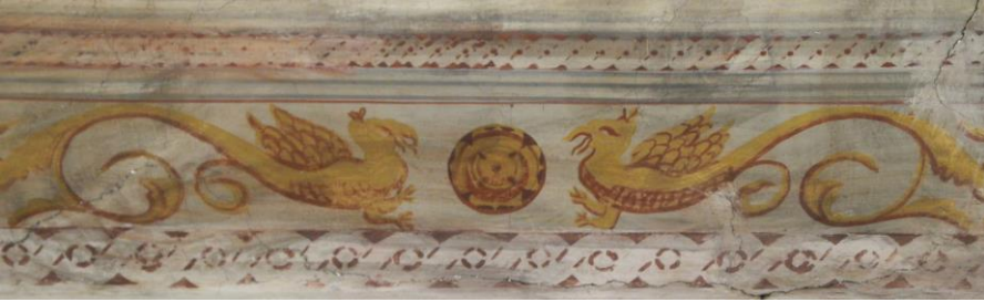
Res.25- 1215 Sokak No.32'deki konutun ejder tasvirleri.

Hilal geleneksel konutlarında kullanılan diđer bir ssleme malzemesi karosimandır . Sıvı kıvamda hazırlanmış pigmentli çimento, mermer tozu ve çeřitli minerallerle karıştırılıp hazırlanan karışımın kalıba dklp preslenmesi ve çeřitli işlemler sonrasında kurutulmasıyla elde edilen karosimanlar, 19. yzyıl sonları ile 20. yzyılda dnemin modası haline gelmiş, İzmir konutlarının neredeyse tamamında zemin dřeme malzemesi olarak kullanılırken, zengin