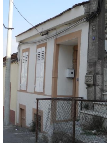
Res.5- 1215 Sokak No.34'teki konut.