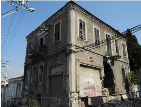
Res.11- 1215 Sokak No.32'deki konut.

Benzer düzene sahip bir silme saçak altında üst üste iki kez tekrarlanarak kullanılmıştır. Tuğla kaplamayla pilaster görünümü verilen köşelerinin vurgulandığı konutun cephelerinde bitkisel motiflerin yoğun kullanıldığı taş süslemeler mevcuttur.