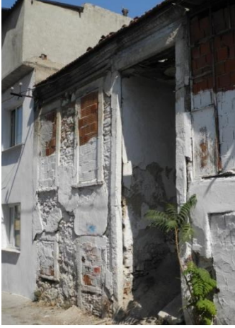
Res.4- 1234 Sokak No.5'teki konut.

1234 Sokak No.5'te (Res.4) ve 1215 Sokak No.34'teki (Res.5) konutlar benzer cephe tasarımlarıyla bu tipin diğer örnekleri olarak çalışmada yer almıştır. 1234 Sokak No.5'teki konutun kullanılmadığı, giriş açıklığı ile pencerelerinin örülerek kapatıldığı, merdiven basamaklarının tahrip edildiği ve yıkılış sürecinin başladığı görülmektedir.