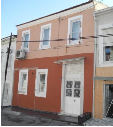
Res.7- 1228 Sokak No.22'deki konutun görünüşü.