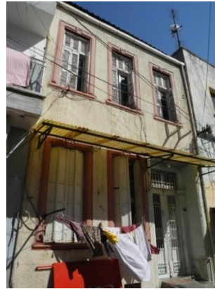
Res.10- 1217 Sokak No.46'deki konut.