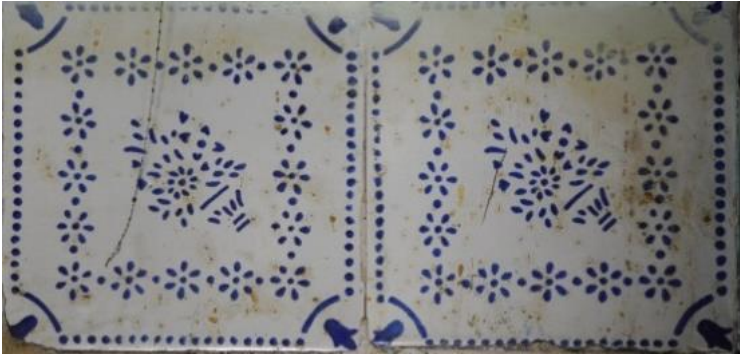
Res.26- 1215 Sokak No.32'deki konutun seramiklerinden detay.

Çalışma kapsamında incelenen konutlarda diğer bir süsleme malzemesi olarak bezemesiz tek renkli ve bitkisel bezemeli mavi-beyaz renkli seramikler de kullanılmıştır. Seramik malzemeli süsleme örnekleri 1215 Sokak No. 32'deki konutta saptanmıştır. Konutun mutfak davlumbazı etrafında (Res. 26) ve tuvalet duvarlarında bitkisel kompozisyonlu seramikler bulunduğu dikkati çekmiştir.