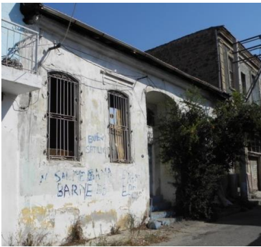
Res.12- 1225 Sokak No.46'daki konut.

Bu alt gruba ait diğer örnek 1228 Sokak No.20'de yer almaktadır (Res.13). Simetrik bir tasarıma sahip konutun cephesi ortasında giriş, her iki yanında ise bodrum katta birer kapı birer pencere, birinci katta ise ikişer pencere bulunmaktadır. Sokak kotundan yükselen giriş eyvan görünümüne bir niş içine konumlandırılmıştır.