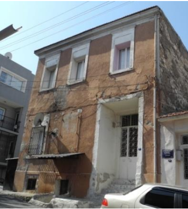
Res.9- 1215 Sokak No.37'deki konut.

Yan holl, iki katlı konutların bodrum kat eklenmiř bir varyasyonu olan bu tipte, bodrum katın bulunması birinci katın sokak kotundan ykselmesine neden olmuřtur. Birinci katın ykselmesi konuta ulařım iin birka basamaklı merdiven gereksinimi ortaya ıkarınca, konut giriř aıklığı bir niřin dip duvarı zerine yerleřtirilmiřtir. alıřma alanı ierisinde bu tipe ait iki rnek saptanmıřtır. 1215 Sokak No.37 (Res.9) ve 1217 Sokak No.46 (Res.10) adreslerinde yer alan konutlar cephe tasarımlarıyla bu tipin rneklerindedir.