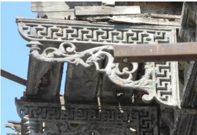
Res.19- 1215 Sokak No.32'deki konutun cumba konsolu.

Cumba/balkon konsolları metal malzemenin kullanıldığı diğer bir yapı elemanıdır. Genellikle büyük bir "S" kıvrımlı bitkisel bir dalın üstten ve yandan menderes motifli veya çeşitli bitkisel motiflerle oluşturulmuş bir silme ile birleştirilen konsollar dökme demir yöntemiyle üretilmektedir. Eritilmiş demirin kalıplar içine dökülerek aynı ölçü ve süslemeye sahip konsolların seri üretimiyle (Erpi 1987: 200), aynı boyutlara ve bezemeye sahip konsolların çok sayıda konutta kullanılması sonucunu doğurmuştur. 1215 Sokak No.30'daki konutun cumbasını taşıyan konsolların her biri aynı kompozisyonu tekrarlamaktadır (Res.19). 1220 Sokak No.20'deki konutun balkonunu taşıyan konsollarda benzer bir kompozisyonun (Res.20) her üç konsolda da yinelenmesi, konsolların dökme demir olarak seri üretiminin yapıldığını, konut sahibinin bu hazır olan konsollardan seçtiği bir modelin kullanıldığını ortaya koymaktadır.