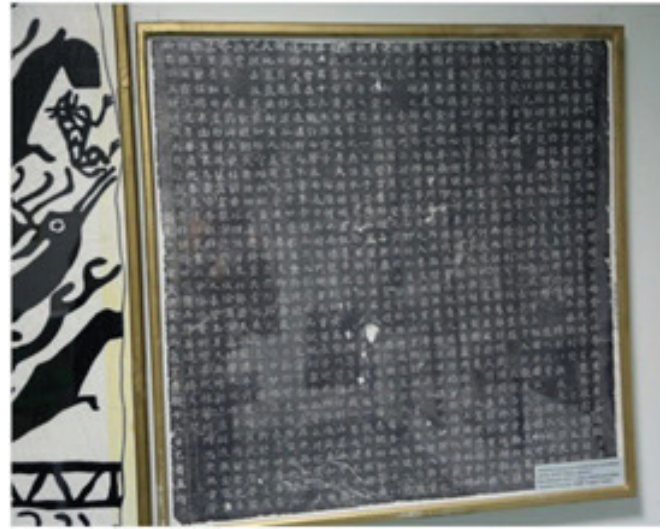
Fig.9. Çin'de bulunan Göktürk tarihine ilişkin kitabelerin Çince yazılmış estampaj kopyası

Bunun yanı sıra Yenisey yazıtlarının estampaj kopyaları, Çin'de bulunan Türk tarihine ait önemli kitabelerin estampajları da bulunmaktadır.