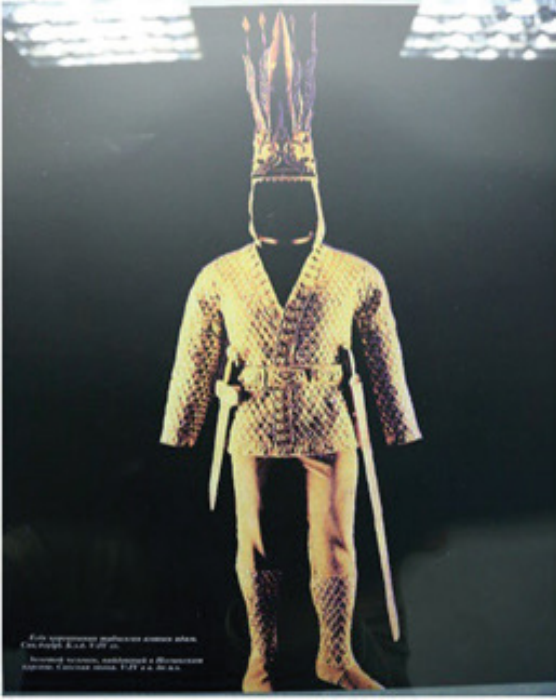
Fig.14. Esik Kurganı'nda bulunan Altın Elbiseli Adam ve gümüş kepçedeki bitig yazıtı. M.Ö.5-4-yüzyıl.