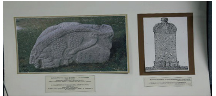
Fig.13. Ordubalık sütunundaki Soğd metni. M.Ö. 73