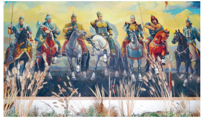
Fig.5. Muhteşem Türk Milleti savaşçıları, Kültigin beyaz atı sürerken resmedilmiştir