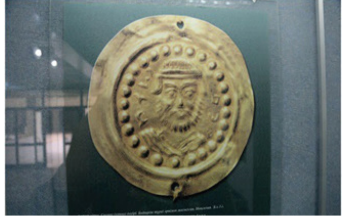
Fig.12. M.Ö. 10-5 yüzyıl. Ayıt İç-Oğuz/İskit sakalar/döneminin kaya resimleri

Avrasya Milli Üniversitesinin Avrasya düşüncesini ön planda tutarak Avrasya coğrafyasındaki kültürü, yazıt türleri ve yazı eserlerini tanıtmak amacıyla kurulmuştur. Ses, işaret edecek harflerin oluşmasından önce insanoğlu piktografiya, ideografiya, hiyeroglif, hece yazıtı kullanmıştır. M.Ö. 2 bin yılının sonunda sözü, hecelerin gösteren yazıt oluşmuştur. Neticesinde M.Ö. 13 asırda Semit harf yazısı ortaya çıkmıştır.