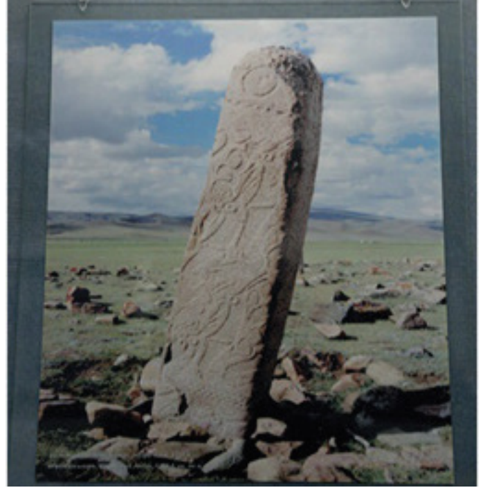
Fig.15. Geyikli taş. İç-oğuz devri. Moğolistan M.Ö.2000-100 yüzyıl.