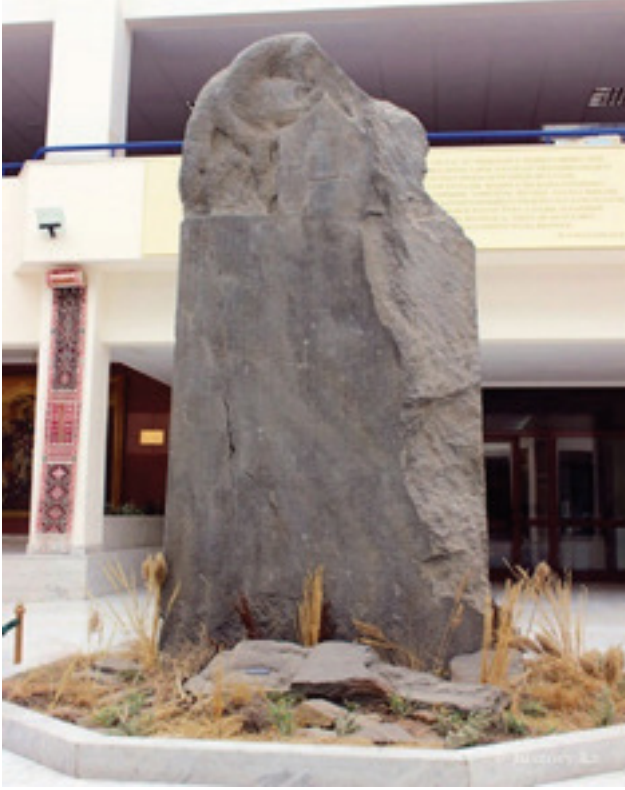
Fig.1. Orhun Yazıtlarından Kültegin Kitabesinin Bilimsel Kopyası