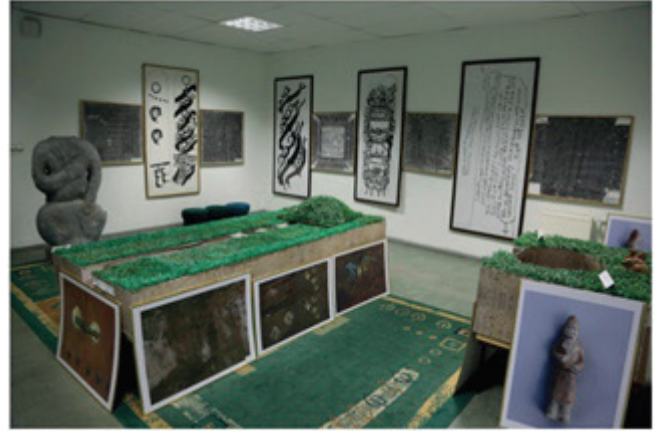
Fig.8. Mayhan Uul Göktürk Kağan mezarının maketi Moğolistan. Bayannur

ların tümü Göktürlere özgü bir gelenek olarak bilinen hendeklerle çevrilidir.