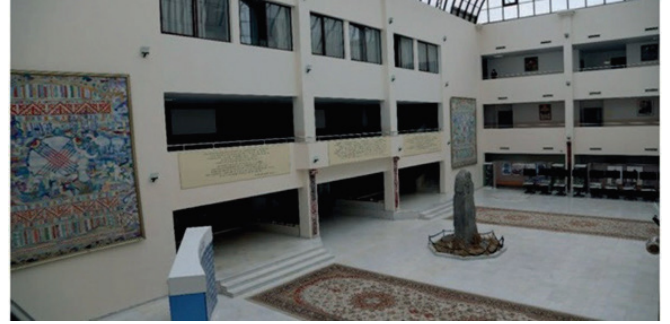
Fig.3. Müzenin temeli 2001 yılında Moğalistan'daki Kültigin Kitabesi'nin bilimsel kopyasının yapılması ile atılmıştır.

savaşını yansıtan yağlı boya tablo bulunmaktadır.