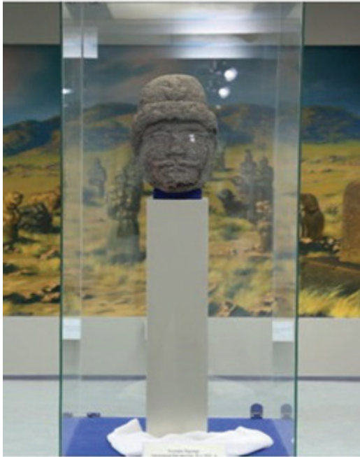
Fig.7 Kutluk Kağan heykelinin başı

Bu bölümde tarihte Türk toplumlarının kullandığı bütün yazıt örnekleri ve taş tablolar bulunmaktadır. En eskisi M.Ö. 4-5 yüzyıla ait Esik Kurganı'nda bulunan İskitlerin yazıt örnekleri vardır. Dolayısıyla Göktürk yazıt örnekleri, Brahmi yazıtı, Uygur yazıtı, eski Çin yazıtı, Moğol yazıtı, Arap alfabeli yazıtlar vs. sunulmuştur.