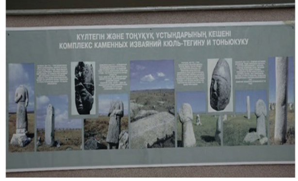
Fig.2. Orhun abidelerinin fotoğrafı

Bu alanda Kültigin Kitabesi'nin replikası ve Orhun Abideleri'nin fotoğrafları bulunmaktadır. Atriumun son kısmında "El tutka" isimli yağlı boya tablo bulunmaktadır. Tabloda Kazak halkının tarihteki bütün liderlerinin portreleri yapılmıştır. Aynı alanda ayrıca "Tomiris" isimli İskitler ve Farisilerin