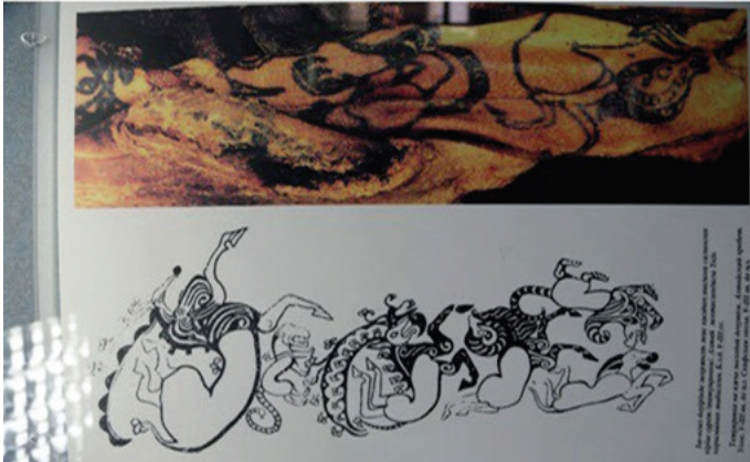
Fig.11. Altay Dağlarındaki Ukok Kurganı'nda bulunan ceset. M.Ö. 5-4 yüzyıl. İç-Oğuz döneminde gömülen genç kızın vücudundaki dövme.

İnsanoğlu, tarihinde konargöçer medeniyeti oluşturarak “Bengü el (Ebedi el)” ideolojisini öne sürmüş ve günümüzde 26 kardeş dil konuşan Türk halkları tarih boyunca 16 alfabe kullanmıştır. M.Ö. 1200 yılından itibaren ilk Göktürk bitig yazıtı oluşturmuştur.