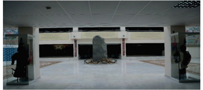
Fig.4. Kültigin Atriumu

savaşını yansıtan yağlı boya tablo bulunmaktadır.