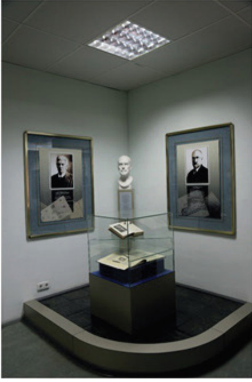
Fig.10. Vilhelm Thomsen köşesi

Yukarıda kısaca anlatmaya çalıştığım eserlerin haricinde