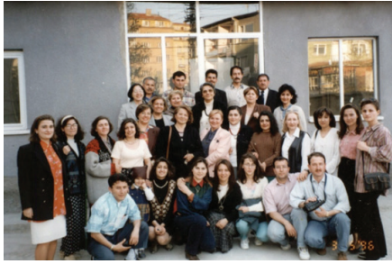
F.19- Gazi Üniversitesi Mesleki Yaygın Eğitim Fakültesi, Akademik ve İdari Personel (1996)