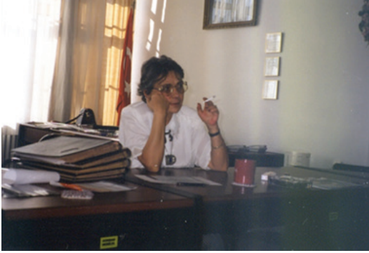
F.33- Gazi Üniversitesi Mesleki-Yaygın Eğitim Fakültesi Dekanlığı