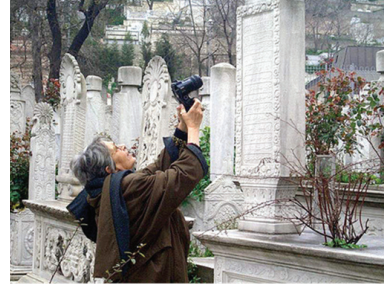
F.29- İstanbul Eyüp Sultan Mezarlığı 2004