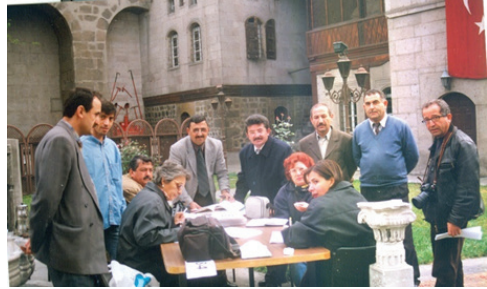
F.16- Vakıflar Genel Müdürlüğü Halı Projesi Çalışmalarında, Kayseri (2004)