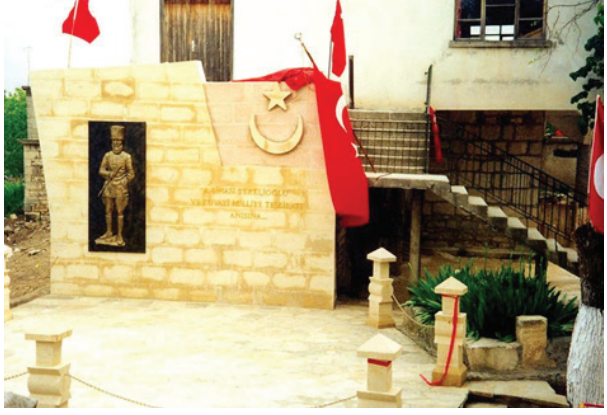
F.2- Adana Karaisalı ilçesi, Örcün Köyü Kuvayy-i Milliye Karargahı, Sinan Tekelioğlu Anıtı (1998)