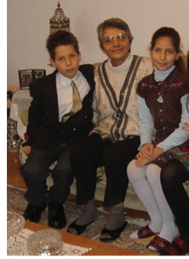
F.10- Torunları ile birlikte

Üniversite öğrenimi için tercih ettiği Ankara Üniversitesi Dil ve Tarih-Coğrafya Fakültesi Sanat Tarihi Bölümü'nden 1969 yılında mezun oldu. Meslek hayatına 1970 yılında Ankara Tevfik Fikret Lisesi ve Kız Teknik Yüksek Öğretmen Okulu'nda öğretmen olarak başladı.