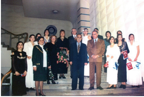
F.17- A.Ü. Dil ve Tarih, Coğrafya Fakültesi, Defile Sonrası (1995)