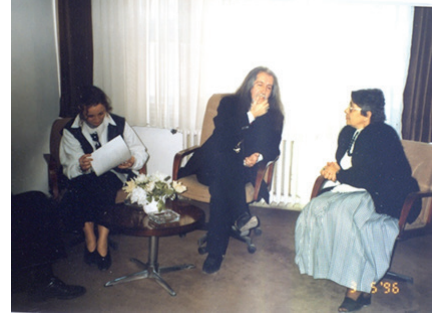
F.18- Gazi Üniversitesi Mesleki Yaygın Eğitim Fakültesi Dekanlığı, Barış Manço'nun Ziyareti