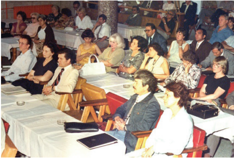
F.14- El Sanatları Kongresi'nde (1982)

1983 yılında 44. Devlet Resim ve Heykel Sergisi'ne Gazi Eğitim Fakültesi'ni temsilen seçici kurul üyeliği, 1986 yılında 1. Türk Süsleme Sanatları Jürisine Kültür ve Turizm Bakanlığı'nı temsilen seçici kurul üyeliği yaptı. 1985 yılında Atatürk Yüksek Kurulu Atatürk Barış Ödülü Rozet ve Plaket yarışması jürisinde Atatürk Yüksek Kurulu danışmanı olarak çalıştı. 1986 yılında Başbakanlık Devlet Nişan ve Madalya Jürisinde seçici kurul, Kültür ve Turizm Bakanlığı İstiklal Marşı ve Mehmet Akif Ersoy Anıtı Yarışmasında seçici kurul üyesi olarak görev aldı. 1985 yılında Sofya'da yapılan 23. Unesco Genel Konferansında Kültür ve Turizm Bakanlığını temsilen danışmanlık yaptı. 1986 yılında Kültür ve Turizm Bakanlığı Kütüphaneler ve Yayımlar Genel Müdürlüğü'nce verilen Sanat Eserleri Yayın Danışma Kurulu Üyeliği, Fikir ve Sanat Eserleri Dairesince verilen Türkiye Güzel Sanat Eseri Sahipleri Meslek Birliği Teknik Bilim Kurulu Üyeliği ile 1987-1990 yıllarında Trabzon ve Antalya Kültür Varlıklarını Koruma Kurullarında başkanlık ve üyelik görevlerinde bulundu.