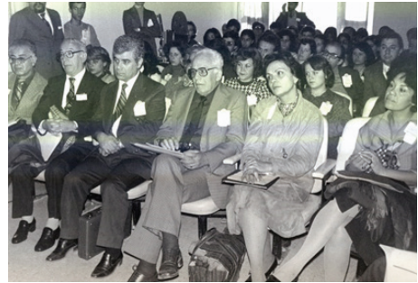
F.13- Folklor Kongresi, Ohri (1981)