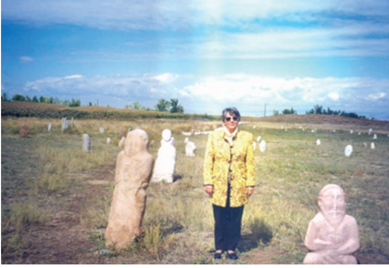
F.23- Kırgızistan. Taşbabalar (1996)

2005 yılında Türkiye Büyük Millet Meclisi Başkanlığı Geleneksel Türk El Sanatları Üretici ve Sanatkarlarının Sorunlarının Araştırılarak, El Sanatlarının Geliştirilmesi, Korunması ve Gelecek Kuşaklara Aktarılması İçin Alınması Gerekliliği Önlemlerin Belirlenmesi Amacıyla Kurulan Meclis Araştırması Komisyonu(10/128)nda uzman olarak görev yaptı.