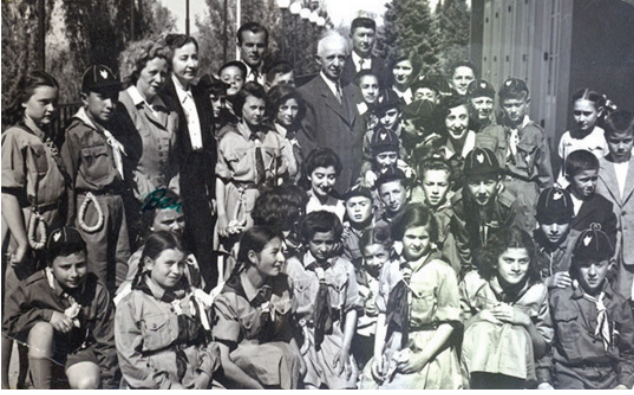
F.5- Çankaya Köşkü'nde Cumhurbaşkanı İsmet İnönü ile (1950-51)