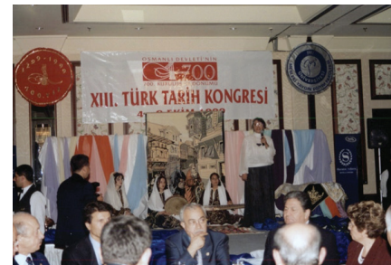
F.20- 13. Türk Tarih Kongresi. Gazi Üniversitesi Mesleki Yaygın Eğitim Fakültesi Defilesi (1999)

Unesco Milli Komisyonu Kültür Kolunda çalıştı. 11-19 Ekim 1997 tarihinde Pakistan'ın İslamabad şehrinde düzenlenen Cultural Dimensions of Development konulu 8.Uluslararası D-8 Sempozyumu'na Kültür Bakanlığı tarafından görevlendirilerek katıldı. "A Glance To Traditional Turkish Arts From The Dimensions of the Cultural Development" konulu bildiri sundu. 1998 yılında Pakistan,