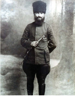
F.1- Sinan Tekelioğlu (Adana Cephesi Komutanı)