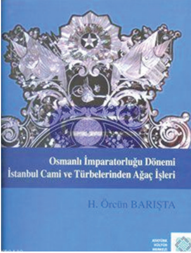
F.31- Osmanlı İmparatorluğu Dönemi İstanbul Cami ve Türbelerinden Ağaç İşleri Kitabı, 2009.

miş ayrıca alanda çalışan araştırmacılara yöntem belirleme, terminoloji kullanımı gibi konularda örnek oldu.