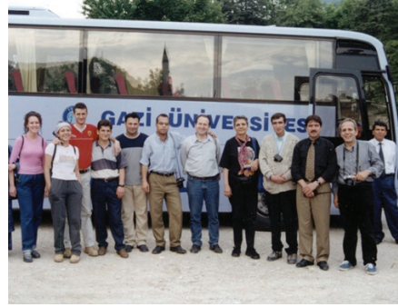
F. 22- Göynük Yüzezy Araştırmasında Sanat Tarihi Bölümü hoca ve öğrencileriyle (2000)

2000 yılında Gazi Üniversitesi'nin yayınladığı Gazi Sanat Dergisi'nde Yayın Kurulu üyeliği yaptı. 2002 yılında Folklor Araştırmaları Kurumundan 2001 Yılı Türk Halk Kültürüne Hizmet Ödülü ve Motif Halk Oyunları Eğitim Derneği Gençlik ve Spor Kulübü'nden 2003 Maddi Folklor Ürünlerini Derleme Ödülü aldı.