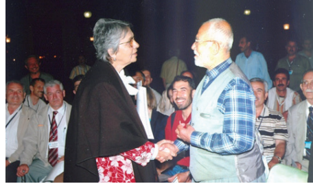
F.25- Dolmabahçe Sarayı-Halk Plastik Sanatçıları Ödül Töreni (2005)