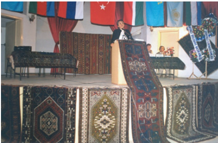
F.15- Kayseri Halı Kongresi (2004)