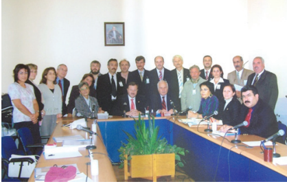
F.24- T.B.M.M. El Sanatları Araştırma Komisyonu (2005)

2005 yılında Türkiye Büyük Millet Meclisi Başkanlığı Geleneksel Türk El Sanatları Üretici ve Sanatkarlarının Sorunlarının Araştırılarak, El Sanatlarının Geliştirilmesi, Korunması ve Gelecek Kuşaklara Aktarılması İçin Alınması Gerekliliği Önlemlerin Belirlenmesi Amacıyla Kurulan Meclis Araştırması Komisyonu(10/128)nda uzman olarak görev yaptı.