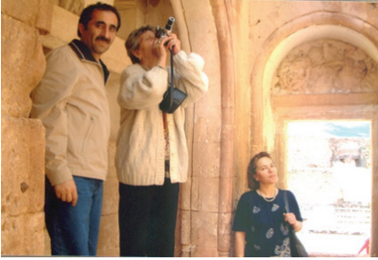
F.28- Doğu Beyazıt İshak Paşa Sarayı 2003