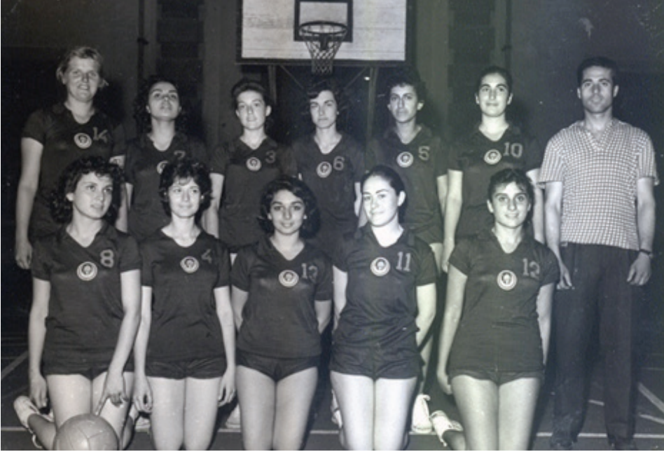
F.7- Kolejlerarası Avrupa Şampiyonası, İtalya (1958)