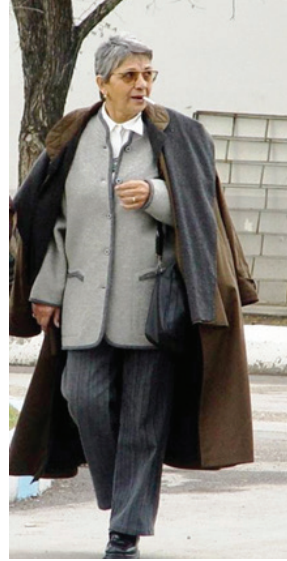
F.34- Ankara Kalesi (2006)

Bir türlü yakasını kurtaramadığı sigara (Maltepe sigarası) tiryakiliği, talihsiz hastalığında da başrolü üstlendi. Yavaş yavaş ortaya çıkan belirtiler, görme bozukluklarına neden olduğunda bile göremezsem günlük hayatımı nasıl yaşarım endişesinden çok; ilk sözleri, “ Ben göremezsem nasıl okurum, nasıl yazarım? ” olmuştur. Yazamazsa yaşayamayacağını çok iyi biliyordu... 4