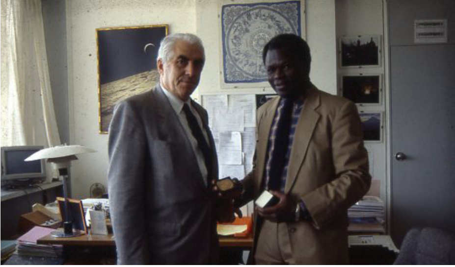
F.15- Unesco İpek Yolu Projesine yaptığı katkılardan dolayı Proje Başkanı Doudou Diène'den “Üstün Hizmet Madalyası”nı alırken. Paris, 14 Mayıs 1993.