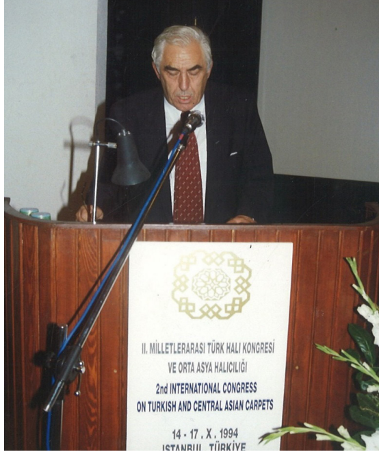
F.4- II. Milletlerarası Türk Halı Kongresi ve Orta Asya Halıcılığı açılış konuşmasını yaparken. Harbiye Kültür Merkezi, İstanbul