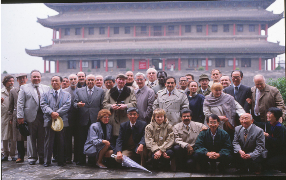
F.12- Dünyanın dört bir yanından İpek Yolu projesine katılan delegelerle birlikte Tang dönemi başkenti Çang'an'daki sarayın önünde hatıra fotoğrafı