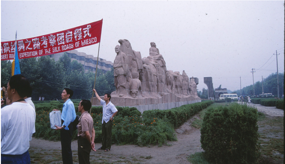
F.8- Tarihi İpek Yolu'ndaki kervanları temsil eden Çang'an'daki İpek Yolu anıtı