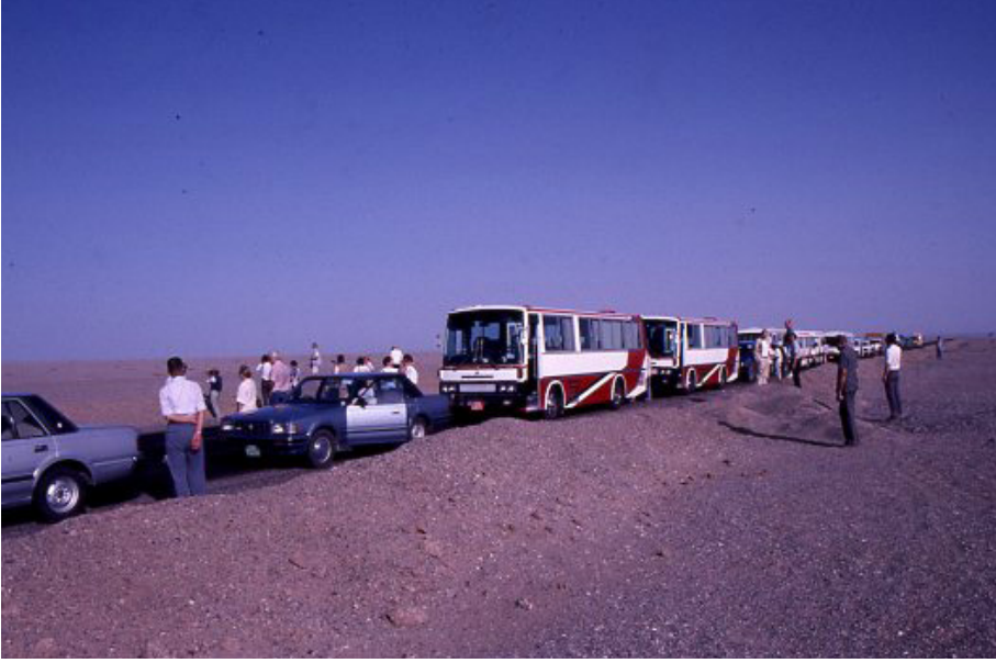
F.7- Unesco 1990, İpek Yolu kervanı Taklamakan çölünde