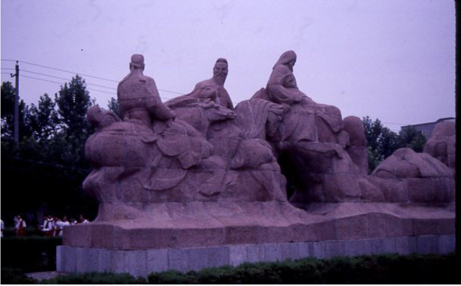
F.9- Aynı anıttan detay. Kervanlar, başındaki ve sonundaki atlı muhafızların eşliğinde güvenle hareket ederlerdi.