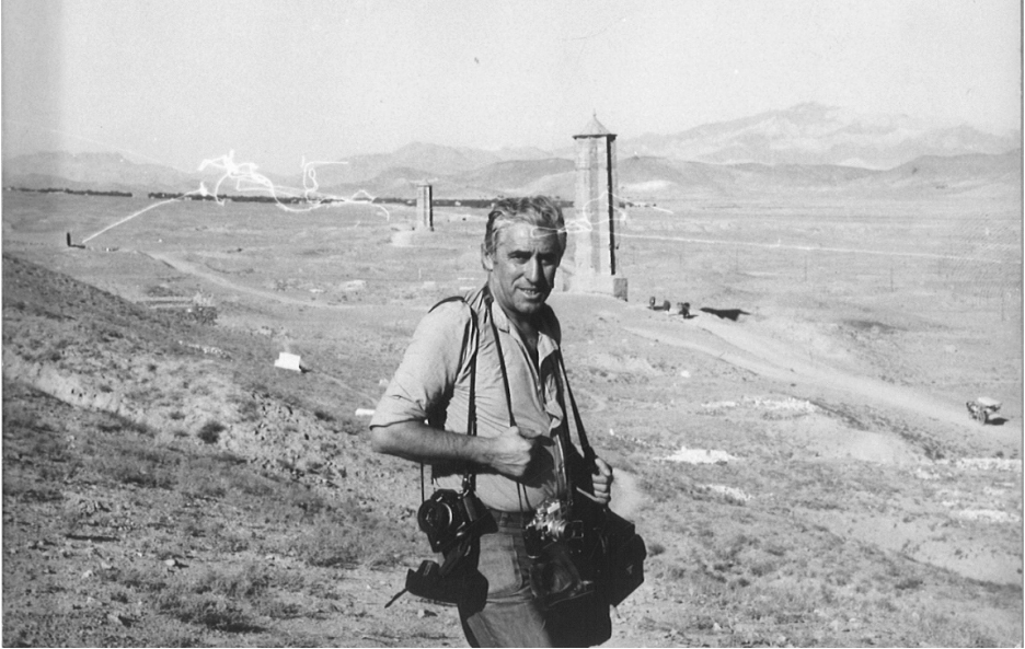
F.2- Gazneli Sultan Mahmut ve Mesut'a ait "Zafer minareleri"nin önünde. Gazne, Afganistan