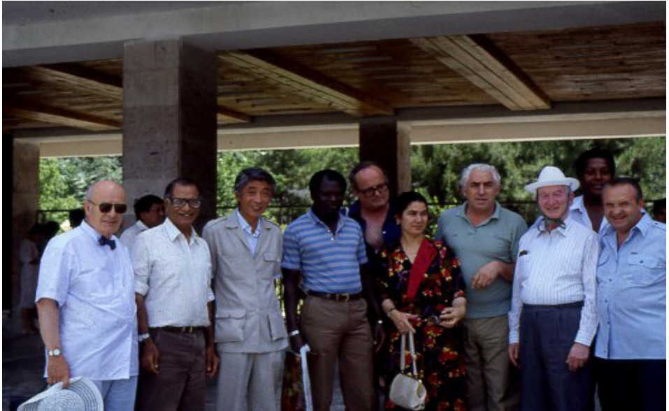
F.6- Unesco 1990 İpek Yolu bilimsel çalışmasının başlangıç noktası Türkmenistan, Aşkabat