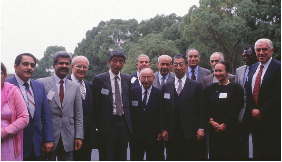
F.5- Unesco İpek Yolu toplantısı Japonya 1988 Toplantıya katılan delegelerin, Japon Prens H.E. Takahito Mikasa ile hatıra fotoğrafı