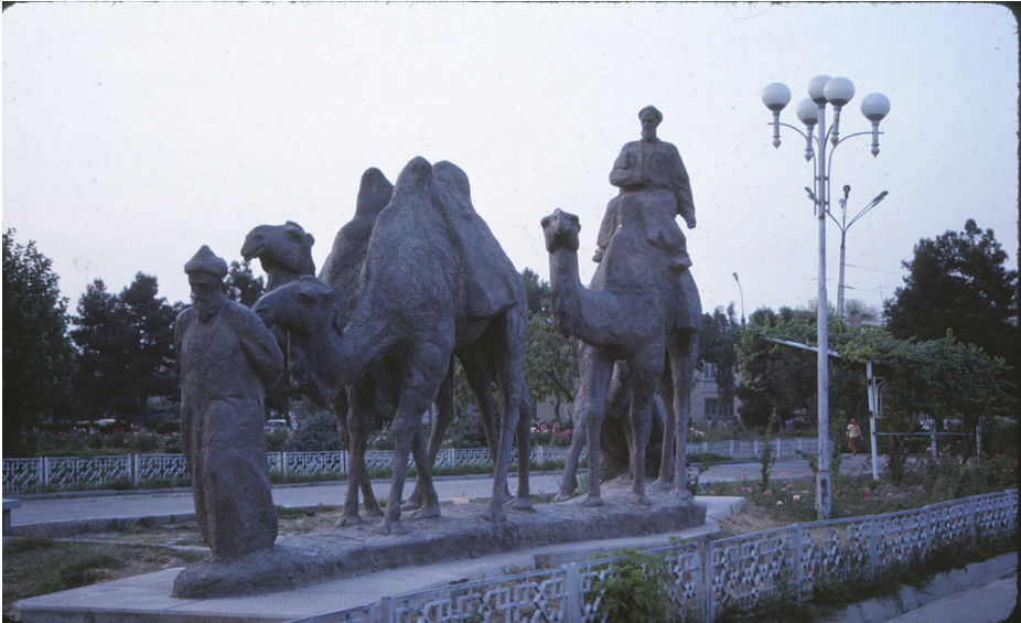
F.10- Yine Çang'an'da, aynı bulvar üzerinde bu sefer Soğdlu tüccarların yüklerini taşıyan Baktriyan develeri