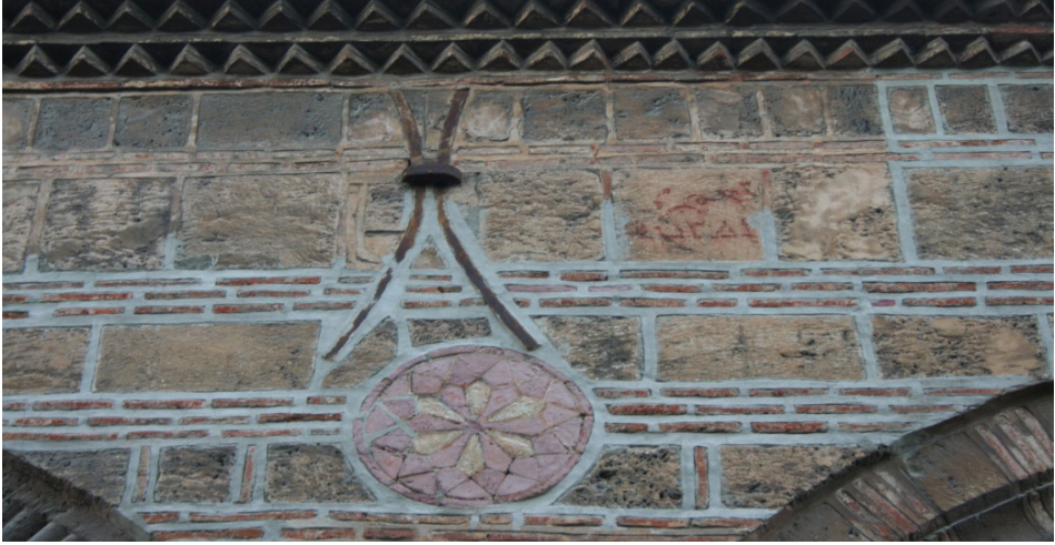
F.1- Orhan Zaviyesi Giriş Revakında Bulunan Tamir Tarihi

Depremler nedeniyle de zarar gören caminin cephesindeki alt pencereler 1904 yılında minare ise 1905 yılında onarılmıştır. 10 1904 yılında yapılan onarımlarda pencerelerin üstleri boşaltılarak, pencereler dikdörtgen görünümünden çıkartılıp kemerli bir form kazanmıştır. 11 Yapı 1963 yılında da onarılmıştır. 12 Son cemaat revakının dışında kırmızı renkli boya ile Osmanlıca “tağmir 1381” yazmaktadır (F.1). Hicri 1381 yılı da Miladi 1963 yılına tekabül eder. Osmanlıca yazılmış ve hicri tarih verilmiş olmasına karşılık bu onarımın, 1963 onarımı olduğu anlaşılmaktadır.