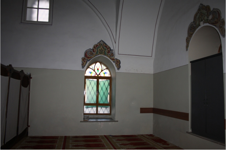
F.6- Caminin Batı Cephesinde Bulunan Kadınlık Bölümünün, Kuzey ve Batı Cephelerine Sonradan Açılan Pencere