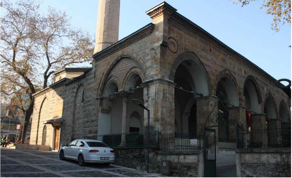
F.7- Caminin Doğu Cephesi ve Bu Cepheye 1905 Yılında Açılan Kapı