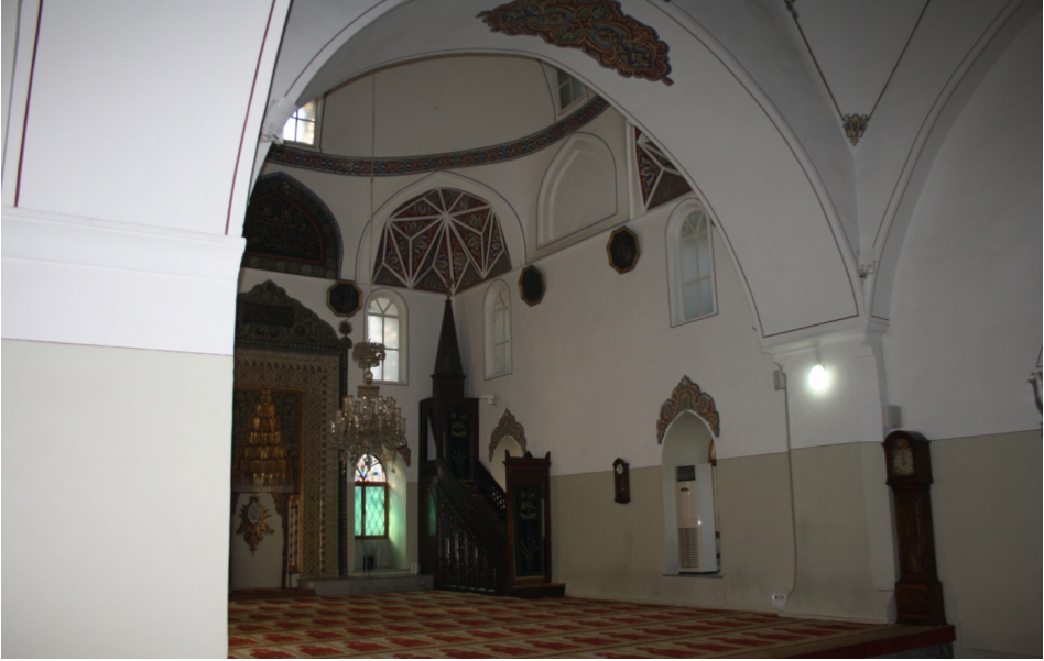
F.11- Caminin Güney-Batı Cephesi

fildir (F.11). 1619 tarihli bir belgeden; devir okuyanlar için yapılmış mahfilin kuzey cephede bulunan kapı üzerinde olmakla birlikte, insanların yüzü güneye dönükken arkalarında Kur'an okunmasının Kur'ana hürmetsizlik olacağından minbere yakın bir mahfil inşa edilmesi için talepte bulunulduğu ve bu talebin sonucunda da mahfil inşa edildiği öğrenilmektedir. 41 Elimizdeki arşiv planı bu bilgiyi doğrular. Planının batı cephesinde, caminin orta aksını kapatan iki kubbenin oturduğu kemerin başlangıcında yer alan mahfil 1619 tarihinden sonra yapıya eklenen mahfil olmalıdır. Bu mahfilin arşivdeki planda görülüyor olması aynı zamanda planın çizildiği tarihi de en azından 1619 yılı sonrasına çeker. Bursa Yeşil Camisi'nde de benzer bir mahfil olduğu yine arşivde bulunan bu camiye ait plandan öğrenilmektedir.