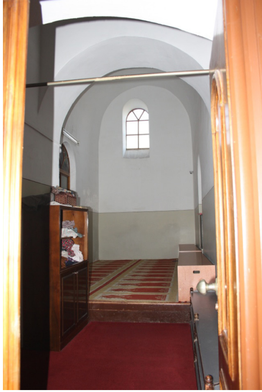
F.13- Son Cemaat Revakı ile Cami Arasında Kalan Koridor

Arşiv planında avlunun kuzeybatısında ve avlu duvarı içinde gösterilen tuvaletler kaldırılmıştır. Bunların yerine inşa edilen tuvaletler yine aynı cephede bulunmakta ancak artık avlu duvarı içinde değil, kot farkıyla birlikte avlu duvarının altında yer almaktadır. Arşiv planında görülen ancak günümüzde mevcut olmayan detaylardan sonuncusu ise avlunun kuzeydoğu köşesinde bulunan imaretin bölümlerinden zahire ambarı ve ahırdır. İmaret 1936 yılında yıkılmıştır. 42