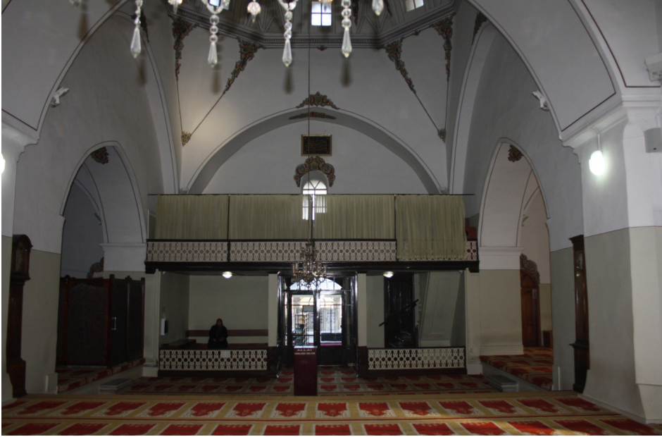
F.12- Caminin Kuzey Cephesinde Bulunan Mahfil

Şimdilerde mevcut olmayan ancak arşiv planında görülen detaylardan bir diğeri, kuzeybatı ve kuzeydoğu cephelerde, tabhane hücrelerine giriş kapılarının yanındaki duvarlardır. Bu duvarların kaldırılması ile arşiv planında “mağaza” tanımlamasının içine dâhil edilmiş iki küçük mekân değiştirilmiş ve özellikle batı cephede bu bölüm bir koridora dönüştürülmüştür (F.13).