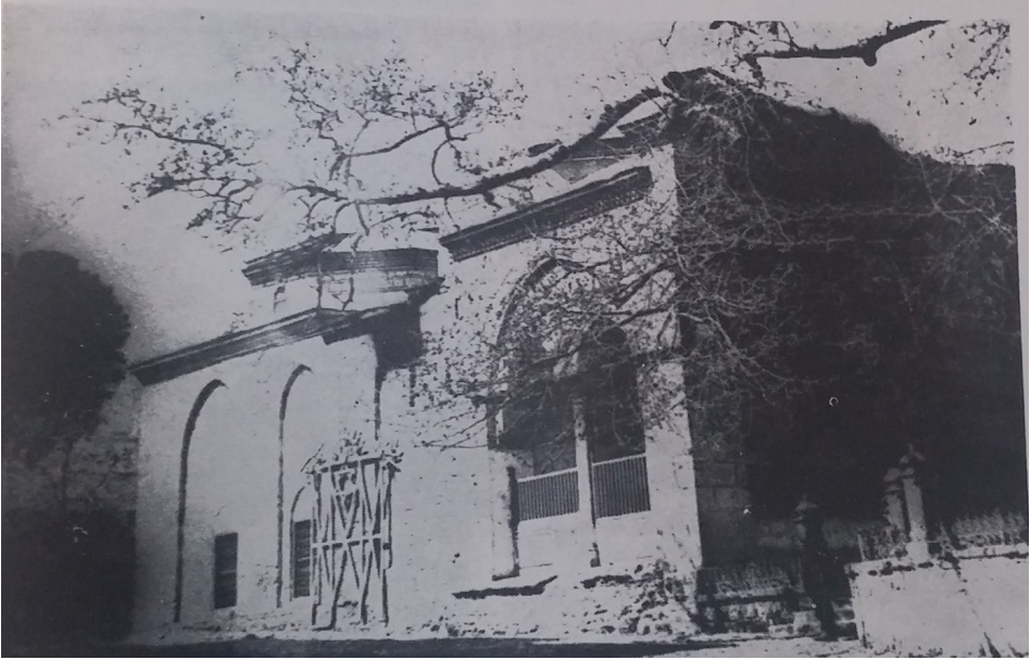
F.8- Caminin Doğu Cephesinin 1882 Yılındaki Görünümü (E.H.Ayverdi'den)

1855 tarihli evkaf defterinden “cam-i şerif derinunda” 12 adet pencere olduğu öğrenilmekte. 35 Cami-i şerif olarak tanımlanan bölümün ard arda iki kubbe ile örtülü orta aks olduğu düşünüldüğünde, arşiv planındaki altı adet alt pencerenin üstlerindeki ikinci sıra pencereleri ile 12 adet pencere eder ve arşiv planı ile 1855 tarihli evkaf defteri bir kez daha birbirini doğrulamış olur. Toplamda yapının içinde küçüklü büyüklü 22 adet pencere bulunduğunu yine evkaf defterinden öğrenmekteyiz. 36 Günümüzde camide bulunan küçüklü büyüklü pencere sayısı (üst örtüde bulunanlar hariç) 30’dur. 15782 numaralı evkaf defteri sayesinde, sekiz adet pencerenin 1855 onarımı da dâhil olmak üzere, sonraki süreçte yapılan onarımlarda açıldığı anlaşılmaktadır.