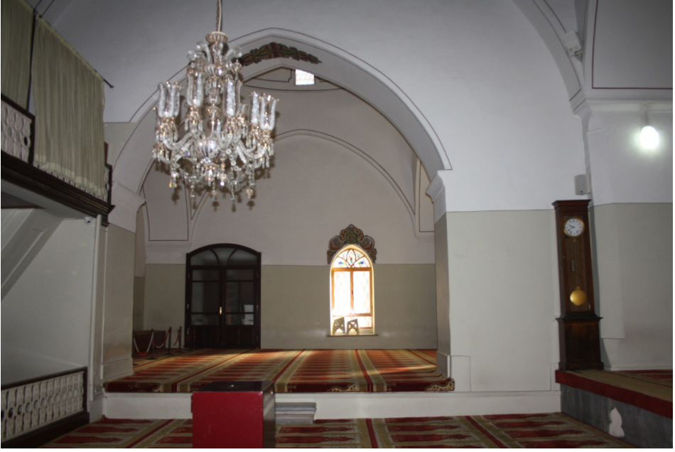
F.4- Caminin Doğu Cephesinde Bulunan ve Sonradan Açılan Kemer