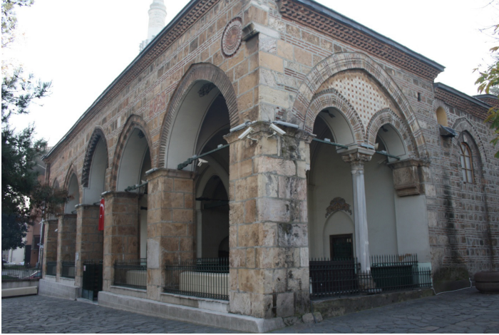
F.10- Son Cemaat Revakı Batı Cephesinde Bulunan Devşirme Sütun ve Kemerler

1855 depremi sonrası hazırlanan raporlardan yapının iyi durumda olduğu ve minaresinin hasarlı olduğunun anlaşılmasına karşılık, 39 Başbakanlık Osmanlı Arşivi'nde bulunan evkaf defterinden yapının geniş çaplı bir onarıma gereksinimi olduğu anlaşılmaktadır. Öyle ki dört adet müceddeden ayak inşa edildiği bilgisi bulunmaktadır. Yapıda altı adet ayak bulunur ve bunlar da son cemaat revakındadır.