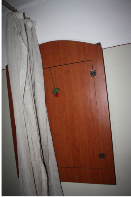
F.9- Caminin Harim Giriş Kapısının Batısında Bulunan Niş