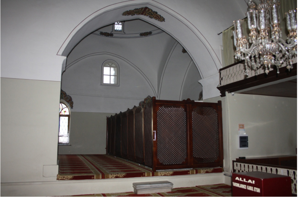
F.5- Caminin Batı Cephesinde Bulunan ve Sonradan Açılan Kemer