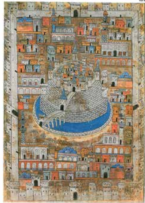
Resim 1. Matrakçı Nasuh, Beyan-ı Menazil- Sefer-i Irakeyn , "105. Varak b Yüzü Kağıt üzerine fırça çalışması" (16.yy. İstanbul Üniversitesi Kütüphanesi, İstanbul, Atasoy, 2015)

Çağdaş planlama çalışmalarının bir kısmında, günümüzde dahi bulunmayan bu sistematik açık fonksiyon şemalı plan tasvirleri bize sanatçının, yapıları salt görsel hacimler olarak algılamasından çok daha derin bir mimari bilgi donanımına sahip olduğunu da göstermektedir. Kentlerin konum planları, birbirleri ile ilişkileri, bağlantı kapıları, köprü ve yol gibi ulaşım bağlantıları minyatürlerinde görsel destekler ile güçlendirilerek görüntülenmiştir.