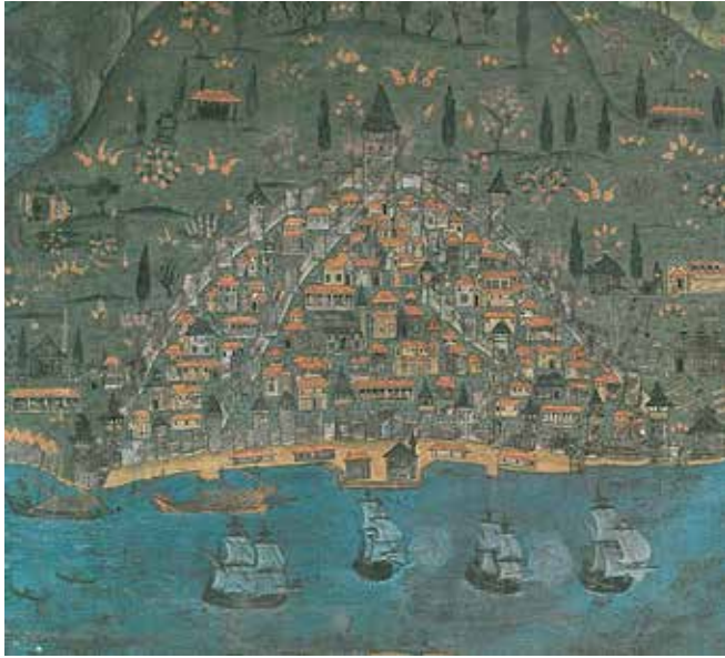
Resim 2. Matrakçı Nasuh, Beyan-ı Menazil- Sefer-i Irakeyn, “9. Varak a yüzü Galata Kağıt üzerine fırça çalışması” (16.yy. İstanbul Üniversite Kütüphanesi, İstanbul Atasoy, 2015)

İstanbul sahnelerinin çalışıldığı Toplam 7 adet, albümden seçilen “Galata betimlemesi” minyatürü incelendiğinde şaşırtıcı şekilde günümüz kent silueti ile örtüşen tarihi doku silueti de görülmektedir. Matrakçı’nın Galata Minyatürü’nde yer alan tarihi yapıların birçoğu günümüzde de aynı yerlerde bulunmaktadır. Bu güne ulaşmamış olan yapıların ise yıkılmış olabileceği düşünülmektedir. Klasik minyatürlerde görülen, sanatçının kurgusu olan yerleştirmeler ise Matrakçı’nın minyatürlerinde görülmemektedir. Genel olarak minyatürlerde görülen sanatçının tasarladığı ve aslında olmayan mekânlar, konuya adaptasyonu için olayların başka bir mekânda gösterilmesi gibi çalışmalar, Matrakçı’nın ‘Beyan-ı Menazil- Sefer-i Irakeyn’ adlı eserindeki minyatürlerde yer almamaktadır.