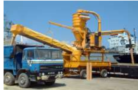
Şekil 4. Pnömatik (Figure 4. Pneumatic)