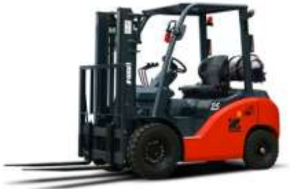
Şekil 3. Dizel forklift (Figure 3. Diesel forklift)

İçten yanmalı motorlu ve dizel yakıt kullanan Şekil 3'te gösterilen forkliftler, en rahat kullanımı olan forkliftlerdir. 24 saat kullanılıp dizel yakıtı tamamlanarak yine 24 saat kullanılmaya devam edilebilir. Ancak egzoz emisyonu sebebiyle kapalı, havalandırması iyi olmayan mekânlarda kullanımı mümkün değildir. Genellikle dış mekânlarda tercih edilir. Kaldırma kapasiteleri yüksek makinelerde tercih edilir. Konteyner taşımacılığında kullanılanların kapasiteleri 40 tona kadar çıkar [9].