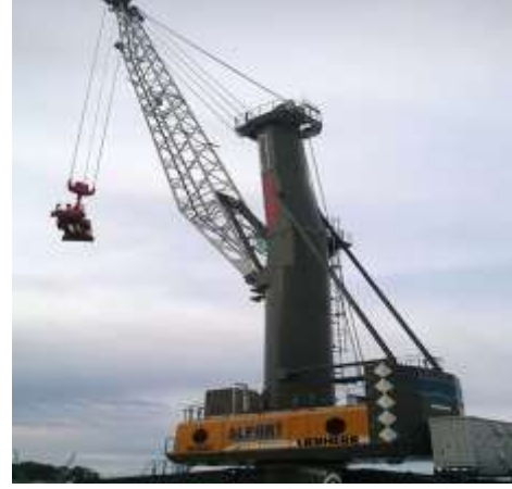
Şekil 2. Trabzon Limanı mobil vinç (Figure 2. Mobile crane)