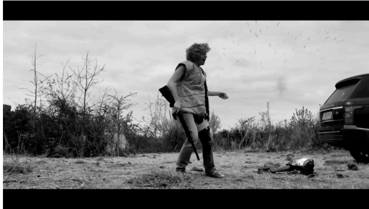
Sahne 15: Black Mirror 4. Sezon 5. Bölüm / Metal Kafa (Metal Head) 35. Dakika 22. Saniye

Hasar gören köpek robot yere düşüyor ancak hala çalışır durumdadır. Kadın elindeki tüfeğe tekrar mermi doldurmaya çalışırken robot elindeki kesici ile kadına doğru ilerleyip bacağını yaralıyor. Ardından kadın robotu tekrar vuruyor ve robot yere düşüyor.