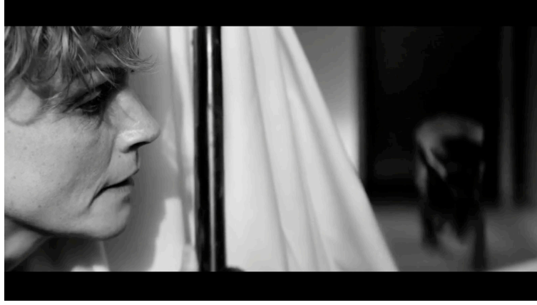
Sahne 11: Black Mirror 4. Sezon 5. Bölüm / Metal Kafa (Metal Head) 32. Dakika 49. Saniye

Kadın saklanmaya devam ediyor ve köpek robot kadının üzerine doğru orada olduğunu biliyormuş gibi ilerliyor. Gerçek bir insan gibi kontrol etmeye gidiyor.