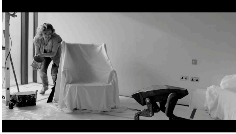
Sahne 12: Black Mirror 4. Sezon 5. Bölüm / Metal Kafa (Metal Head) 32. Dakika 52. Saniye

Kadın saklanmaya devam ediyor ve köpek robot kadının üzerine doğru orada olduğunu biliyormuş gibi ilerliyor. Gerçek bir insan gibi kontrol etmeye gidiyor.