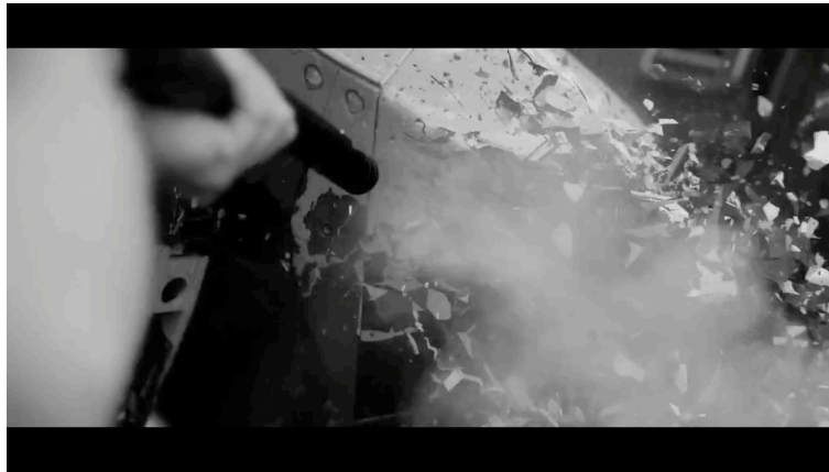
Sahne 13: Black Mirror 4. Sezon 5. Bölüm / Metal Kafa (Metal Head) 34. Dakika 34. Saniye

Kadın odadaki koltuğun arkasına saklanırken robot üzerine doğru geliyordu tam o sırada bulduğu boyayı robotun üzerine döküyor ve bu şekilde robotun görmesini engelliyor. Robotun kafa kısmı boyanınca sadece ses gelen yere doğru gidip elindeki kesici ile delmeye başlıyor. Kadın bu sırada koşarak dışarıya çıkıyor.