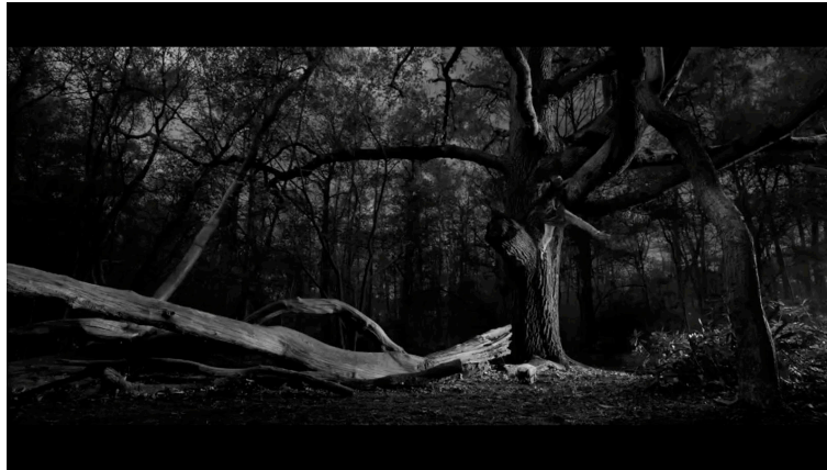
Sahne 7: Black Mirror 4. Sezon 5. Bölüm / Metal Kafa (Metal Head) 19. Dakika 45. Saniye

Robot köpekten kaçan kadın korku ve panik halinde ormanlık alanda büyükçe bir ağaca tırmanmaktadır. Robot köpek ise daha sonra gelip ortamı sensör gibi bir uygulaması ile taramaktadır. Hedefini yani kadını bulmak için sağa sola ve yukarı bakmaktadır.