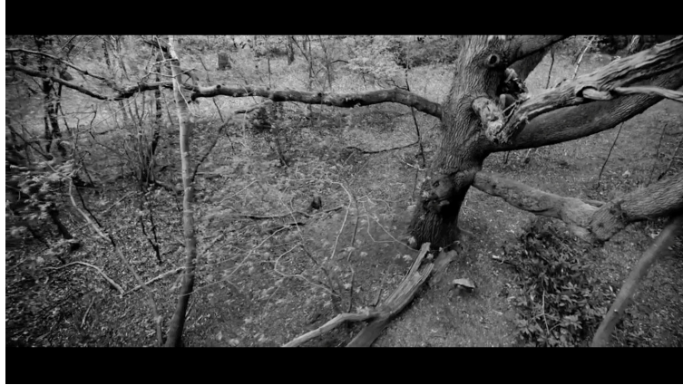
Sahne 6: Black Mirror 4. Sezon 5. Bölüm / Metal Kafa (Metal Head) 18. Dakika 25. Saniye

İçeri giren robot köpeğe kadın korku ve panik içerisinde küfür ederek ayakları ile vurup etkisiz hale getirmeye çalışıyor. Robot köpek konumunu sabitleyip saldırıda bulunmayı hedefliyor.