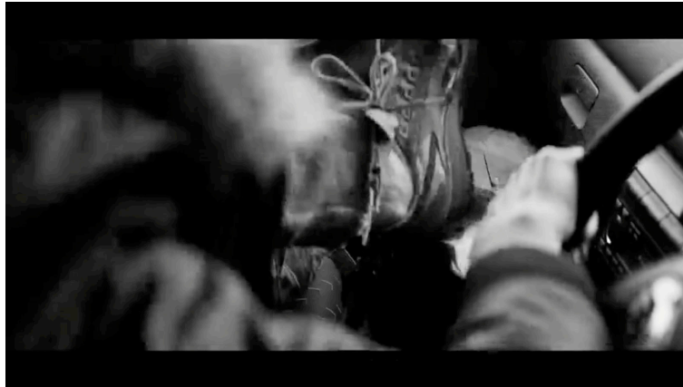
Sahne 5: Black Mirror 4. Sezon 5. Bölüm / Metal Kafa (Metal Head) 10. Dakika 31. Saniye

Köpek robot camı kırıp tıpkı bir insan gibi kayıp düşmemek için ön iki bacağı ile tutunmaktadır. Kayıp düşmemesi gerektiğini bilmektedir. Refleksif olarak davranışları bu görüntüden de belli olmaktadır.