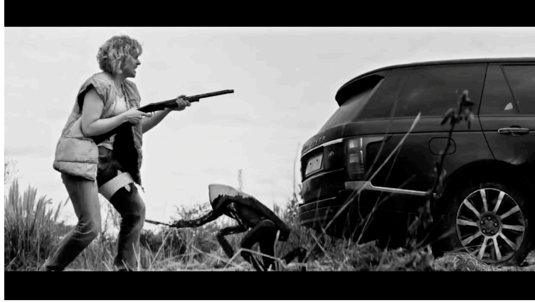
Sahne 14: Black Mirror 4. Sezon 5. Bölüm / Metal Kafa (Metal Head) 34. Dakika 54. Saniye

Kadın dışarı çıktığında içerideki cesetlerin üzerinden aldığı anahtarları alıp arabayı çalıştırmayı deniyor başarısız olunca radyoyu açıyor. Aracın tüm kapılarını da açınca elindeki tüfekle aracın arkasında pusuda bekliyor. Köpek robot sese doğru gelip aracın müzik çalan kolonlarını elindeki kesici ile bozuyor. En son diğer kapıdan çıkarken kadın tam kafa kısmından tüfekle robotu vuruyor ve robot yere düşüyor.