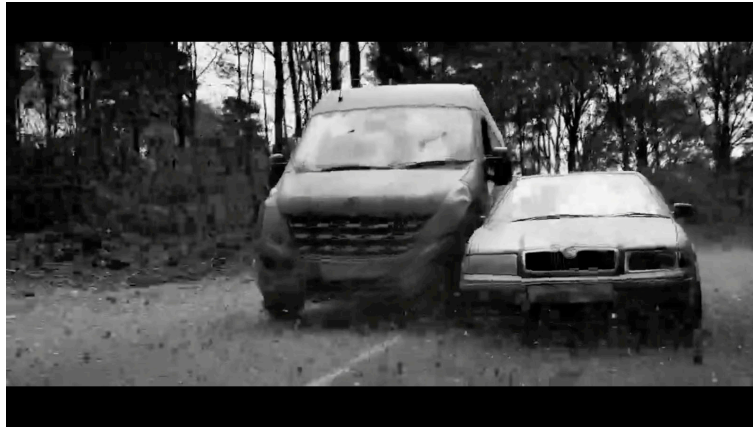
Sahne 2: Black Mirror 4. Sezon 5. Bölüm / Metal Kafa (Metal Head) 08. Dakika 57. Saniye

Başrol oyuncusu ambarda robot köpeğin bir kişiyi öldürmesi sonucu hemen dışarıya çıkıp arabaya binmiştir. Yapay zeka ürünü olan robot köpek hedefine odaklanarak arabanın peşinden gitmektedir. Manevra yapan aracın hızına göre oldukça hızlı bir şekilde toz çıkartarak koşmaktadır.