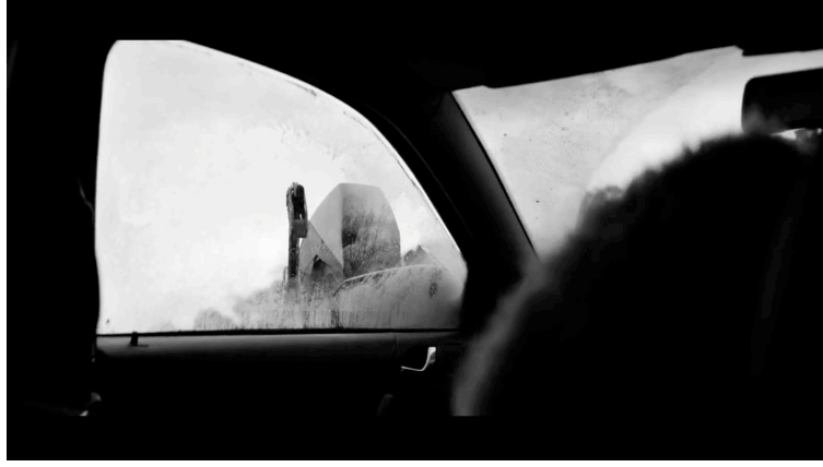
Sahne 3: Black Mirror 4. Sezon 5. Bölüm / Metal Kafa (Metal Head) 10. Dakika 27. Saniye

Bariyerlere çarparak uçurumun kenarında duran aracın peşinde giden robot köpek pencerenin önüne gelip camı kırılması gerektiğini bilmektedir. Bacağını çekiç gibi kullanmak için cama yaklaşmıştır. Camı kırıp başrol oyuncusuna ulaşmak için. Başrol oyuncusu korku ve panik halinde aracın içindedir.