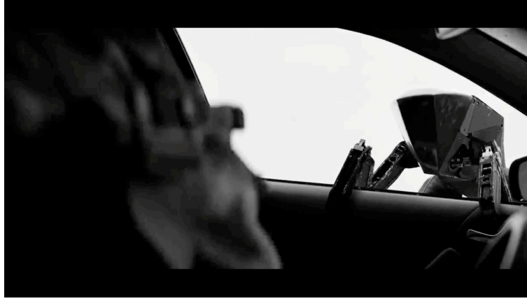
Sahne 4: Black Mirror 4. Sezon 5. Bölüm / Metal Kafa (Metal Head) 10. Dakika 30. Saniye

Bariyerlere çarparak uçurumun kenarında duran aracın peşinde giden robot köpek pencerenin önüne gelip camı kırılması gerektiğini bilmektedir. Bacağını çekiç gibi kullanmak için cama yaklaşmıştır. Camı kırıp başrol oyuncusuna ulaşmak için. Başrol oyuncusu korku ve panik halinde aracın içindedir.