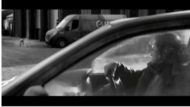
Sahne 1: Black Mirror 4. Sezon 5. Bölüm / Metal Kafa (Metal Head) 07. Dakika 37. Saniye

başlamaktadır. Metalhead, Black Mirror'ın bugüne kadar çekilmiş ilk siyah beyaz bölümüdür. Siyah beyaz tercihi hem yaşanan gerilimi hem de çaresizliği gözler önüne sermiştir. Bu makalede baş rol oyuncusu ile köpek şeklindeki robotun olduğu sahneler ele alınıp yapay zeka kapsamında incelenecektir.