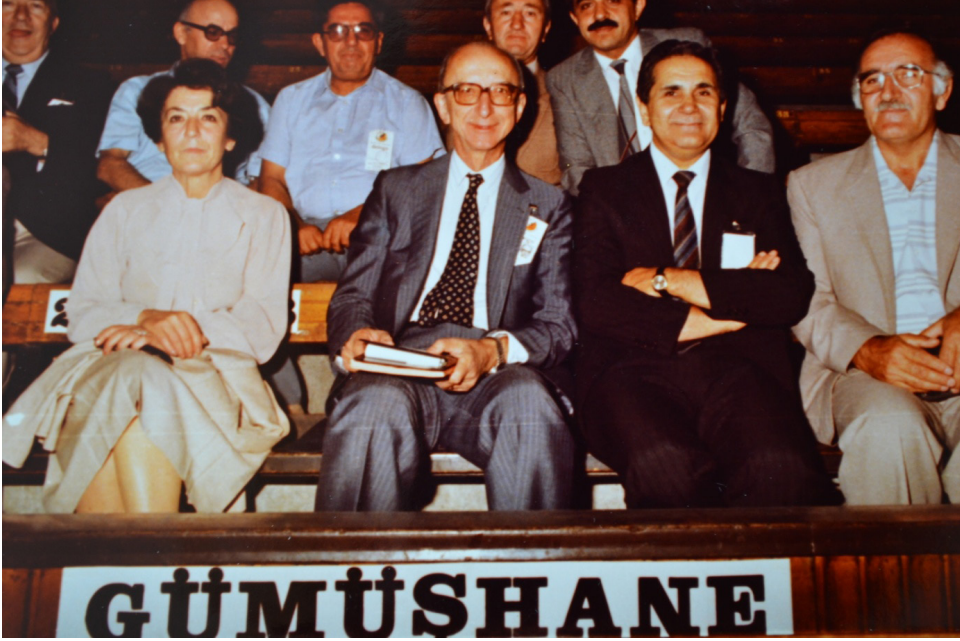
SODEP SEÇİM ÇALIŞMALARI, (ATILA SAV ALBÜMÜ)