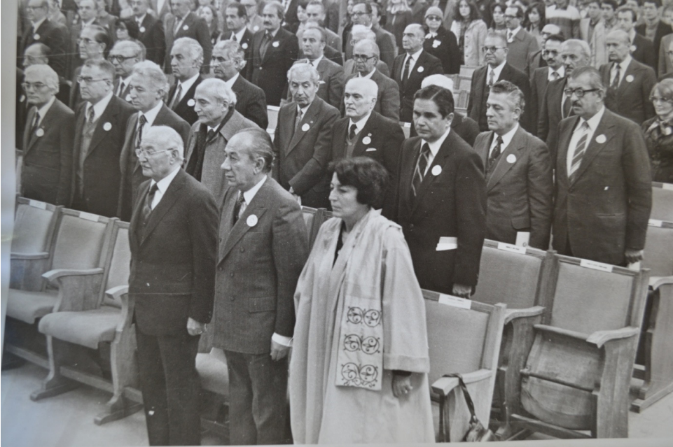
ANKARA HUKUK FAKÜLTESİ AKADEMİK AÇILIŞ YILI TÖRENİ (ATILA SAV ALBÜMÜ)