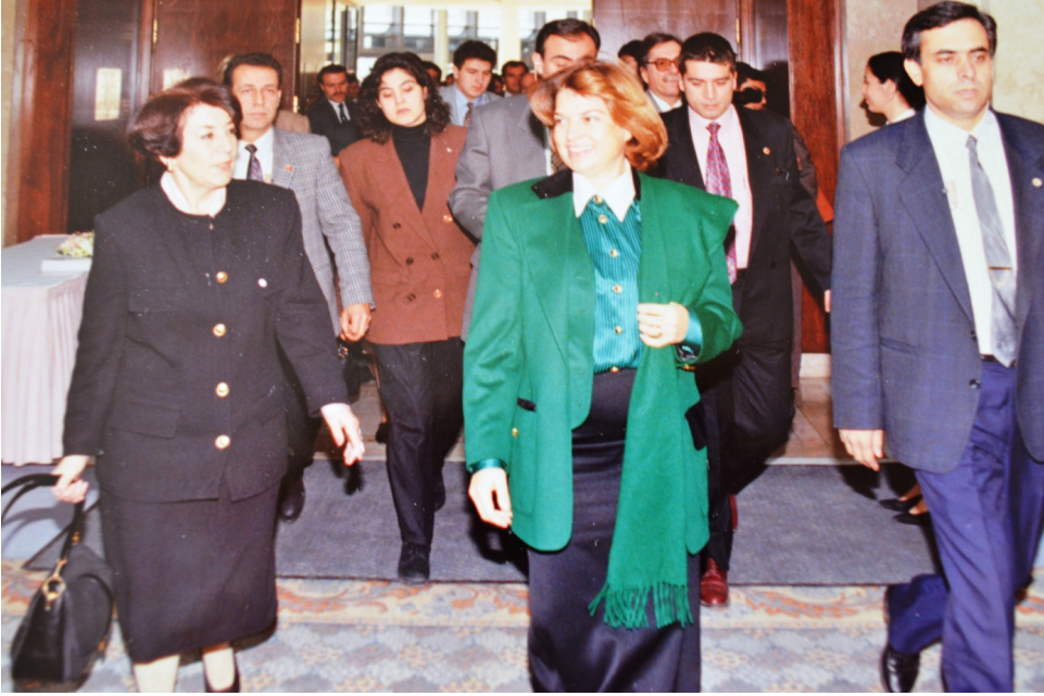
TANSU ÇİLLER ve TÜRKAN AKYOL 50. HÜKÜMET