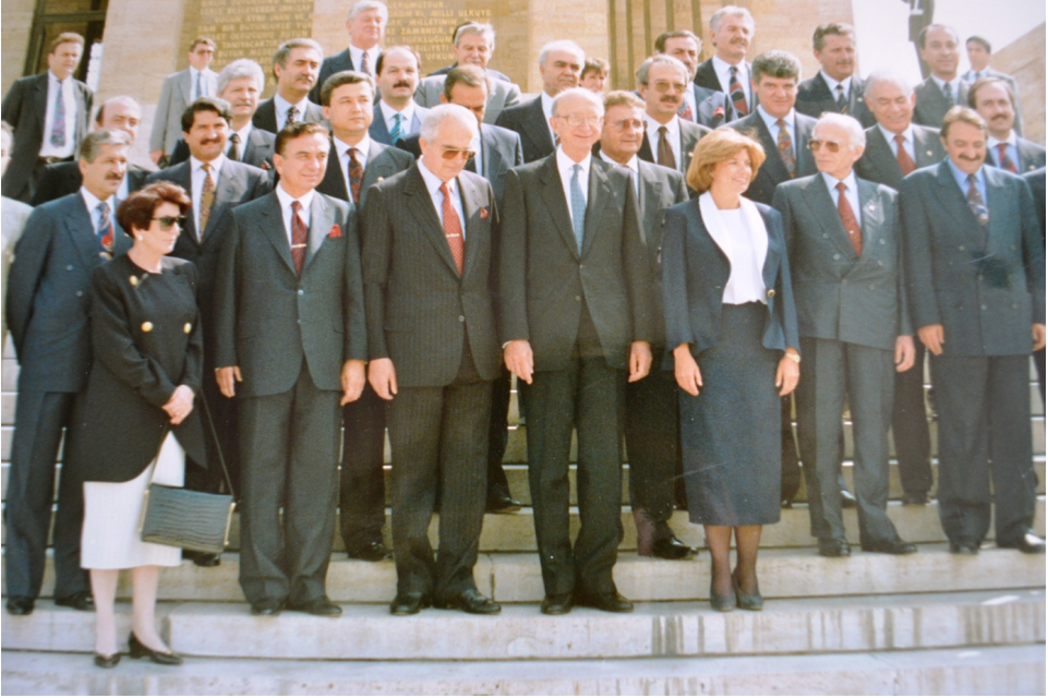
50. TANSU ÇİLLER HÜKÜMETİ ANITKABİR'DE (TÜRKAN AKYOL AİLE ALBÜM)