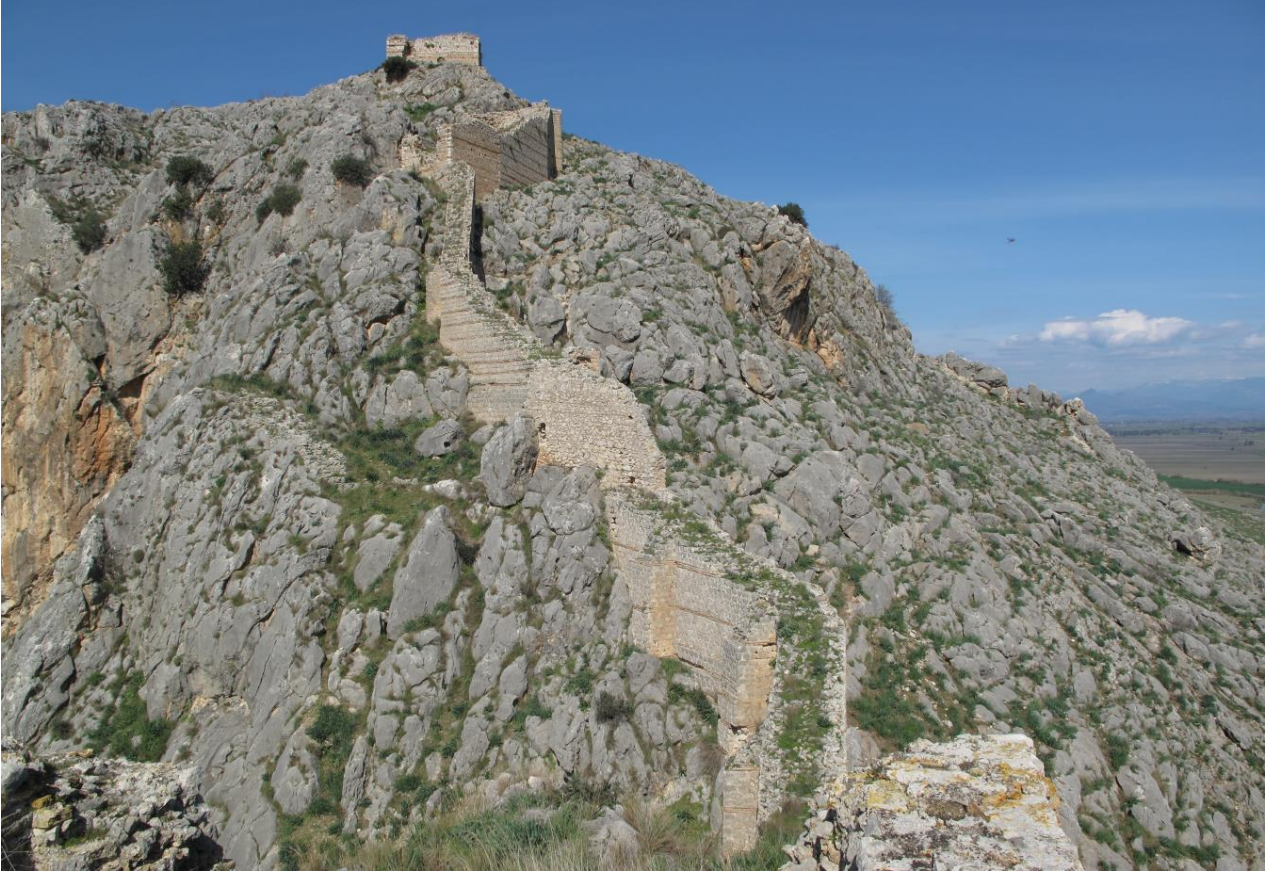
Şekil 15, Sur Duvarları ve Üst Taraftaki Sarnıç