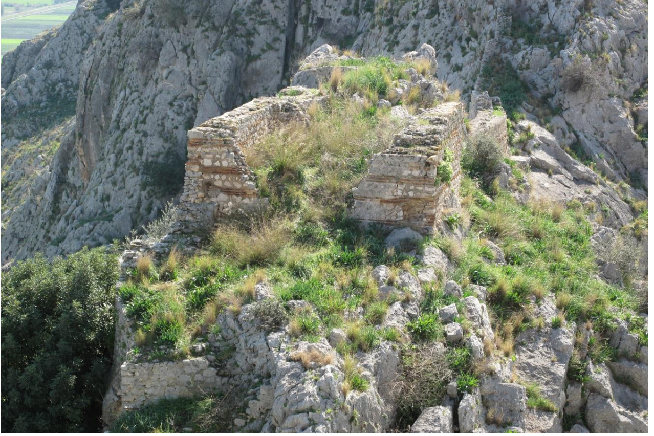
Şekil 11, Kuzey Surlardaki Kulelerden Biri