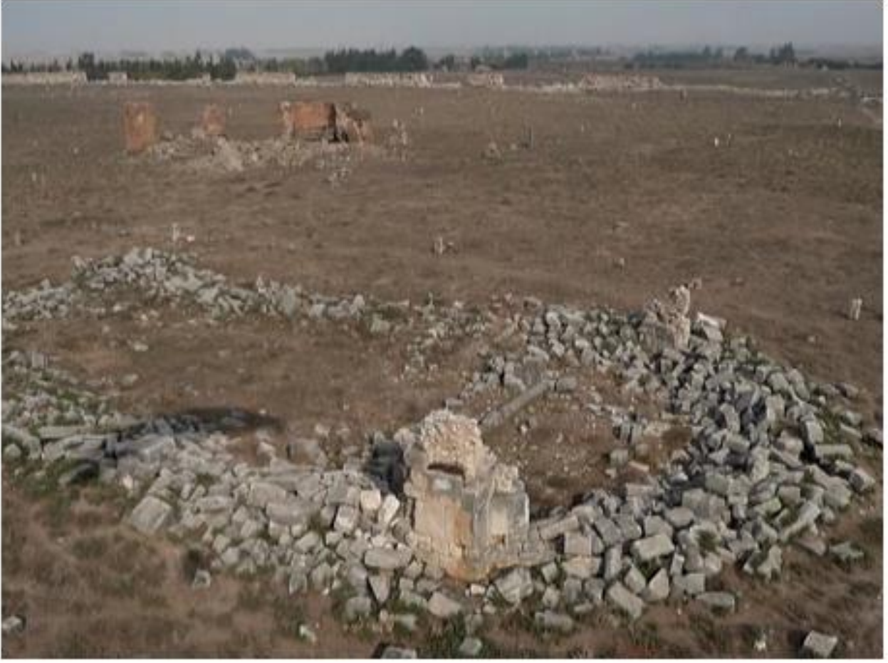
Şekil 3, Anavarza Kenti Bina Kalıntıları (Havariler Kilisesi). (THK)