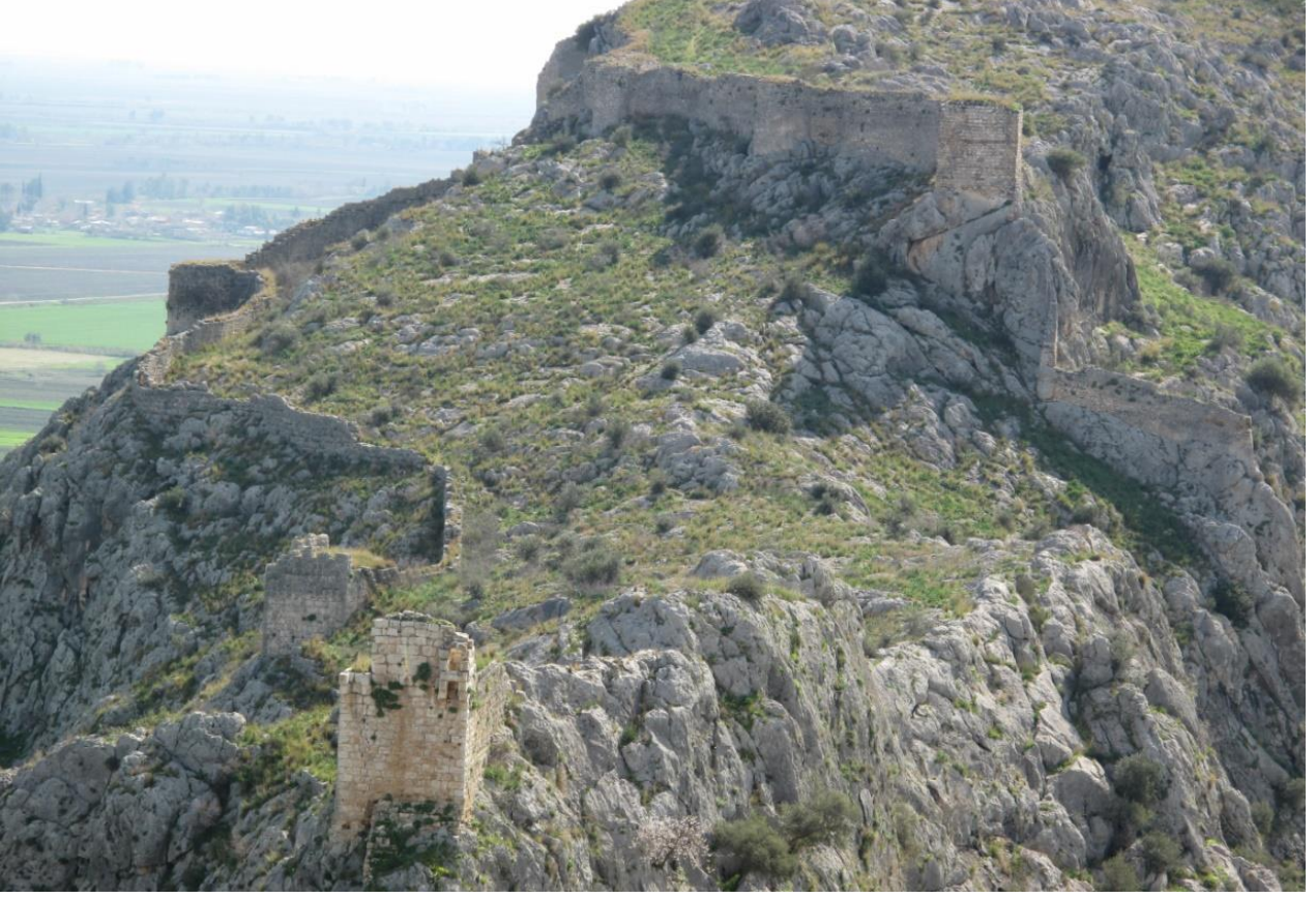
Şekil 7, Yukarı Şehir 2. Avlu ve Sur Duvarları