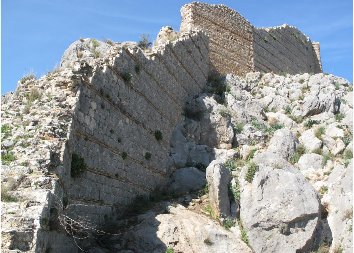
Şekil 14, Yukarı Şehir Kuzey Surları