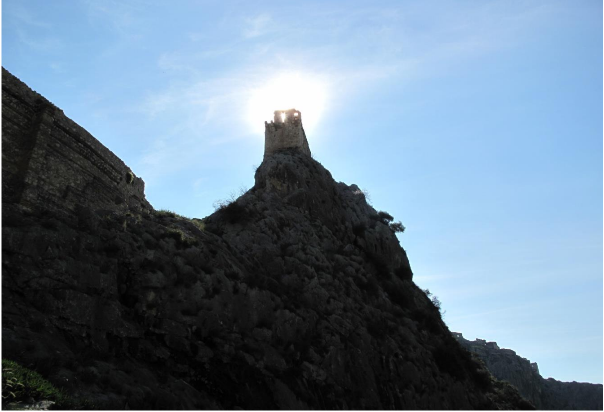
Şekil 9, 2. Avlunun Kuzey Uç Tarafındaki Kule