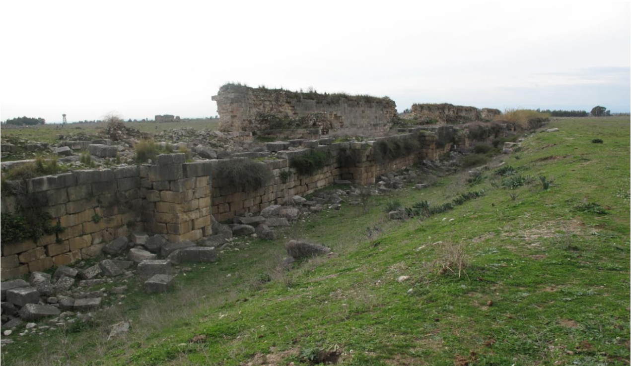
Şekil 4, Anavarza Kenti Kuzey Surları ve Hendek