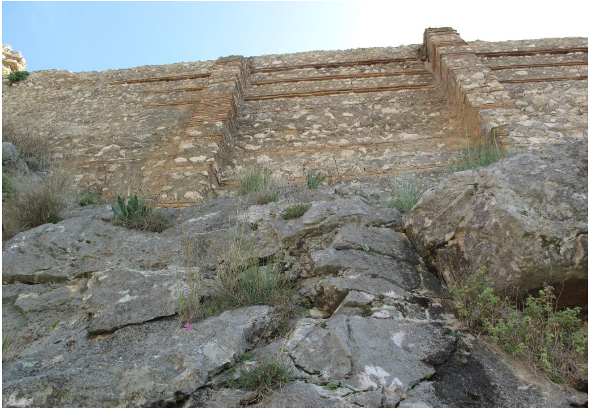
Şekil 10, İki Payandalı Sur duvarı