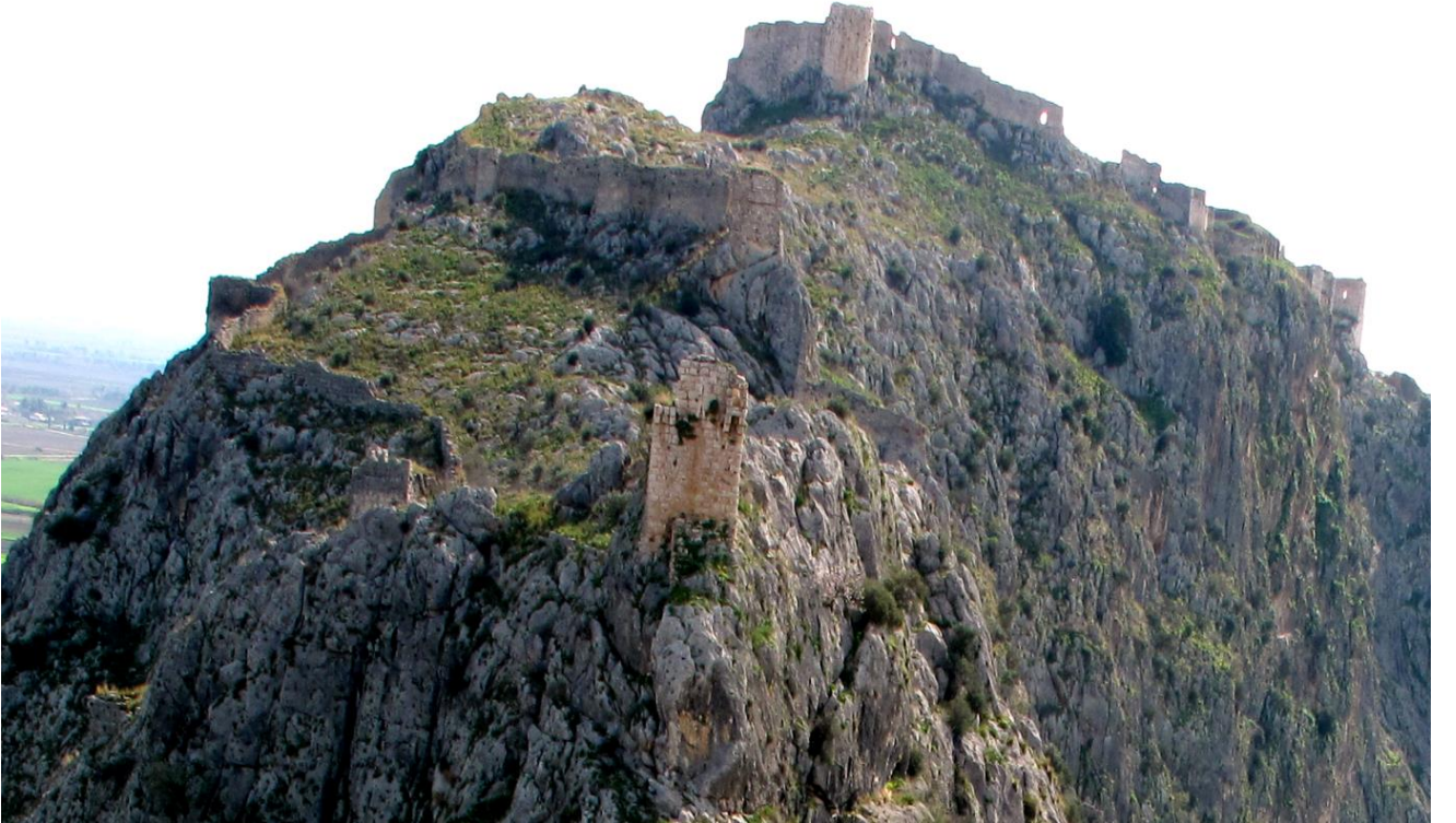
Şekil 6, Yukarı Şehir; Arkada Kale, Önde 1. ve 2. Avlu