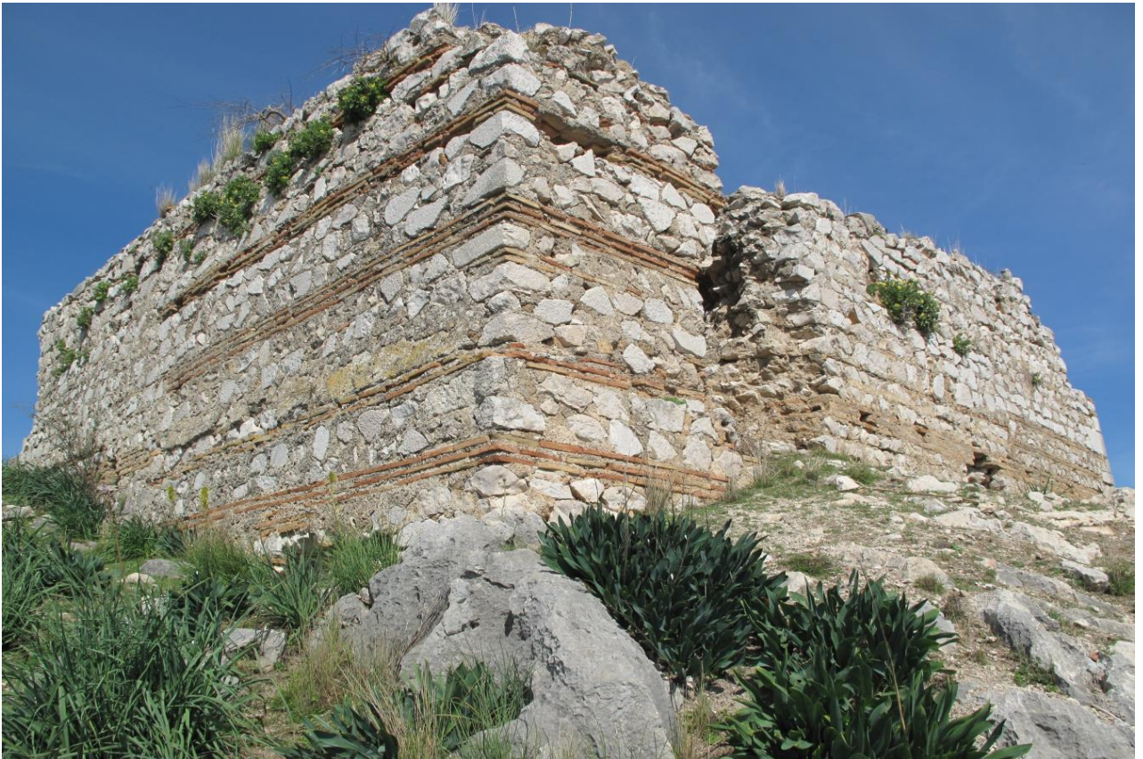
Şekil 16, Sarnıç