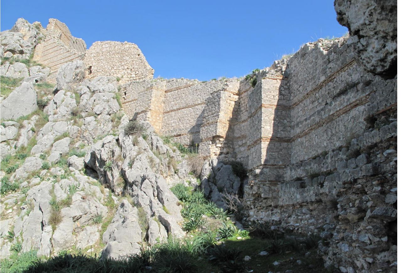
Şekil 12, Payandalarla Desteklenmiş Kuzey Surları