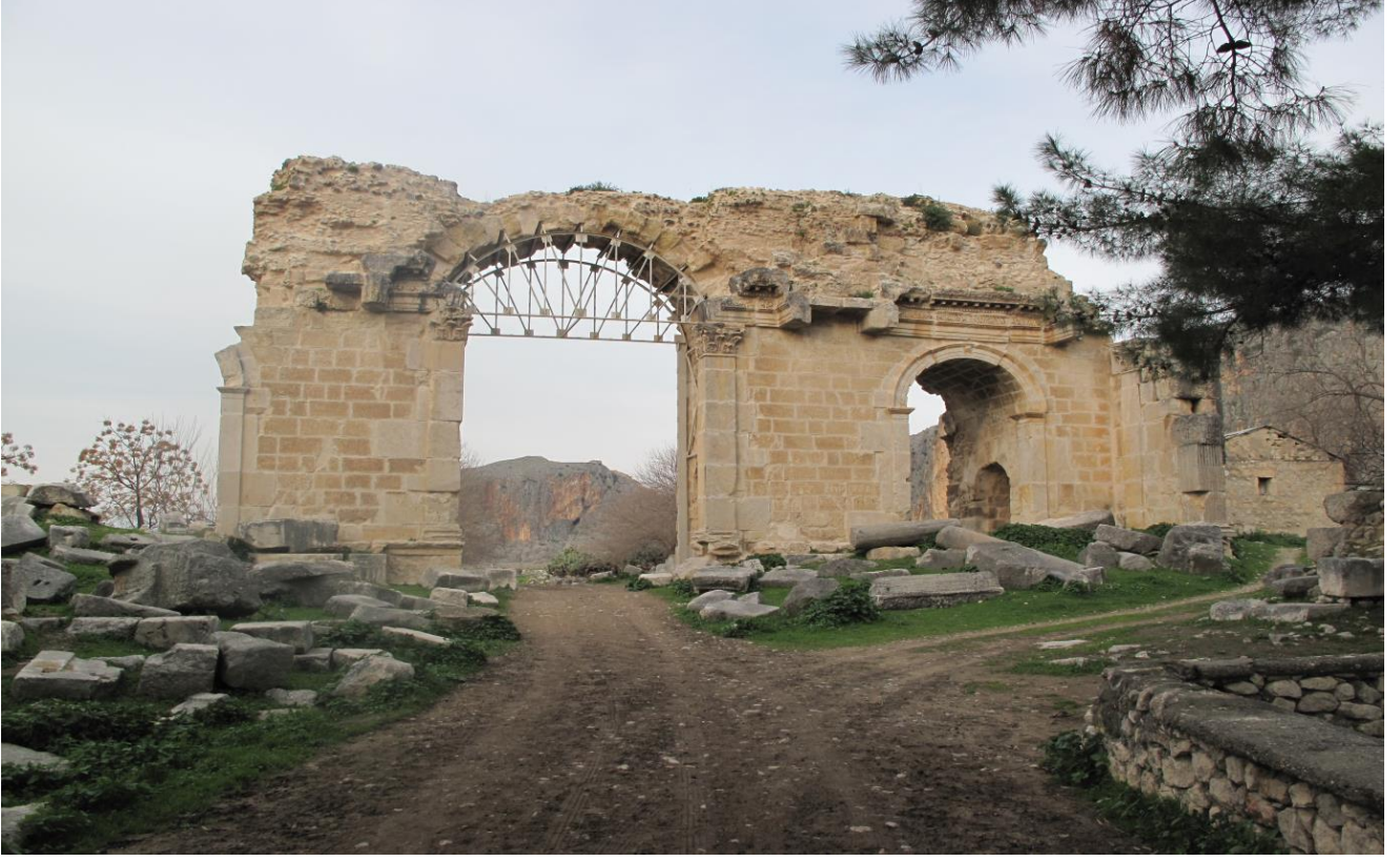
Şekil 5, Güney Surlarında Bulunan Zafer Takı