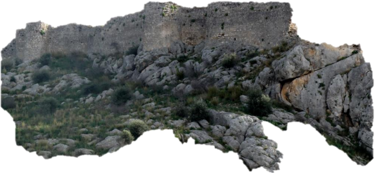
Şekil 8, 1. ve 2. Avluyu Ayıran 3 kuleli Sur Duvarı