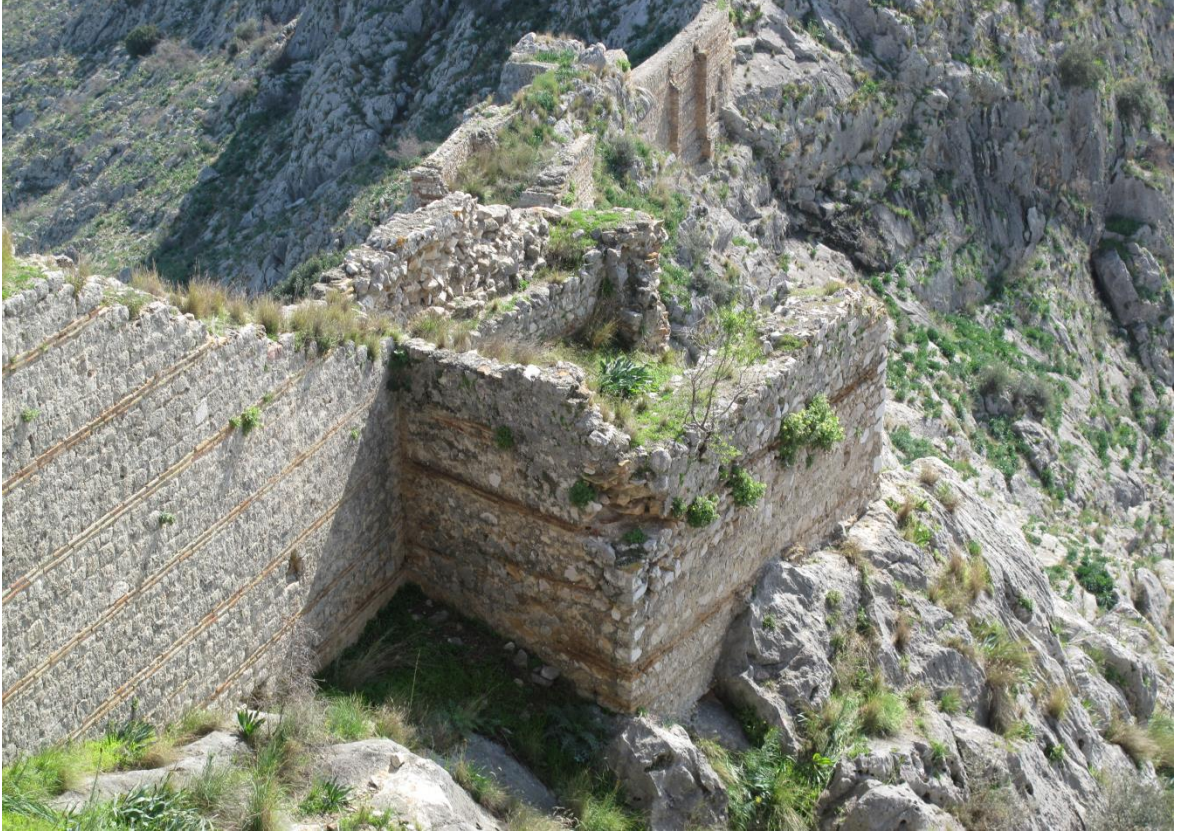
Şekil 13, Kuzey Surlarında Bulunan Kulelerden Biri