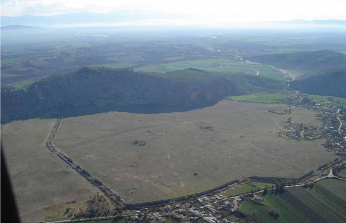
Şekil 2, Anavarza Kentinin Havadan Görünümü (Ünal-Girginer)