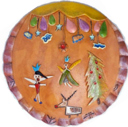
Şekil 16: Çalışma 9. Feyza Köse. 2016.