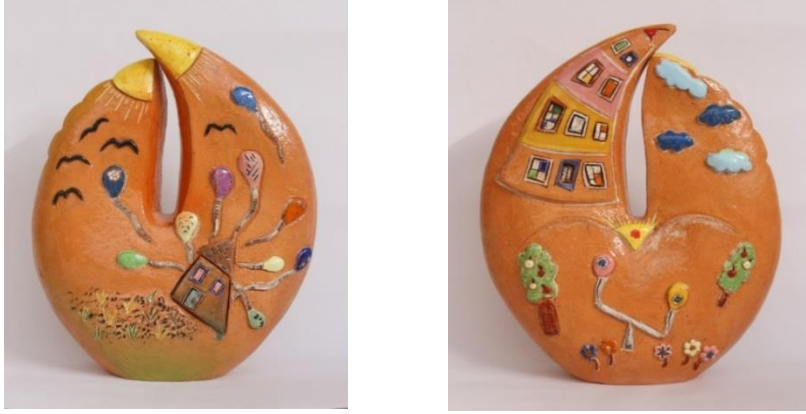
Şekil 8-9: Çalışmanın Ön ve Arka Görünümü. Feyza Köse. 2016.