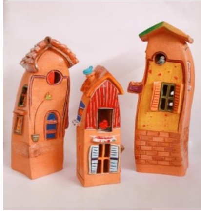
Şekil 7: Çalışma 3. Feyza Köse. 2016.

Çalışmanın Ölçüleri: 38x11 cm, 35x9,5 cm, 27x8 cm.