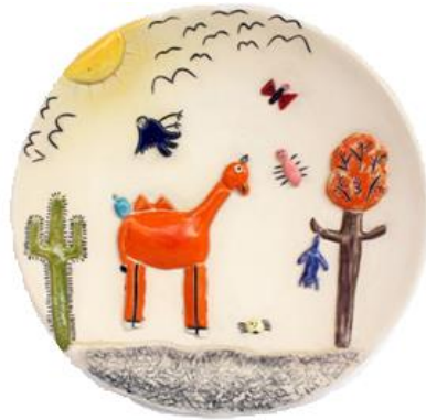
Şekil 15: Çalışma 8. Feyza Köse. 2016.