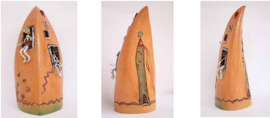
Şekil 4-5-6: Çalışmanın Ön ve Arka Görünümü. Feyza Köse. 2016.