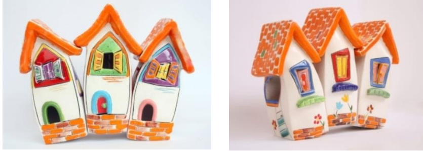
Şekil 17-18: Çalışmanın Ön ve Arka Görünümü. Feyza Köse. 2016.