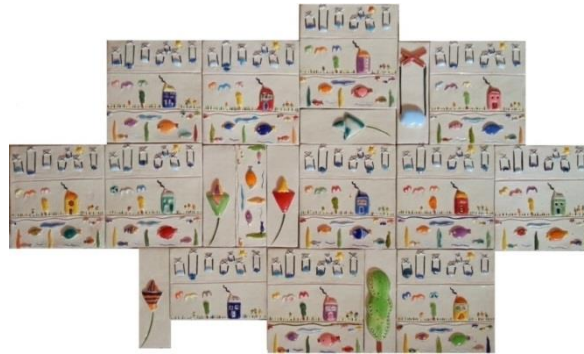
Şekil 19: Çalışma 11. Feyza Köse. 2016.