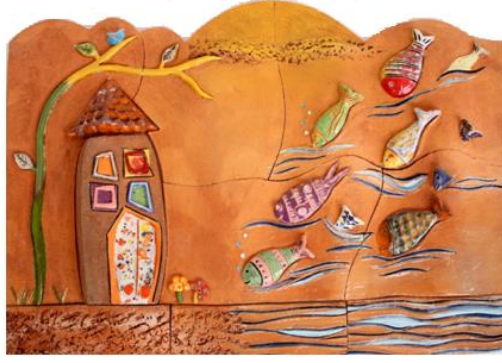
Şekil 14: Çalışma 7. Feyza Köse. 2016.