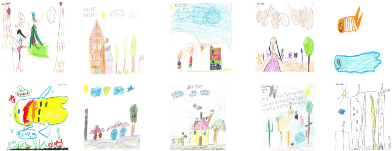
Şekil 1. Resim uygulamalarından örnekler

Çocuk resimleri, tıpkı çocuk gibi esnek, hareketli ve sürprizlidir. Seramik malzemelerin kullanımının, çocuk resimlerindeki esnekliği, hareketliliği en iyi yansıtabilecek alternatiflerden biri olabileceği fikrinden hareketle; seramik malzemenin zengin şekillendirme olanaklarından faydalanılarak, iki boyutlu çocuk resimlerinin üç boyutlu formlarda hangi teknik ve yöntemlerle, nasıl yorumlanabileceği, bu araştırmanın çıkış noktasını ve problemini oluşturmaktadır.