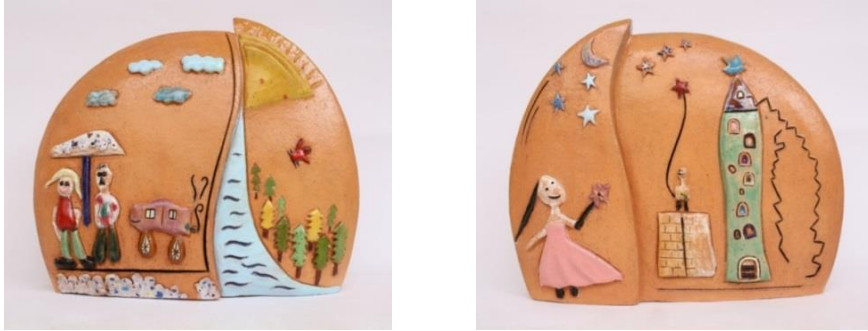
Şekil 12-13: Çalışmanın Ön ve Arka Görünümü. Feyza Köse. 2016.