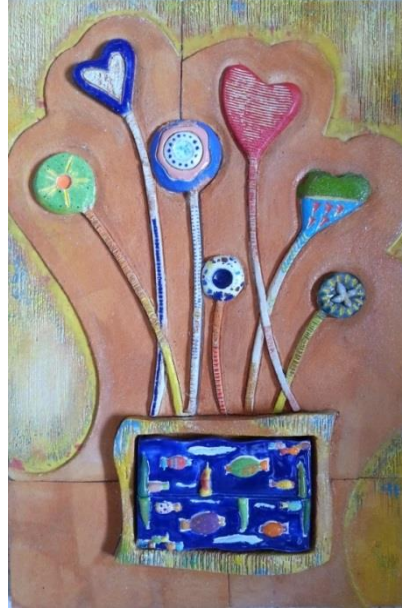
Şekil 21: Çalışma 13. Feyza Köse. 2016.