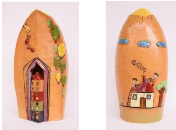
Şekil 10-11: Çalışmanın Ön ve Arka Görünümü. Feyza Köse. 2016.