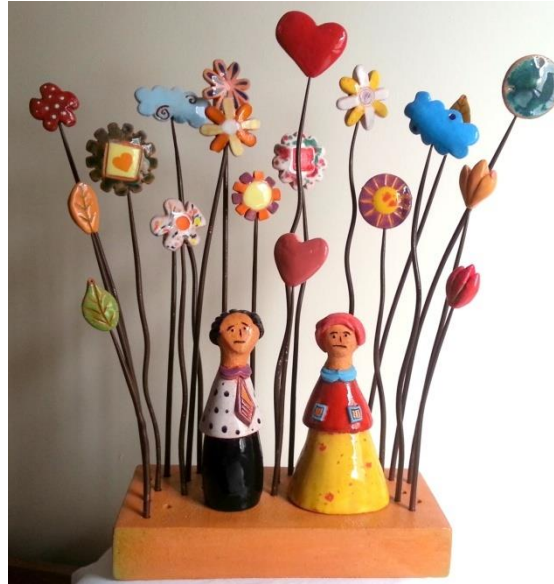
Şekil 20: Çalışma 12. Feyza Köse. 2016.