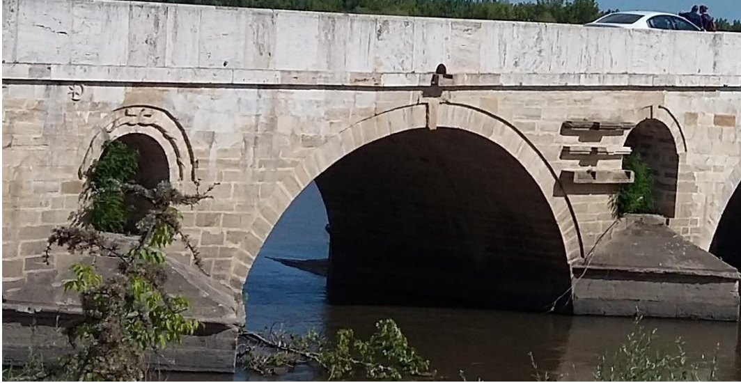
G.2-Memba cephesi, köprü ayaklarındaki figürlü taş süslemeler (2017)