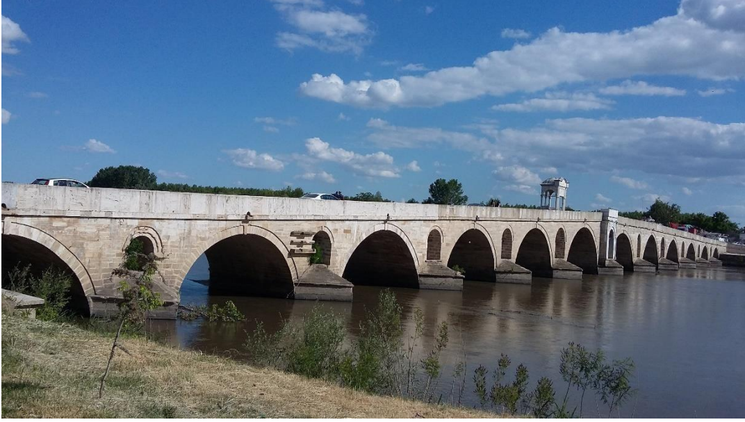
G.1-Edirne Meriç/Mecidiye Köprüsü, Edirne-Karaağaç yönü memba cephesi (2017)