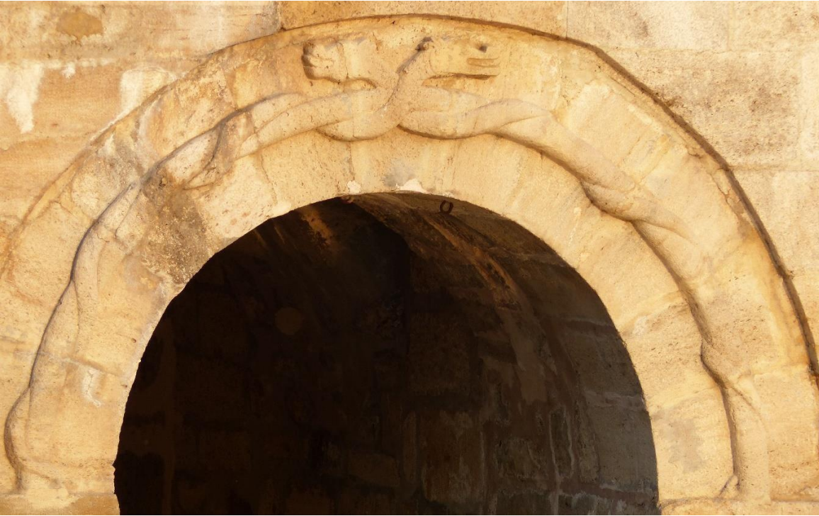
G.4-Birinci boşaltma gözü üzerinde yer alan çift ejder figürleri (2017)