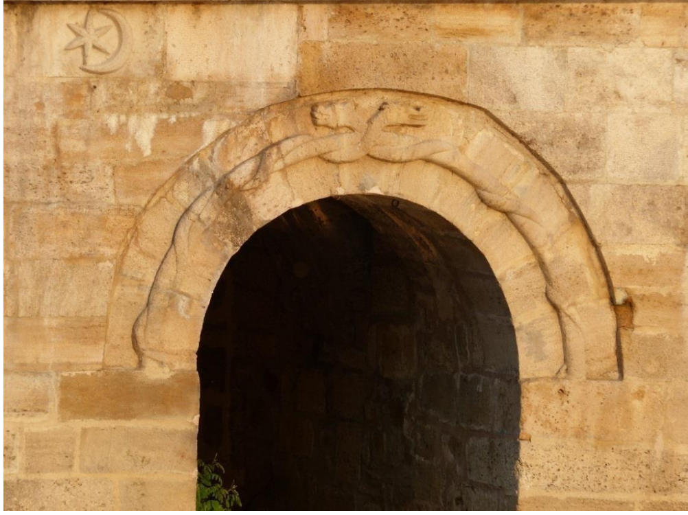
G.5-Birinci boşaltma gözü üzerindeki ay-yıldız (2017)