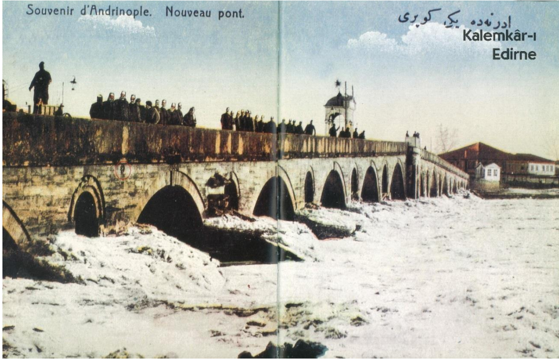
G.6-20. yy başı Edirne Kartpostalında Edirne Meriç/Mecidiye köprüsü ve birinci boşaltma gözünün solunda görülen ay-yıldız ( E.N.İşli-M.S.Koz, s.542-543)