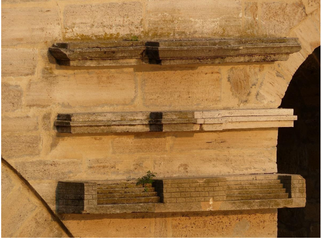
G.7-Köprünün üçüncü ayağı üzerindeki taş tünekler (2017)