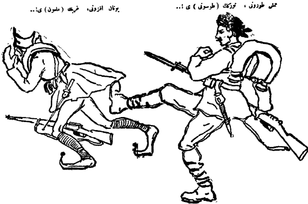
Görsel 4. Memiş Çavuş'un torunu Tosun'un Yunan askerini kovalaması. 38

Memiş Çavuş Rüyada adlı eserde yer alan ikinci görsel, rüya kurgusunun bir parçası olarak Memiş Çavuş'un torunu Tosun'un bir Yunan askerini kovalamasını resmeder. Görsel, rüya kurgusunun da sonuyla ilişkili biçimde Türk askerinin Yunan askeri karşısındaki zaferini temsil eder. Görselde Tosun, "Memiş torunu, Türk'ün (Tosun)u!..", Yunan askeri ise "Yunan efzunu, Garbın (mel'un)u!.." ifadeleriyle okura sunulur.