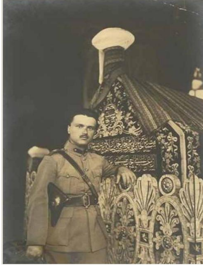
Görsel 2. Sofoklis Venizelos'un Osman Bey'in Türbesi'nde çekilmiş fotoğrafı. 35

Bursa'nın işgali nedeniyle Türkiye Büyük Millet Meclisi kürsüsünün siyah bir örtü (puşide-i siyah) ile kaplanması ve bu siyah örtünün Türk ordusunun 11 Eylül 1922'de Bursa'ya yeniden girişine kadar kalması; Bursa'nın işgalinin Türk milletinde ne kadar derin bir üzüntü ve büyük bir infial yarattığının göstergesidir. 34 Yaşananların Tunalı Hilmi Bey'i de derinden etkilediği açıktır.