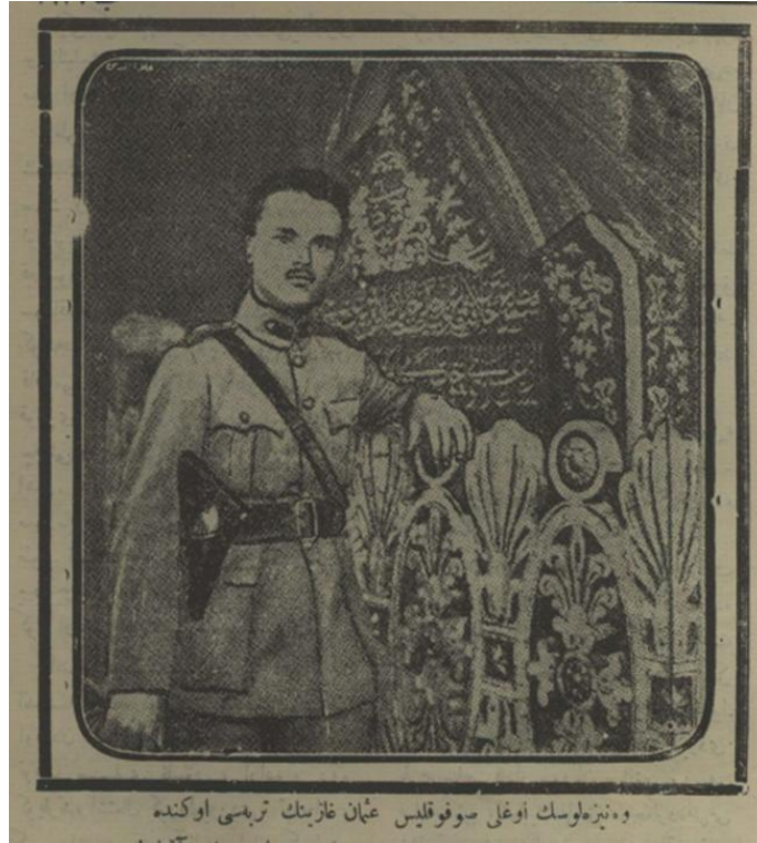
Görsel 3. Venizelos'un Oğlu Sofoklis Osman Bey'in Türbesi önünde ( Yeni Mecmua ). 37

Memiş Çavuş Rüyada adlı eserin kapağında yer alan resmin Millî Mücadele döneminde Yunan işgalinin ve Bursa'nın kurtuluşunun anlatıldığı "İşgal Altında Bursa" başlıklı yazıyla ilişkili olarak dönemin önemli süreli yayınlarından biri olan Yeni Mecmua 'da 36 da paylaşılması; Millî Mücadele döneminde tarihe not düşülmesi, millî bilincin geliştirilmesi, propaganda faaliyetleri, bağımsızlık yolunda halkın duygu, düşünce ve eylemlerinin yönlendirilip güçlendirilmesi ile bağımsızlık fikrinin yaygınlaştırılması ve kitlelerce benimsenmesi gibi hususlar açısından süreli yayınların ve edebî eserlerin işlevselliğine dair önemli ipuçları verir. 1 Mayıs 1339/1923 tarihli Yeni Mecmua 'da görsel, "Venizelos'un Oğlu Sofoklis Osman Gazi'nin Türbesi Önünde" notuyla verilmiştir.