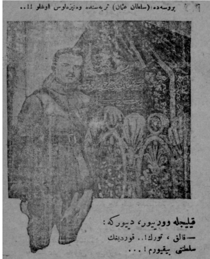
Görsel 1. Sofoklis Venizelos, Osman Bey'in Türbesi'nde ( Memiş Çavuş Rüyada ).

Millî Mücadele döneminde halkın mücadeleye ve kurtuluşa olan bağlılığının güçlendirilmesi, millî bilincin geliştirilmesi, savaşa destek sağlanması, savaşla ilgili bilgilerin halka ulaştırılması ve propaganda faaliyetleri açısından gazeteler, dergiler, kartpostallar, broşürler, edebî metinler büyük bir işlev görmüştür. Bu bağlamda Osman Gazi de Millî Mücadele döneminin öne çıka(rıla)n öznelerinden biri olmuştur. Dönemin süreli yayınlarında Osman Bey'in Türbesi'nin düşman işgali altında olduğu vurgulanırken toplumsal atmosfere egemen olan duygu ve düşünceler ve milletçe duyulan üzüntü ve utanç süreli yayınlarda ve edebî eserlerde dile getirilmiştir. Osmanlı Devleti'ne bir dönem başkentlik yapmış olan ve tarihsel açıdan simgesel bir anlam ifade eden Bursa'nın Yunanlarca işgali halkta büyük bir tepki yaratmış ve bu tepkiler çeşitli mecralarda ortaya konmuştur. İşgal sırasında Yunan komutanı Sofoklis Venizelos'un Osman Bey'in Türbesi'nde çekilmiş fotoğrafının basında yer alması, kamuoyunda büyük bir infial yaratmış ve bu fotoğraf karesi, Yunanların Osman Gazi Türbesi'ne yönelik saygısızlığının simgesi olmuştur. Bu saygısızlık, Bursa'nın işgaliyle halkta oluşan büyük üzüntü ve utancı derinleştirmiş; duyulan üzüntü ve utanç, işgale gösterilen tepkilerle iç içe biçimde dönemin gazete, dergi ve edebî eserlerinde dile getirilmiştir. 33