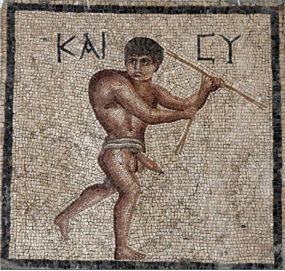
Resim 2 Şanlı Kambur Mozaïği, Kem Göz Evi, Antiocheia, Hatay Arkeoloji Müzesi (Cimok 2000: 35).