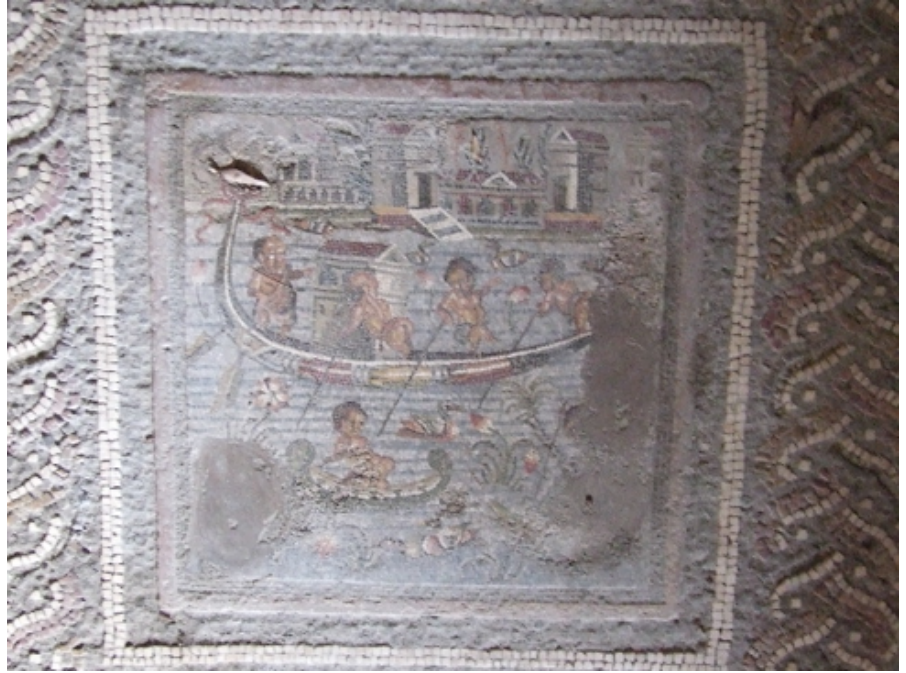
Resim 1 Pigme Mozaïği, Menander Evi - oecus , Pompeii.

Romalılar Akdeniz kıyılarında ele geçirdikleri toprakları yüzyıllar boyunca etkili şekilde kolonize etmişlerdir. Ötekinin, yani Romalı olmayanın tanımı sanatçılar tarafından oldukça farklı biçimde yorumlanmıştır. Bu nedenle “öteki” olarak kabul edilenler, görsel sanatlarda mutlaka “ideal Romalı tipinden farklı” gösterilmişlerdir. Bu amaçla ötekilerin proporsiyonları ve renkleri Romalı tipinden ayrıştırılmıştır (Clarke 2007: 88). Bu farklı görüntü ile Romalılar aynı zamanda kendilerini yüceltme fırsatı bulmuş olmaktadır. Bununla birlikte farklı renk ve görünüş diğer taraftan yeni bir mizahın doğmasına da neden olmuştur. Bilindiği gibi, Romalılar için siyahiler, pigmeler ya da vücut deformasyonları (lordoz, kifoz vb.) olan kişiler komiktirler (Levi 1947: 33 pl. IVa; Campbell 1988: 60-61 pl. 175) (Res. 2-3).