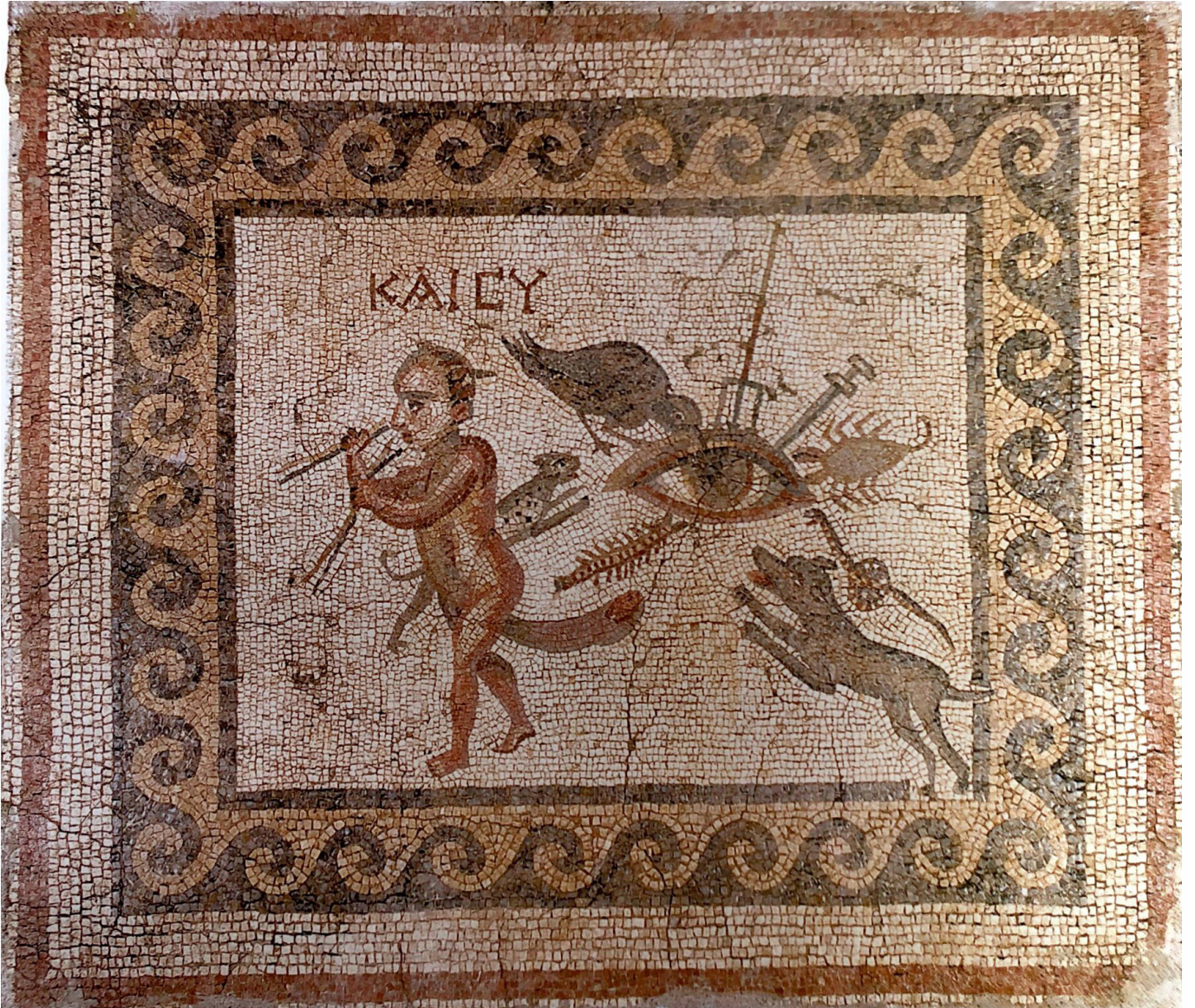
Resim 5 Kem Göz Mozaïği, Kem Göz Evi, Antiocheia, Hatay Arkeoloji Müzesi (Cimok 2000: 37).

İnsanları kötü ruhlardan ve olumsuzluklardan korumak için yapılan ve insanlarda olduğu gibi yapıları veya mekânları da kötü göz ve nazardan koruduğuna inanılan tılsımlı sembol ya da figürlerden oluşan betimlere “apotropeik” denmektedir. Bu tür betimlerin insanları veya mekânları kem/kötü gözlere karşı koruduğuna günümüzde bile inanılmaktadır. Bu konuya en güzel örneklerden biri, Roma dünyasının en doğusunda yer alan Antiocheia’da bulunarak Hatay Arkeoloji Müzesi’nde korumaya alınan “Kem Göz Mozaïği”dir (Levi 1947: 33-34 pl. IVc; Dunbabin 1978: 161-162). Söz konusu mozaik panel üzerinde irice yapılan bir göz bulunmaktadır; üst göz kapağının üzerinde kuzgun, trident, pala ve akrep, gözün altına ise göze doğru ilerlemekte olan leopar, çıyan, köpek ve yılan betimlenmiştir (Res. 5). Aynı panoda sola doğru çift flüt çalarak ilerleyen fallik bir pigme de bulunmaktadır. Bu betimin hemen üzerinde “sen de” anlamına gelen KAICY yazısı yer almaktadır. Kıskaçlık, nefret ve düşmanlık anlamına gelen INVIDUS ’a işaret eden bu kavram Ostia’da iki mozaik üzerinde daha karşımıza çıkmaktadır (Becatti 1961: 361, 191 pl. CXVII, CLXX). Apotropeik figürler koruyucu unsur olarak özellikle Kuzey Afrika mozaiklerinde sık tercih edilmişlerdir (Dunbabin 1978: 162).