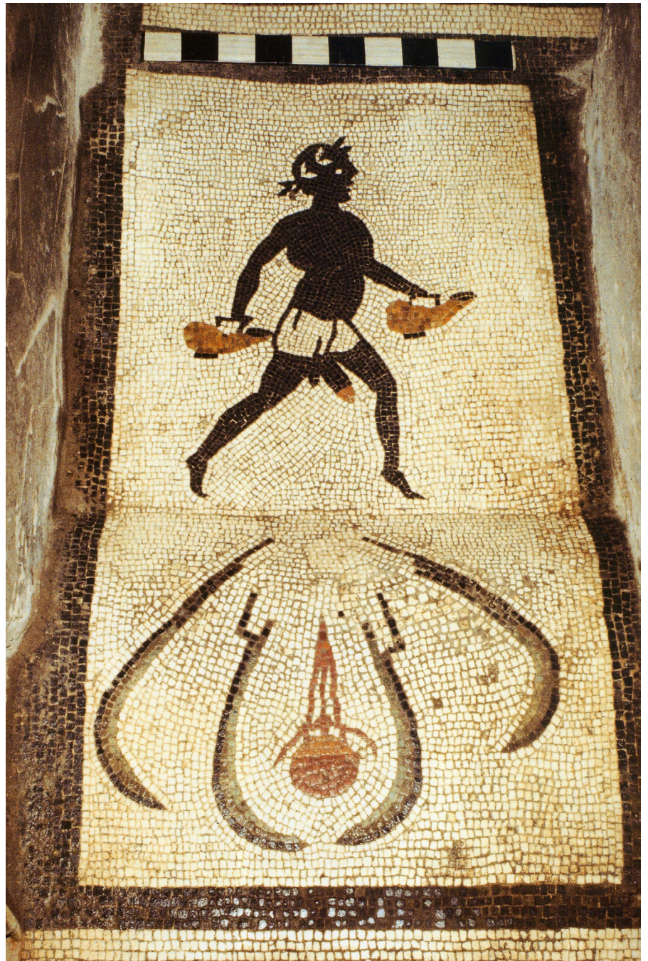
Resim 6 Afrikalı Banyo Hizmetkârı, Menander Evi, Pompeii (I,10,4) (Clarke 2007: pl. I).

Antik dünyada Priapus ve Hermaphrodite gibi tanrılar ve onların etrafında geçen uydurma cinsel içerikli sunumların yanı sıra insanlar arasında geçen cinsel konular da mizah repertuarı içerisinde yer almıştır. İnsanlar tarafından oldukça eğlenceli bulunduğunu düşündüğümüz bu tür kompozisyonlara, genellikle evlerde veya taşra hamamlarında rastlanmaktadır (Clarke 2007: 163-227). Konuşulana nasıl kulaklar duyarsa, gözler de mizahı fark etmiştir. Mizah,