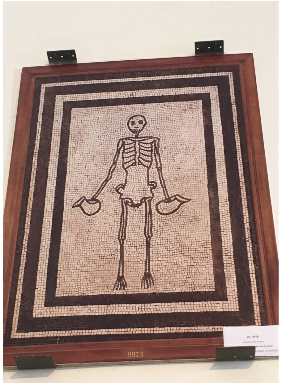
Resim 4 Şarap Sunan İskelet Mozağı, Vesta Rahibeleri Evi, Pompeii, Napoli Ulusal Arkeoloji Müzesi (Fotoğraf: Yazar).

Ölüm korkusunun zevki tetikleme ile ilgili olarak Hatay’da 2013 yılında bulunan taban mozağına de vurgu yapmakta fayda vardır (Pamir - Sezgin 2016: 251-280). Bir otel inşaatının temel kazısında tesadüfen ortaya çıkan yedi mekândan birisi triclinium ’a aittir. Odada kısmen tahrip olmuş yan yana üç panelden oluşan mozaik döşemenin ilk panosunda güneş saatinin önünde duran iki figür, diğer bir panoda Afrikalı bir figür ve sonuncu panoda ise bir yastığa dayanmış ve elinde içki kabı tutan iskelet betimi yer almaktadır. Kazıyı yapanlar tarafından İS 3.-4. yüzyıllara tarihlenen mozaiklerde, hem görseller, hem de yazıt ile ölüme vurgu yapılarak, mümkün olduğunca hayatın keyfinin çıkartılması tavsiye edilmektedir (Pamir - Sezgin 2016: 251, 266).