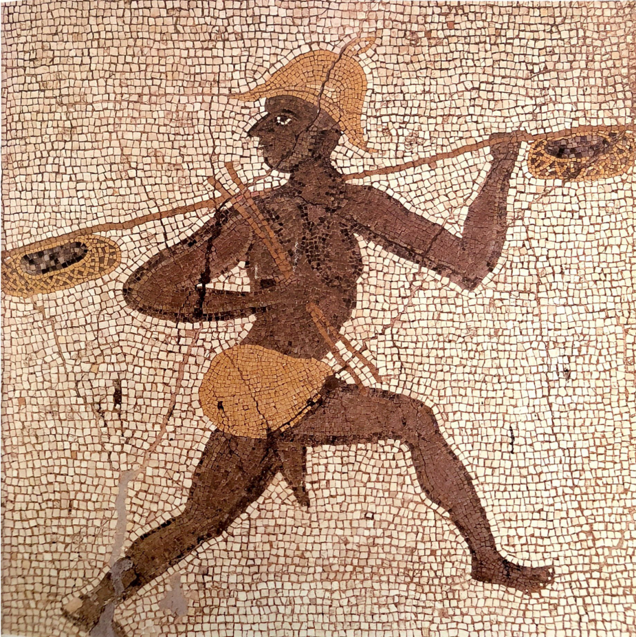
Resim 3 Siyahi Balıkçı Mozaïği, Takvim Evi, Antiocheia, Hatay Arkeoloji Müzesi (Cimok 2000: 44-45).