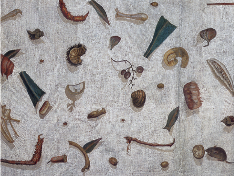
Resim 8 Heraklitos imzalı Asarotos Oikos Mozaïği, Roma Vatikan Müzesi, (Dunbabin 2003: 66 fig. 33).