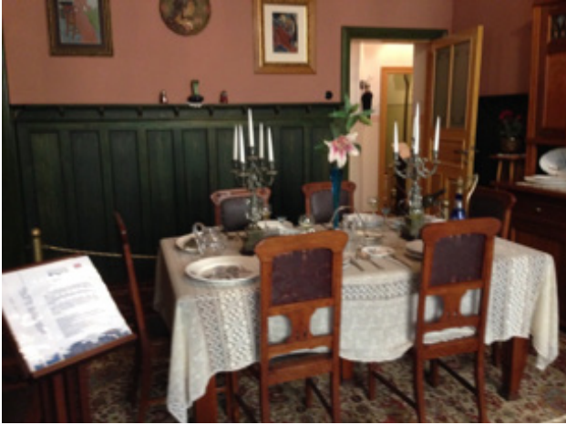
Resim 13. Yemek Odası (Oya Şenyurt, 2016).

Yemek odası, apartmanın içindeki en lüks oda olarak bilinir. Arkadaşlarla yenen akşam yemekleri ve her gün aile bireylerinin birlikte yedikleri yemekler için bu oda kullanılmıştır. İki görkemli boyama motifi ve vitray camlarla, apartmanda dekorasyonu farklı tek odadır. Dekoratif boyamalar, tavandaki ahşap paneller ve çam ağacından yapılan kirişler dikkat çekmektedir. Ailenin büyükleri çoğunlukla bu odayı geleneksel menüsüyle, ciddiyet gerektiren bir mekân olarak hatırlamaktadır. Odadaki objelerin tümü 20. yüzyıl başına aittir (Resim 13).