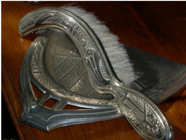
Resim 8. Pēkšēns'in dairesindeki konsolun üstünde sergilenen Art Nouveau gümüş fırça ve fırça altlığı olarak kullanılan tabak seti (Oya Şenyurt, 2016).

Müzedede aynı zamanda dönem kıyafetlerini giymiş hizmetçi ve ev sahipleri rollerini üstlenen tiyatro oyuncularının mekân kullanımlarını canlandırmaları, mekân-zaman deneyimlenmesinin ziyaretçilere aktarılması açısından, müze ziyaretini son derece keyifli hale getirir. İç içe geçen oda düzenine sahip daire planında, odalar kimi zaman kapılar, kimi zaman da perdelerle ayrıştırılmış ve geçişler sağlanmıştır. Dairenin giriş bölümünün tam karşısında salon yer alır, antrenin sağında yer alan kapı ise ofise açılır. Salondan sonra iç içe geçmiş oda dizileri sırasıyla, şömine odası, yemek odası, bugün sergi salonu olarak kullanılan bir oda (Pēkšēns'in çalışma odası) ve yatak odası olarak düzenlenmiştir. Yatak odası ile sergi salonu arasındaki alan ise kısa bir koridora açılır. Bu koridorda mutfak, hizmetçi odası, banyo ve küçük ofis bulunmaktadır. Söz konusu kısa koridorun sonunda yemek odasına ulaşılır. Ayrıca yemek odasından dairenin giriş bölümüne de çıkış vardır.