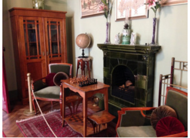
Resim 11. Şömine Odası (Oya Şenyurt, 2016).

çevreler. Parkeler, kapılar, pencereler ve radyatörler özgündür. Şömine odası, Riga mimarisindeki Art Nouveau döneminin özelliklerini yansıtır. Odadaki eşyalar ve objeler erken 20. yüzyıla aittir (Resim 11).