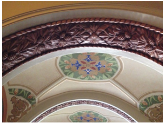
Resim 6. Art Nouveau Müzesi'ne dönüştürülen, Strēlnieku Caddesi ile Alberta Caddesi köşesinde yer alan, 12 numaralı apartmanın Art Nouveau tarzındaki tavan süslemeleri.

Bugün Riga'da Art Nouveau Müzesi olarak kullanılan apartman daha önce de ifade edildiği gibi, K. Pēkšēns'in mimar Eizēns Laube ile birlikte tasarladığı bir yapıdır. Letonyalı ressam J. Rozentāls, K. Pēkšēns ile işbirliği içinde apartmanın merdivenin altına, duvarlara ve tavanlara "Art Nouveau" üsluplu süslemeler yapmıştır (Resim 6). Ayrıca, Rozentāls'in eserlerine ilişkin sergi, Riga Art Nouveau Müzesi içinde yer alır. 1903 yılında inşa edilen yapıda K. Pēkšēns'in 1907 yılına kadar ikamet ettiği bilinmektedir.