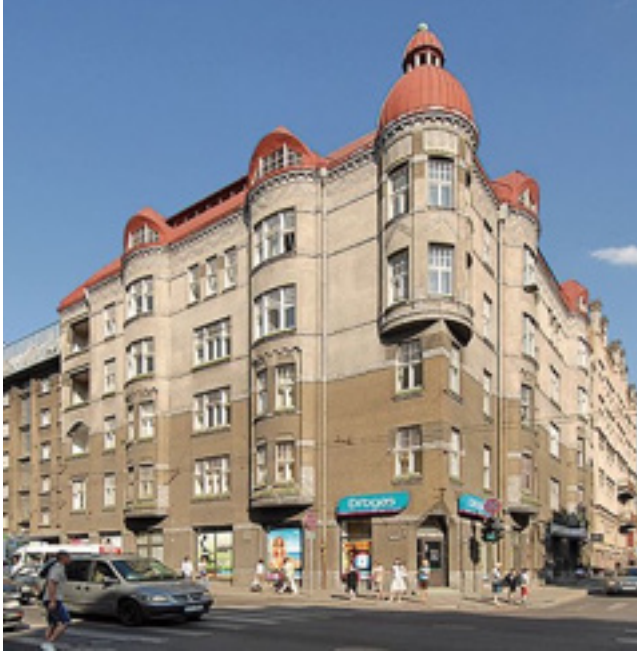
Resim 3. 1906 yılında inşa edilen ve Mimar Aleksandrs Vanags'ın tasarımı olan bir apartman

yapmaya kendini adanmıştır (Resim 3). Profesyonel hayatına K. Pēkšēns'in ofisinde başlamış ve 1905 yılında kendi ofisini kurmuştur (Antenišķe, t.y.: www.artnouveau-net.eu/).