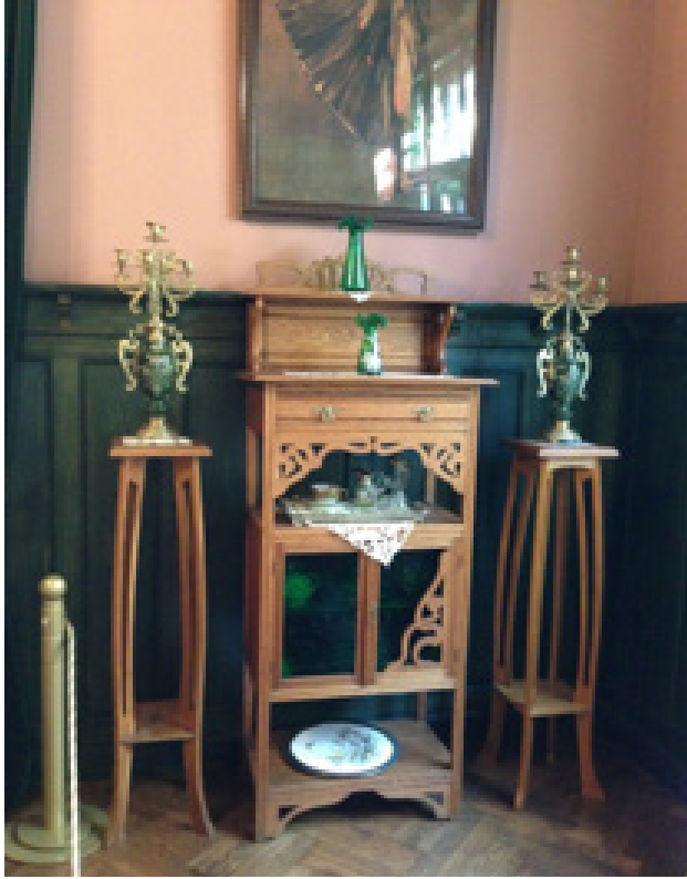
Resim 7. K. Pēkšēns'in dairesinden Art Nouveau mobilyalarla döşenmiş bir köşe (Oya Şenyurt, 2016).

Mimarın yaşadığı dairede, Riga halkının kullandığı eşyalardan toplu olarak sergilenenler dışında, büyük ölçüde daireye özgü mobilyalar ve dekorasyon da korunduğundan, bir Riga konutunun Art Nouveau iç mekân özelliklerine ilişkin bilgilere gerek mobilyalar gerekse gündelik ev eşyalarına bakarak fikir sahibi olmamız mümkündür (Resim 7-8).