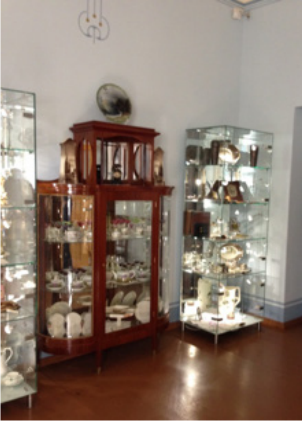
Resim 10. Sergi Salonu (Oya Şenyurt, 2016).

Müze de sergi salonu haline getirilen odanın ilk olarak daire sahiplerinin yatak odası ya da Mimar Konstantin Pēkšēns'in çalışma odası olarak kullanıldığı tahmin edilmektedir. Günümüzde ise "Art Nouveau" objelerin sergilendiği bir sergi holü olarak kullanılmaktadır. Odanın özgün duvar rengi açık mavidir. Tavandaki daha koyu parçalar ve geometrik süslemeler restorasyon görmüştür. Kapılar, pencere aparatları özgündür. Odadaki tüm objeler 20. yüzyıl başına aittir (Resim 10).