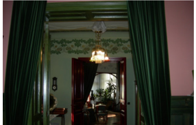
Resim 9. K. Pēkšēns'in dairesinde iç içe geçen odalar düzenine genel bakış.

Böylelikle daireye giren bir kişi, dairenin tüm odalarını tavaf ederek ve ziyaretini yeniden girişe ulaşılarak tamamlar. Bu durum, salondaki misafirlere görünmeden içeri girmek isteyen birinin, girişten yemek odasına ve oradan yatak odasına ulaşmasını da sağlar. Dolayısıyla kısa koridor, odaları birbirine bağlayan bir mekân olmaktan öte hizmet alanına dönüşür. Burada iç içe geçen odaların (Resim 9) işlevleri ve içindeki "Art Nouveau" süslemeleri, mobilyalarını ve objeleri incelemek dönemin özelliklerini yansıtmaları sebebiyle önemlidir.