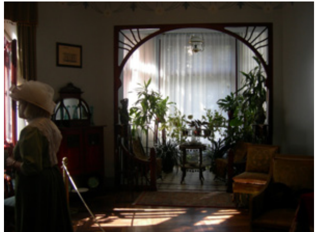
Resim 12. Salon (Oya Şenyurt, 2016).

Salon, dairenin merkezi mekânıdır. Dairenin sahipleri misafirlerini burada kabul etmiştir. Bu salonda çay içilmiş, politika ve operalar, Paris'teki son modalar ve Riga'daki son haberler konuşulmuştur. Misafirler müzik dinlemiş, şarkı söylemiş ve dans etmiştir. Oda, 1903 yılındaki haline dönüştürülmek üzere restorasyon geçirmiş ve duvarlar yeniden maviye boyanmıştır. Duvarların üstünde papatya motifleriyle süslü bir bant vardır. Tavan alçı dekordur. Odadaki ilginç elemanlardan biri cumbadır. Art Nouveau bir ahşap dekorla yaşama mekânından ayrılır. Döşemeler, çiniler, kapılar, pencereler ve radyatör özgündür. 2008 yılında restorasyona uğrayan odadaki objeler, 20. yüzyıl başına aittir (Resim 12).