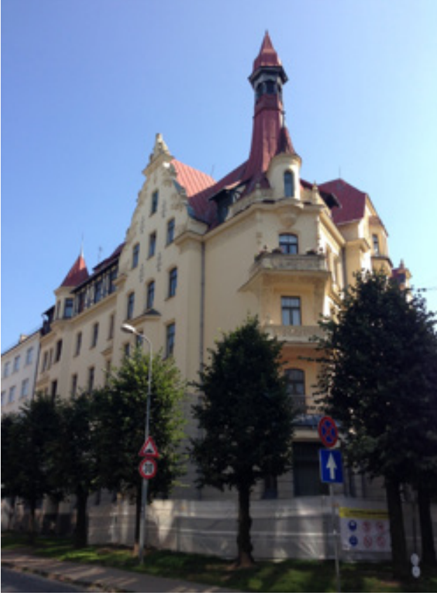
Resim 1. Konstantin Pekšens ve Eižens Laube tarafından tasarlanan Strēlnieku Caddesi ile Alberta Caddesi köşesinde yer alan 12 numaralı apartman, sonradan Art Nouveau Müzesi'ne dönüştürülmüştür (Oya Şenyurt, 2016).

Eižens Laube (1880-1967), 1906 yılında Politeknik Enstitüsü'nün mimarlık bölümünü bitirmiştir. 1907 yılında doçent unvanını almıştır. 1919 yılında Letonya Üniversitesi Mimarlık Fakültesi'nin kuruluşuna katılımcı olarak davet edilen E. Laube, 1920 yılında profesör olarak mimarlık fakültesine atanmıştır. 1919-1922 ve 1932-1934 yılları arasında fakültede dekan olarak görev yaptığı anlaşılmaktadır. Mimarın, Birinci Dünya Savaşı'na kadar olan projeleri içinde 80 tane bina inşa edilmiştir. "Milli Romantizm" ve "Art Nouveau" tarzında inşa edilen bu yapıların çoğu kira evi ve kamu yapısıdır. Eižens Laube ayrıca 1920-1930'larda çok sayıda renovasyon işinde görev almıştır (e.t: 2017, http://www.rlb.lv/rls-house ).