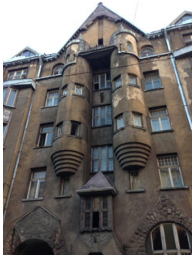
Resim 2. Mimar E. Laube olan, 1908 yılında "Milli Romantik" tarzda inşa edilen Alberta Sokağı No: 11'deki apartman (Oya Şenyurt, 2016).

ni düşündürdüğünü" belirtir. Söz konusu olan bu yapıda olduğu gibi, Art Nouveau'nun bir alt akımı olarak gelişen "Milli Romantik" üslupta kullanılan açık gri renk yapıların aldığı yaşı ya da yaşlanmayı vurgular. Ayrıca yapıdaki dairesel çıkıntılar ve bu çıkıntının tepelerindeki külâhlar, eski bir kaleyi hatırlatır. Cephe kaplaması için kullanılan doğal malzemeler (kayrak taşı, doğal taş ve baki), yeni mimari tarzın dürüstlüğüne ilişkin ilkeye katkıda bulunur. Cephe dekorasyonunda kullanılan süslemeler, Letonya ve İskandinav süsleme öğelerindeki folklorik motifleri (özellikle Riga'da salyangoz kabuğu motifini taşıyan cephe süslemelerine rastlanmıştır) özgürce yorumlar (Anteniške, t.y.: www.artnouveau-net.eu/ ).