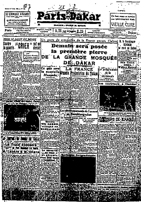
Senegal'in başkenti Dakar'da Fransa'nın 1938'de inşa ettireceği merkez caminin temel atma törenini haber veren Paris-Dakar Gazetesi 19 Şubat 1938.