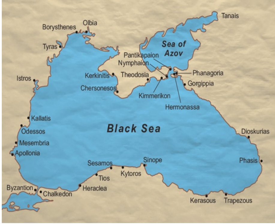
Görsel 1: Karadeniz'deki Antik Yunan Kolonileri