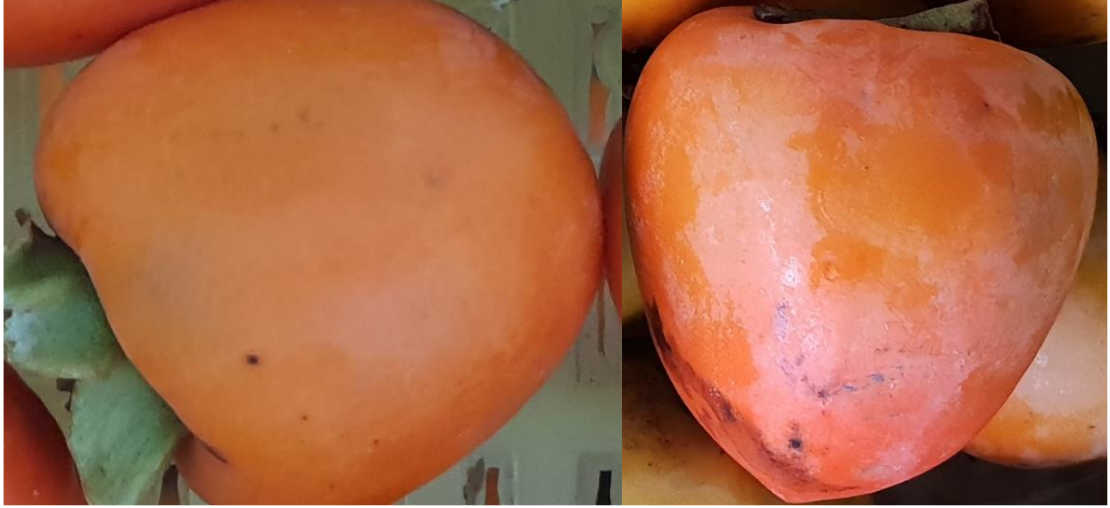
Şekil 1. Trabzon hurması meyveleri (sağda: Hachiya' Trabzon hurması çeşidi ve solda: 'Eylül' Trabzon hurması genotipi).

küçük meyveli, meyve kabuk rengi kırmızı, yuvarlak şekilli, meyve et rengi kararlı ve buruk yerel bir genotiptir (Toplu vd., 2009; Özdemir vd., 2021). Meyve kabuk rengi ve eti sertliği ile TÇGS dikkate alınarak, Crisosto vd. (1995) ve Özdemir vd. (2021)'ne göre makas yardımıyla kapsüllü olarak derilen 'Eylül' ve 'Hachiya' Trabzon hurması meyvelerinden yarasız, beresiz, standart irilik ve görünüşe sahip meyveler seçilerek, kontrol ve MAP ambalajlarında 0 °C'de %85–90 oransal nemde 4 ay süreyle depolanmıştır. Meyveler her analiz dönemi raf ömrü için 20 °C'de %70–75 oransal nemde 7 gün bekletilmiştir. Kontrol meyveleri bahçeden geldiği gibi hiçbir uygulama yapılmadan plastik kasalara yerleştirilip depolanırken, MAP ambalajı Trabzon hurması meyveleri için geliştirilmiş 5 kg'lık Life Pack® marka MAP ambalaj olup, Aypek Otomotiv San. Tic. ve Paz. Ltd. Şti. (Bursa) tarafından sağlanmıştır.