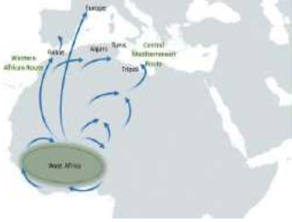
Şekil 5: Batı Afrika Bölgesel ve Uluslararası Göçmen Kaçakçılığı Rotaları