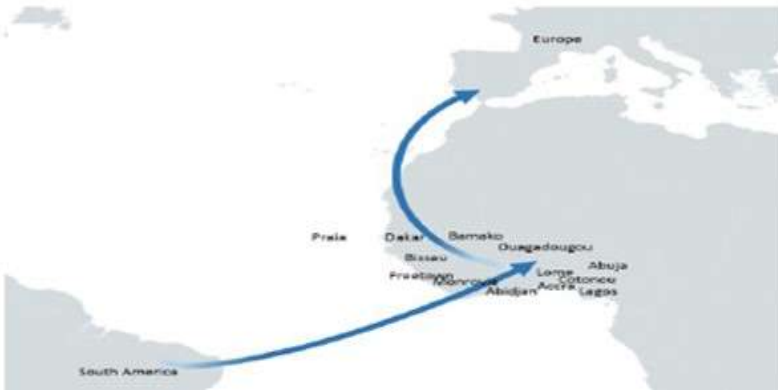
Şekil 2: Batı Afrika Kokain Deniz Yolu Haritası