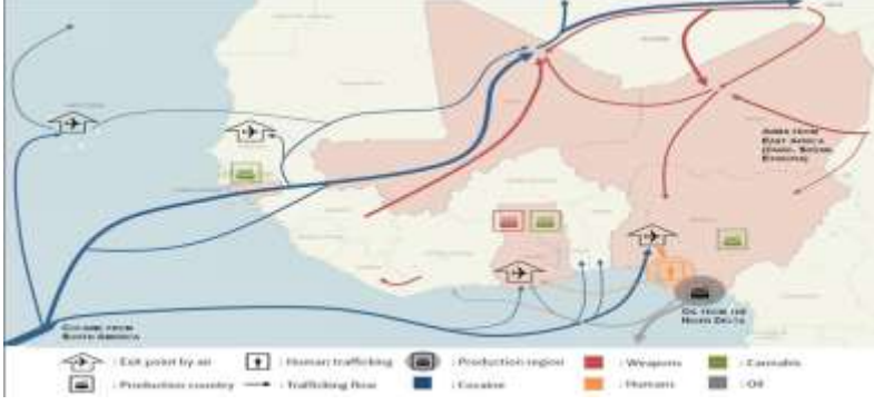
Şekil 4: Batı Afrika ve Kaçakçılık Akış Rotaları

kapasitesinin zayıflığı, bölgede var olan yoksulluk, gelir adaletsizliği ve bölgesel kalkınma farkları, yolsuzluk ve devlet otoritesinin zayıflığıdır.