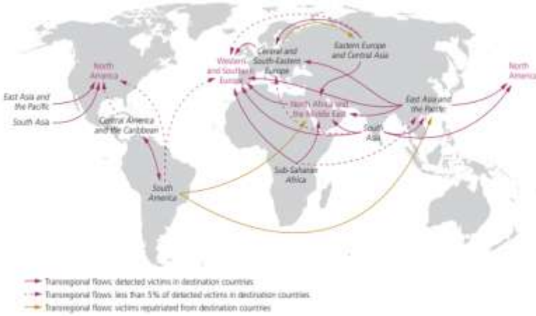
Şekil 6: Genel Göçmen Akış Rotaları