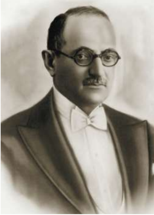
1935-1946 dneminde TBMM Bařkanlıęı yapan Abdlhalik Renda.