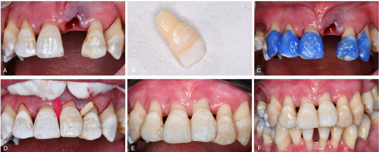
Resim 3. A. Ekstraksiyon sonrası görünüm, B. Çekilen dişte kök uyumlaması, C. Asitleme aşaması, D. Kama yerleştirme aşaması, E. Splintleme sonrası görünüm, F. Splintleme sonrası 2. ay görünüm