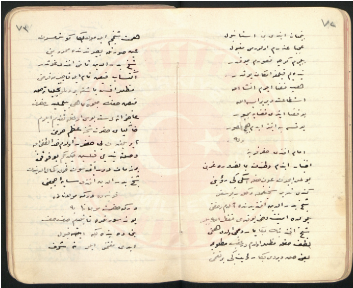
Kemâleddin Efendi'nin göz tedâvisi için İstanbul'dayken İmâm Efendi'ye yazdığı tahassürnâme. (Ömer Naîmî'nin defterinden.)

(Şark İstiklâl Mahkemesi Arşivi, belge nr. IM_T12_K067_D610-2_G046_0005)