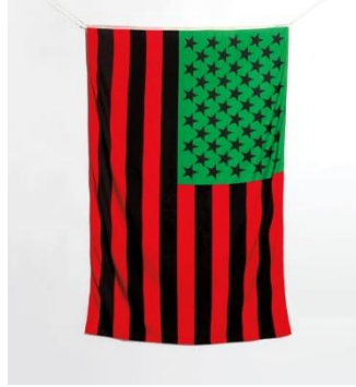
Şekil 8. David Hammons, African American Flag , 1990, Museum of Modern Art MoMA, New York

Hammons'ın, African American Flag (Şekil 8) adlı eseri, onun ırksal kimlik ve sembolizmle olan ilişkisini daha da örneklemektedir. Hammons, geleneksel Amerikan bayrağını Pan-Afrikan bayrağının renklerini içerecek şekilde değiştirerek izleyicileri Afrikalı Amerikalılar için vatanseverlik ve ulusal kimlik anlamını yeniden gözden geçirmeyi düşündürmektedir.