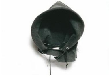
řekil 1. David Hammons, In the Hood , 1993, Tilton Gallery, New York

yerleřtirerek olmayan bir kafa için bir alan yaratmasıdır (Gopnik, 2016). Hammons'ın derin mesajları iletmek için gündelik nesnelere kullanması, Marsden'n makalesinde tartıřtıđı gibi, sanatın diyalog ve aktivizm için bir araç haline geldiđi düşünceğini desteklemektedir (Marsden, 2022: 209-226).