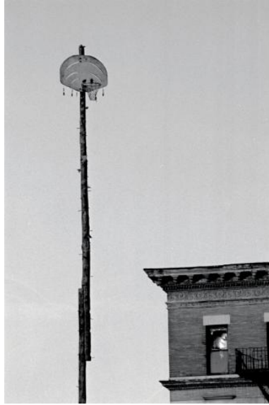
Şekil 5. David Hammons, Higher Goals, 1983, 16,8 m basketbol direği yüksekliği, 1'st Street ve Frederick Douglass Bulvarı, New York, Kaynak: Filipovic, 2017: 109.

Hammons'ın 1974 tarihli Spade with Chains (Şekil 6) adlı eseri, ırkçılık ve kölelik tarihine yönelik güçlü bir eleştiriyi yansıtmaktadır. Eserde, zincirlerle bağlanmış bir kürek kullanılmaktadır. Kürek; tarım aracı, inşaat işleri, tren yollarında kullanılmakla beraber Amerikalı siyahiler için aşağılayıcı bir stereotip olarak çift anlamlı bir işlev görmektedir. Çünkü ABD'de siyahi bireyler uzun yıllar boyunca beyaz Amerikalılar tarafından kırsal kesimde köle olarak tarım işlerinde çalıştırılmıştır (Bey, 1994: 46-47). Hammons, bu objeyi kullanarak ırkçı tarih ve sömürgecilik pratiklerine dikkat çekmekte; siyahi deneyimin tarihsel acılarını görünür kılmaktadır. Böylece eser, siyahi kültürün toplumsal hafızasında yer eden baskı ve direniş temalarını etkili biçimde temsil etmektedir.