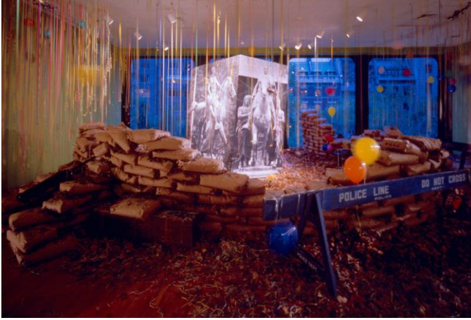
Şekil 7. David Hammons, Public Enemy, 19 Ekim 1991-7 Ocak 1992, Museum of Modern Art MoMA, New York