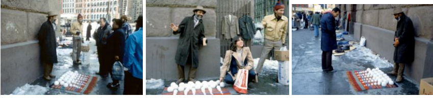
Şekil 2. David Hammons, Bliz-aard Ball Sale, 1983, Cooper Square, New York