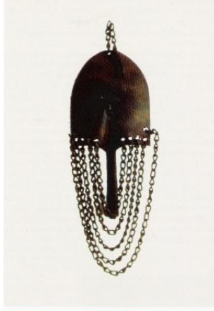
Şekil 6. David Hammons, Spade With Chains , 1973, Los Angeles, Slauson Avenue Studio, Los Angeles, Kaynak: Wattis.org, 2025.

Hammons'ın önemli çalışmalarından biri olan Public Enemy (Şekil 7) adlı enstalasyonu, Amerikan bayrağını yeniden yorumlayarak ulusal kimlik, özgürlük ve eşitlik gibi kavramları sorgulamaktadır. Eserde bayrak, geleneksel yüceltici anlamından uzaklaştırılarak, yapısal ırkçılığa işaret eden bir sembole dönüştürülmektedir. Bu müdahale, Amerikan kimliğinin evrensel değerler üzerine değil, tarihsel adaletsizlikler ve dışlayıcı söylemler üzerine kurulu olduğu eleştirisini gündeme getirmektedir. Hammons, Public Enemy ile izleyiciyi ulusal kimliklerin nasıl inşa edildiğini ve bu inşaların arkasında hangi ayrımcı politikaların yer aldığını sorgulamaya yönlendirmektedir (Aranke, 2021: 40). Bu eser, sanatın toplumsal eleştiri ve siyahi kültürel temsil aracı olarak nasıl işlev görebileceğini açık biçimde ortaya koymaktadır.