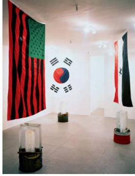
Şekil 9. David Hammons, Whose Ice Is Colder , 1990, Tilton Gallery, New York ( Kaynak: Filipovic, 2017: 109).

Colder (Şekil 9) başlıklı bu enstalasyon, üç farklı topluluğun New York'taki mahalle bakkalları ve marketlerin sahipliği üzerine yaşadığı rekabeti hicveden bir parodi niteliği taşımaktadır (Moma.org, 1990).