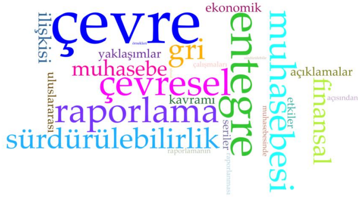
Şekil 1. Sosyal ve Çevresel Muhasebe Derslerinde Öne Çıkan Temalar

Derslerin haftalık içerikleri incelendiğinde belirli kavramların öne çıktığı tespit edilmiştir. Bu kavramlar kelime bulutu şeklinde görselleştirilmiştir. Kelime bulutunun oluşturulmasında Voyant Tools aracı kullanılmıştır.