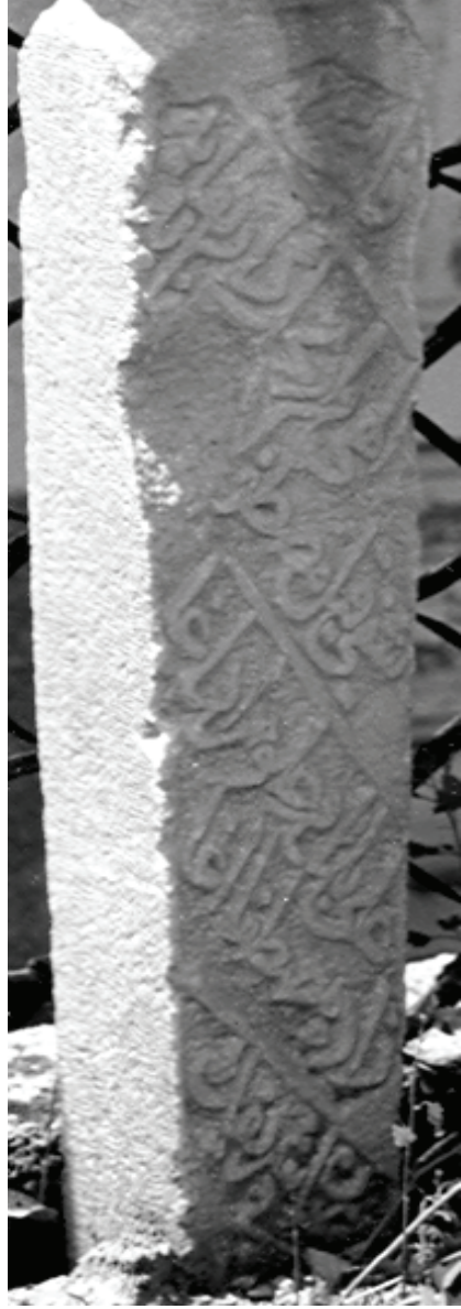
Fotoğraf : 11, 12 - Köprülü, Fazıl Ahmet Paşa Camii Haziresi, Ş.5