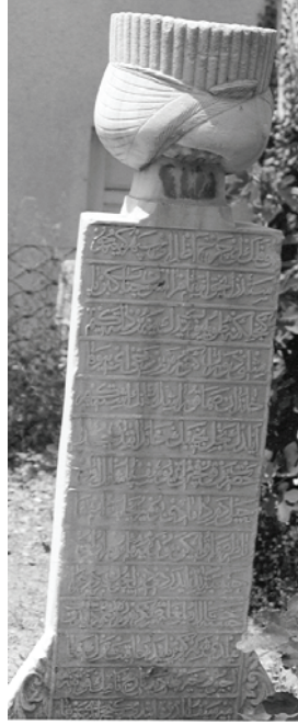
Fotoğraf : 8, 9 - Köprülü, Fazıl Ahmet Paşa Camii Haziresi, Ş.4, Başucu Şahidesi