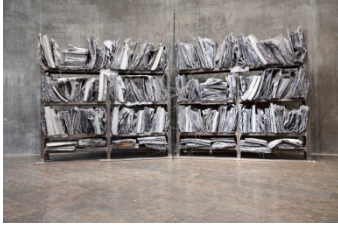
Şekil 3. Anselm Kiefer, The High Priestess: Zweistromland , (1985-1989).

Courtesy Astrup Fearnly Museet ( https://www.a-n.co.uk/blogs/mind-mapping-my-influences/ ).