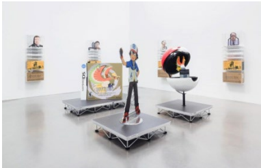
Şekil 10. Simon Denny Blockchain Future States Installation view 2 2016 .

https://www.petzel.com/exhibitions/simon-denny3#inquire