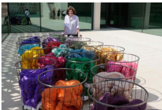
Şekil 4. Gülsün Karamustafa “Mistik Nakliye” 1992.

https://turkiyepavyonu24.iksv.org/sanatici