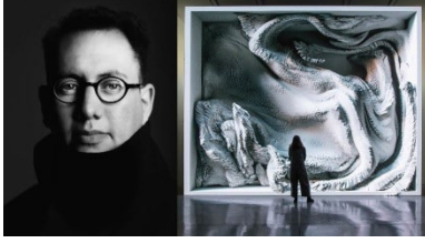
Şekil 9. Refik Anadol; Right: Melting Memories, Istanbul, Turkey, 2018, Neuroscape Laboratory at the University of California, San Francisco.

https://www.stirworld.com/think-columns-refik-anadol-tests-new-possibilities-for-experiencing-digital-space#gallery-1