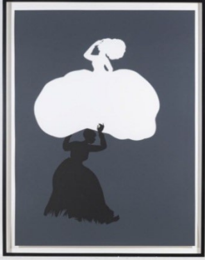
Şekil 13. Kara Walker, The Emancipation Approximation (scene 18) , 1999-2000 Silkscreen on paper.

https://www.studiomuseum.org/artists/kara-walker