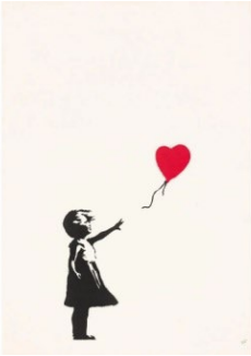
Tablo 5. Banksy - Girl with Balloon - Screen Print on Paper – Unsigned.

https://www.deodato.art/en/banksy-girl-with-balloon.html