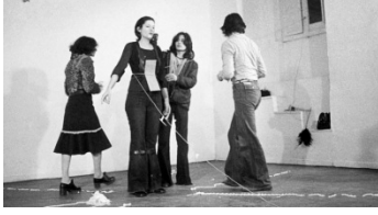
Şekil 2. Marina Abramović Rhythm 0 (1974).

https://www.themaggar.com/marina-abramovic-performans-sanati/