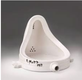
Şekil 1. Duchamp, Fountain , 1917.

Çağdaş sanat, Danto ve Bourriaud'nun kuramlarını hem doğrular hem de zorlar. 21. yüzyıl sanatçıları, bu kuramsal zemini daha da genişletmekte ve derinleştirmektedir. Çağdaş sanat, ontolojik olarak sanat eserinin doğasını ve varlık biçimini yeniden tanımlar. 20. yüzyılın modernist dönemi, sanatın nesnesini ve biçimini sorgulamaya başlamıştı; çağdaş sanat ise bu sorgulamayı dijitalleşme, interaktif ve deneyim odaklı üretimlerle yeni bir boyuta taşımıştır. 20.yüzyılın başı, sanatta bir dizi radikal avangart hareketin ortaya çıktığı bir dönemdir. Ancak hiçbiri, Marcel Duchamp'ın "hazır-yapım"ları (readymade) kadar felsefi bir etki yaratmamıştır.