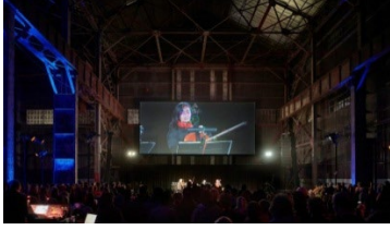
Şekil 11. Trevor Paglen Sight Machine, 2017 Installation view Pier 70, San Francisco.