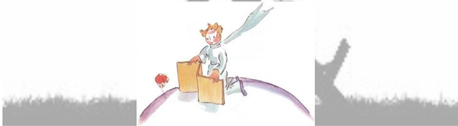
Şekil 3. Küçük Prens Kendi Küçük Gezegeninde Diz Çökmüş Halde Kitapta Küçük Prens ile çiçek arasında aşağıdaki diyalog gerçekleşmektedir.

“Sevdiğiniz çiçek milyonlarca yıldızdan yalnız birinde bile bulunsa yıldızlara bakmak mutluluğumuz için yeterlidir. ‘Çiçeğim işte şunlardan birinde,’ deriz kendi kendimize. Ama bir de koyunun çiçeği yediğini düşün, bütün yıldızlar bir anda kararmış gibi gelir” (Saint-Exupéry, 2016, s. 45). Kitaptaki bu ifadeye bakılarak çocuğun Erikson’un güvene karşı güvensizlik evresi olan birinci evreyi sağlıklı biçimde atlattığı söylenebilir. Çocuk iyimserlik ve mutlu olmanın temeli atılan bu evrenin özelliklerini göstermektedir.