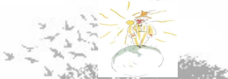
Şekil 4. Gezegenin Üzerinde Tahtında Oturan Kral

“Zaten ben hiçbir şeyin gerçeğine varamadım şimdiye kadar. Yargılarımı sözlere değil, davranışlara göre ayarlamalıydım” (Saint-Exupéry, 2016, s.52). Bu Kohlberg’in ahlak gelişim kuramının altıncı evresi olan evrensel ahlak ilkelerinde yer alan “ahlak ilkelerini seçip kendileri oluştururlar” savını destekler niteliktedir.