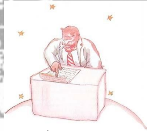
Şekil 7. İş Adamı Karakteri

Küçük Prens’in karşılaştığı sarhoş karakter, toplum tarafından kabul görmeyen bir davranış sergilemekte ve bu nedenle sosyal uyumsuzluk yaşamaktadır. Bu durum, bireyin ahlaki normlara uyumunun önemini vurgulamakta ve Kohlberg’in ahlaki gelişim kuramı açısından değerlendirildiğinde, toplumun beklentilerine uygun davranma gerekliliğiyle ilişkilendirilebilir. Karakterin içki içtiği için utanması ise, bireyin davranışlarını içsel bir değerlendirmeye tabi tuttuğunu göstermektedir. Bu yönüyle, yaşanan duygu durumu Erikson’un psikososyal gelişim kuramı bağlamında “özerkliğe karşı kuşku ve utanç” evresiyle örtüşmektedir çünkü bu evrede birey, kendi davranışlarını sorgulamaya ve toplumsal tepkilere göre değerlendirmeye başlar. Dolayısıyla sahne hem bireyin toplumsal normlara uygun davranma sürecini hem de kişinin içsel benlik değerlendirmesini yansıtan çok boyutlu bir gelişimsel durumu ortaya koymaktadır.