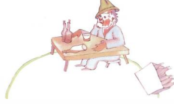
Şekil 6. Dördüncü Gezegendeki İçkici Karakteri

“Küçük Prens ellerini çırpı. Bunun üstüne, kendini beğenmiş, alçakgönüllü bir tavırla şapkasını çıkararak selam verdi” (Saint-Exupéry, 2016, s.57). Alçakgönüllülük kişilikle alakalı bir özelliktir.