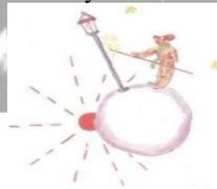
Şekil 8. Fenerci Karakterinin Gezegeni

“Tabii. Sahipsiz bir elmas bulursan senin olur. Sahipsiz bir ada da. Bir düşünce ilk senin aklına gelse beratını alırsın, senin olur. Benimki de öyle: Benden önce kimse yıldızlara sahip olmayı akıl edemediğine göre, yıldızlar benimdir” (Saint-Exupéry, 2016, s.90). Bu ifade Kohlberg’in ahlak gelişim kuramı aşama iki olan araçsal ilişkiler eğilimine örnek olarak gösterilebilir. Bu aşamada bireyin kendi istekleri söz konusudur. Burada Kral yıldızlara sahip olmayı ilk önce kendi düşündüğü ve onlara sahip olmak istediği için bu şekilde bir söylemde bulunmuştur.