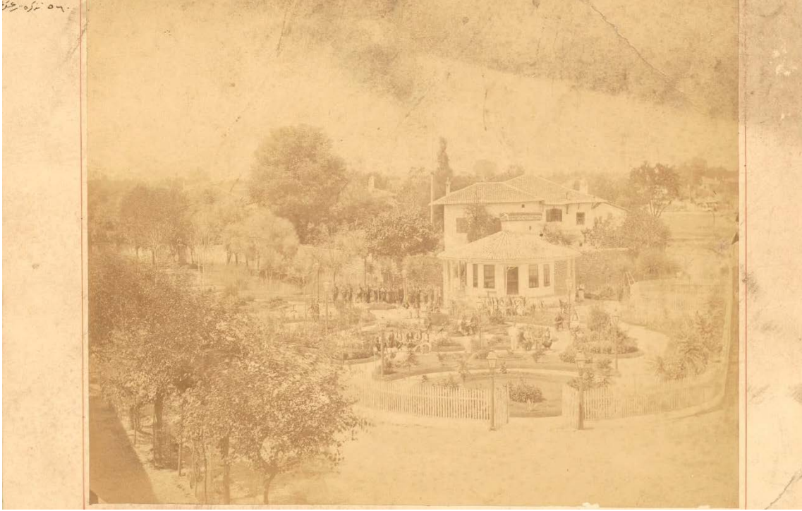
Fot. 5: Arkasında “İşkodra Bahçesi” olarak not düşülmüş bir Başbakanlık Osmanlı Arşivi fotoğrafında bahçenin düzenlenişi ve halk görüntülenmiştir. Fotoğrafın sol üst köşesinde “560 Tezkire-i Seraskeri” yazmaktadır (BOA., FTG., Gömlek no: 1774).

Çoğu “Millet Bahçesi”nin ortaya çıkışı Sultanahmet 9 ve Tepebaşı Millet bahçeleri gibi çöplük alanların dönüşümü ile gerçekleşmiştir. Kimi zaman eski mezarlıkların dönüştürülmesi de gündeme gelmiş ve bu sebeple sık sık girişimlerde bulunulmuştur. Söz gelimi, Beşiktaş’taki “Millet Bahçesi” bitişiğinde yer alan Ermeni Mezarlığı’nın bahçe haline getirilmesi için hükümet tarafından yapılan isteğe Ermeni Patrikhanesi karşı çıkmıştır. Levand Herald Gazetesi muharririnin imzaladığı 16 Kânunuevvel 1303/28 Aralık 1887 tarihli bir arşiv belgesinde; Ermeni Mezarlıkları’nın bina inşa edilecek bir arsaya ya da bahçeye dönüştürülmesinin yeni bir şey olmadığı ve emsallerinin olduğu belirtilmiştir. Ortaköy’de Taşmerdiven adlı mahalde bir Ermeni Mezarlığı bulunmaktayken bunun bir kısmının Kostan Paşa’nın nüfuz sahibi olduğu bir dönemde paşanın evinin arsası için gerek Ortaköy Kilisesi ve gerekse Patrikhanenin rızasıyla bırakıldığı belirtilmiştir. Civardaki Rum Mezarlığı da parça parça satılmıştır. Bu sebeple gazete yazarı Ermeni Patrikhanesi’nin karşı çıkışlarını anlamlı bulmadığını ifade eder (BOA., Y.PRK.AZJ., Dosya no: 12, Gömlek no: 69).