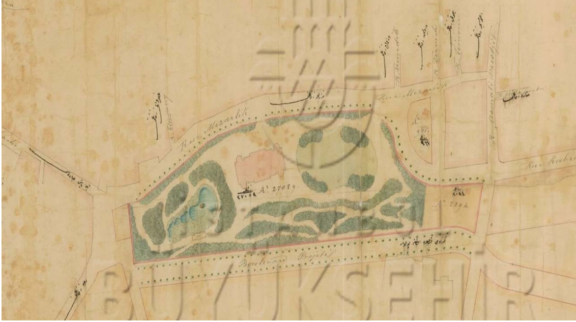
Plan 2: Tepebaşı Millet Bahçesi'nin 1295/1879-1880 yılında yapılan planı (İ.B.B. Atatürk Kitaplığı, Hrt_004253).

Tepebaşı Millet Bahçesi'nin kent alanındaki dönüşüm sonucunda ortaya çıktığı söylenebilir. Bahçe alanının uzun zamanlardan beri havayı bozacak ölçüde atık maddelerle dolu olduğu ve bahçe etrafındaki halkın sağlığını tehdit ettiği anlaşılmaktadır. Halkın şikâyetiyle belediye tarafından, sultandan irade istenerek bu arsanın belediyeye terk edilmesi talep edilmiştir (BOA., ŞD., Dosya no: 696, Gömlek no: 6). Ayrıca bahçe alanının bir kısmında Müslüman Mezarlığı olduğundan içinde bina inşa etmenin doğru olmayacağı ve bahçe olarak bırakılmasının uygun görüldüğü anlaşılmaktadır. Bahçenin inşa süreci ve ortaya çıkışındaki çabalara göz atıldığında; Altıncı Belediye Dairesi'ne çok yönlü fayda sağlamaya yönelik olarak kent merkezinde üretilen arsanın çeşitli amaçlarla örgütlenmesine ilişkin bir girişim olduğu dikkat çeker. Ancak inşa sürecindeki işleyişin kurallara bağlı gerçekleştirilmemesi sonradan oldukça büyük sorunlar yaratmıştır. Öncelikle eski Sadrazam Hayreddin Paşa'nın sözlü emriyle bahçenin inşa edildiği iddialarına ilişkin olarak paşadan bir açıklama yapması istenmiştir. 27 Muharrem 1299/19 Aralık 1881 yılında Hayreddin imzalı belgede (adı geçen eski sadrazam Hayreddin Paşa olmalıdır), konuya ilişkin bir cevap vermişse de; durumu tam olarak aydınlatıldığı söylenemez. Paşa sadece keşif ve düzenleme için yapılacak işlemleri men edecek ya da erteleyecek bir emir vermediğini belirtmekle yetinmiştir (BOA., ŞD., Dosya no: 696, Gömlek no: 6).