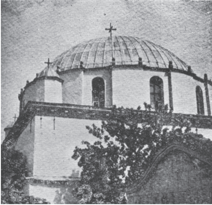
Fotoğraf 1. Kavala'da Bulunan İbrahim Paşa Camii'nin Kubbesine Takılan Haç ( Şehbal , Sayı: 85, 1 Teşrînisânî 1329 /14 Kasım 1913, s. 249).