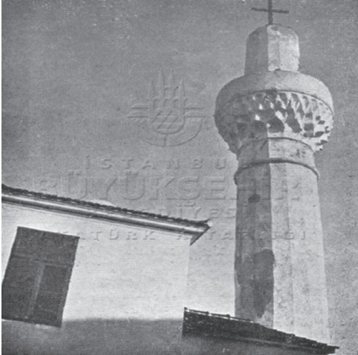
Fotoğraf 2. Kavala'da Bir Camii'nin Minaresine Takılan Haç ( Şehbal , Sayı: 85, 1 Teşrînisânî 1329 /14 Kasım 1913, s. 249).