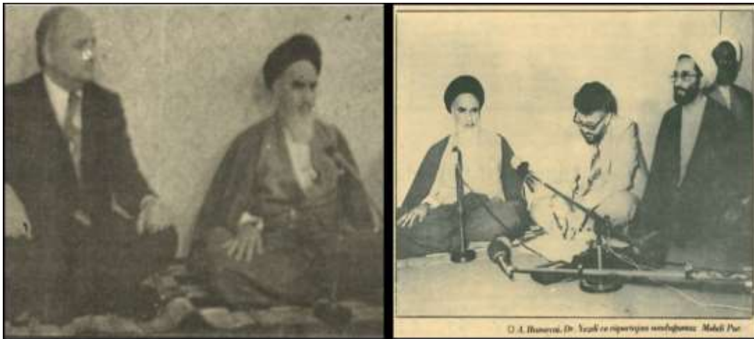
Kaynak: Tevhîd Dergisi 26. Sayı (Haziran 1979) ve İslâmî Hareket Dergisi 2/18. Sayı (Ağustos 1979).