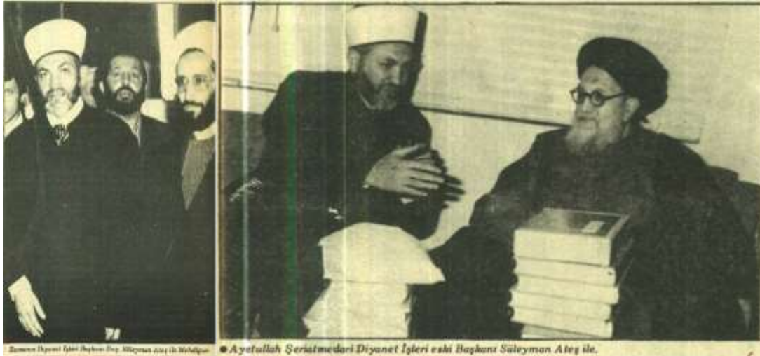
Kaynak: Tevhîd Dergisi 9. Sayı (Şubat 1979).