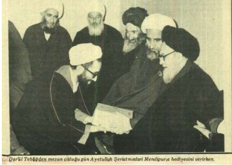
Kaynak: Tevhid Dergisi 9. Sayı (Şubat 1979).