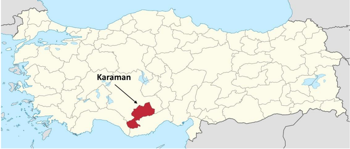
Şekil 1. Karaman ilinin Türkiye haritası üzerindeki konumu.

Çalışma, Karaman ilinin farklı bölgelerinden yer altı ve yer üstü sulama sularını temsil eden 30 adet su örneği üzerinde yürütülmüştür (Şekil 1 ve 2). Toplanan örneklerin 12'si akarsulardan, 6'sı baraj veya göletlerden ve 12'si derin kuyulardan alınmıştır (Çizelge 1). Su örnekleri, yaz döneminde derin kuyulardan pompa bir süre çalıştırdıktan sonra; baraj ve göletlerden suyun çıkış noktalarından, akarsulardan ise durgun olmayan akıntı bölgelerinden plastik şişelere alınmış, her örnek uygun şekilde etiketlenmiş (örneklerin alındığı noktanın koordinatları, konumu ve tarih) ve gerekli analizlerin yapılması için laboratuvara getirilmiştir.