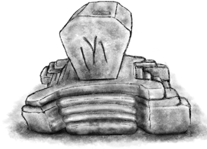
Şekil 3: Kayı boyu mezar taşı

Bayandır Boyu Oğuzların 24 boy teşkilatında Bozok koluna mensup olup sıralamada Kayı ve Bayat boylarından sonra yer almaktadır. Boyun adı, Kaşgarlı Mahmud'un Divânu Lugâti't-Türk'ünde ve Reşîdüddin Fazlullah'ın Câmi'ü't-Tevârih'inde açıkça kaydedilmiş, damgası ve ongunu da bu eserlerde belirtilmiştir. “Bayandır” kelimesi eski Türkçede “zenginleştirici, bay eden” anlamına gelmekte olup, muhtemelen boyun ekonomik gücünü, nüfuzunu ve topluluk içindeki saygın konumunu ifade etmektedir.