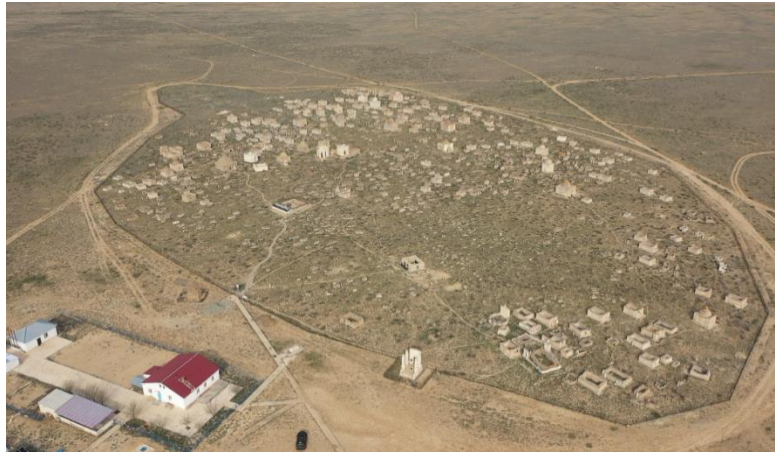
Şekil 1: Sisem Ata Mezarlığı'nın yerleşim planı

Koç figürü gibi motiflerin mezar taşlarında sıkça kullanılması ise bu kozmolojik düzenin ve koruyucu inancın mekâna yansıtıldığını gösterir (Kartaeva ve Oralbay, 2020). Yerleşiminde dikkati çeken bir diğer unsur ise anıtsal nitelikteki mezar taşlarının merkezi konumlarda toplanmasıdır. Bu anıtsal taşlar genellikle daha yüksek veya daha özenli işçilikle yapılmıştır. Alanın çeşitli noktalarındaki bu tip yapılar, topluluğun önemli şahsiyetlerine veya liderlerine ait mezarların işaretçisi olarak değerlendirilir. Ayrıca, bölgede yaygın olan koyun-taş ve koç-taş formları da hem mimari hem de tipolojik açıdan alanın karakteristiğine katkıda bulunur (Kartaeva ve Oralbay, 2020).