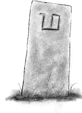
Şekil 4: Bayandır boyu mezar taşı

Bayat Boyu Oğuzların 24 boy teşkilatında Bozok koluna mensup olup sıralamada Kayı boyundan hemen sonra yer almaktadır. Boyun adı, Kaşgarlı Mahmud'un Divânu Lugâti't-Türk'ünde “Bayat” şeklinde geçmekte; Reşîdüddin Fazlullah'ın Câmi'ü't-Tevârih'inde ise damgası, ongunu ve tarihi bilgileri ile birlikte kayıt altına alınmıştır. “Bayat” kelimesi eski Türkçede “kutlu, mübarek” anlamına gelmekte olup, boyun Oğuz toplulukları içindeki yüksek statüsünü ve itibarlı konumunu ifade etmektedir (Şekil 5).