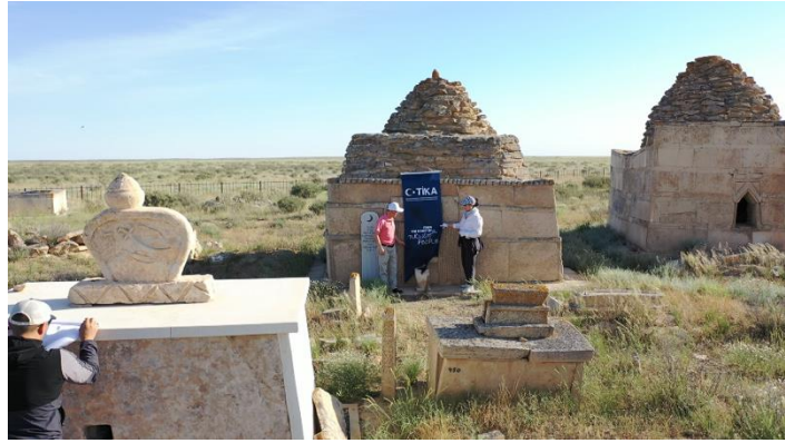
Şekil 2: Sisem Ata mezarlığı saha araştırması

Sisem Ata Mezarlığı'nda yer alan mezar taşları, özellikle Oğuz boyları ve bu boyların Kazak Aday koluna mensup topluluklarının tarihsel ve kültürel izlerini taşımaktadır. Bu mezar taşlarının mimari ve tipolojik özellikleri, bölgedeki göçebe Türk topluluklarının sosyal yapısı ve inanç sistemleriyle doğrudan ilişkilidir. Mezar taşlarının biçimsel çeşitliliği, kullanılan malzeme türleri ve süsleme anlayışı, hem Oğuz boylarının ortak mirasını hem de Kazak Aday boyunun kendine özgü geleneklerini yansıtır. Mangystau bölgesi başta olmak üzere Batı Kazakistan'daki mezarlıklarda sıklıkla rastlanan koyun heykelli mezar taşları, bu coğrafyada yaşayan toplulukların hayvancılıkla olan sıkı bağını simgeler. Özellikle koyun figürlü mezar taşlarının Mangystau, Donıztau ve Üstürt gibi bölgelerde yoğunlaşması, buradaki toplumsal yapının ekonomik temelini hayvancılık olduğunu gösterir. Koyun heykelli mezar taşları sadece birer kabir işareti değil, aynı zamanda ölen kişinin toplumsal statüsünü ve ekonomik faaliyetlerini sembolize eden unsurlardır (Kartaeva ve Oralbay, 2020).