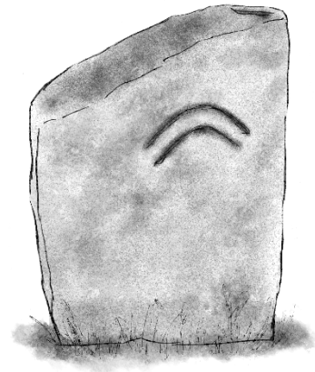
Şekil 6: Çavuldur Boyu mezar taşı