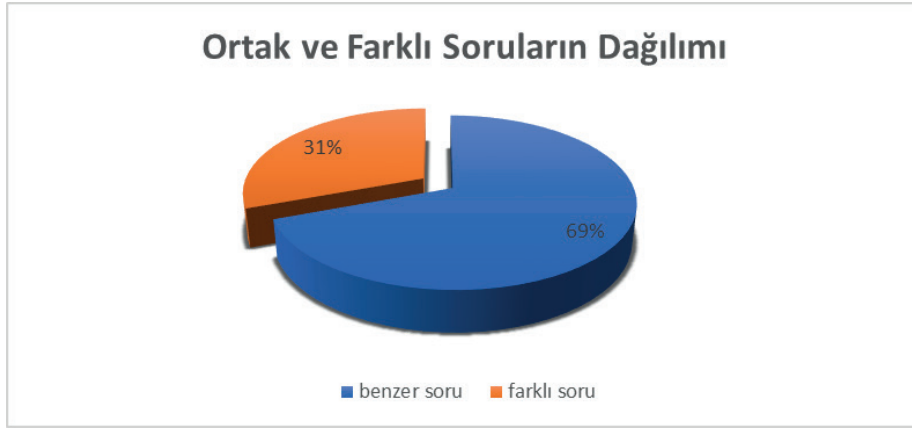
Şekil 1: Aile Konulu Ortak ve Farklı Soruların Dağılımı (2015–2020–2025)

Buradan elde edilen veriler, 2015, 2020 ve 2025 yıllarına ait fetva kitaplarında soruların büyük bir kısmının benzer olduğunu ancak bir kısmının da farklılık gösterdiğini göstermektedir. Verilere göre toplam 124 soru bulunmaktadır; bunlardan 86’sı (%69) benzer, 38’i ise (%31) farklıdır. Bu durum fetva kitaplarında ele alınan soruların belirli bir sistematik içinde sunulmaya devam ettiğini ancak zamanla toplumsal dinamiklerin değişmesiyle birlikte yöneltilen soruların içerik ve temalarında farklılaşmalar yaşandığını ortaya koymaktadır. Bu değişim, geleneksel aile yapısının ötesine geçen yeni sosyal gerçekliklerin dini danışma taleplerine yansımalarını göstermektedir.