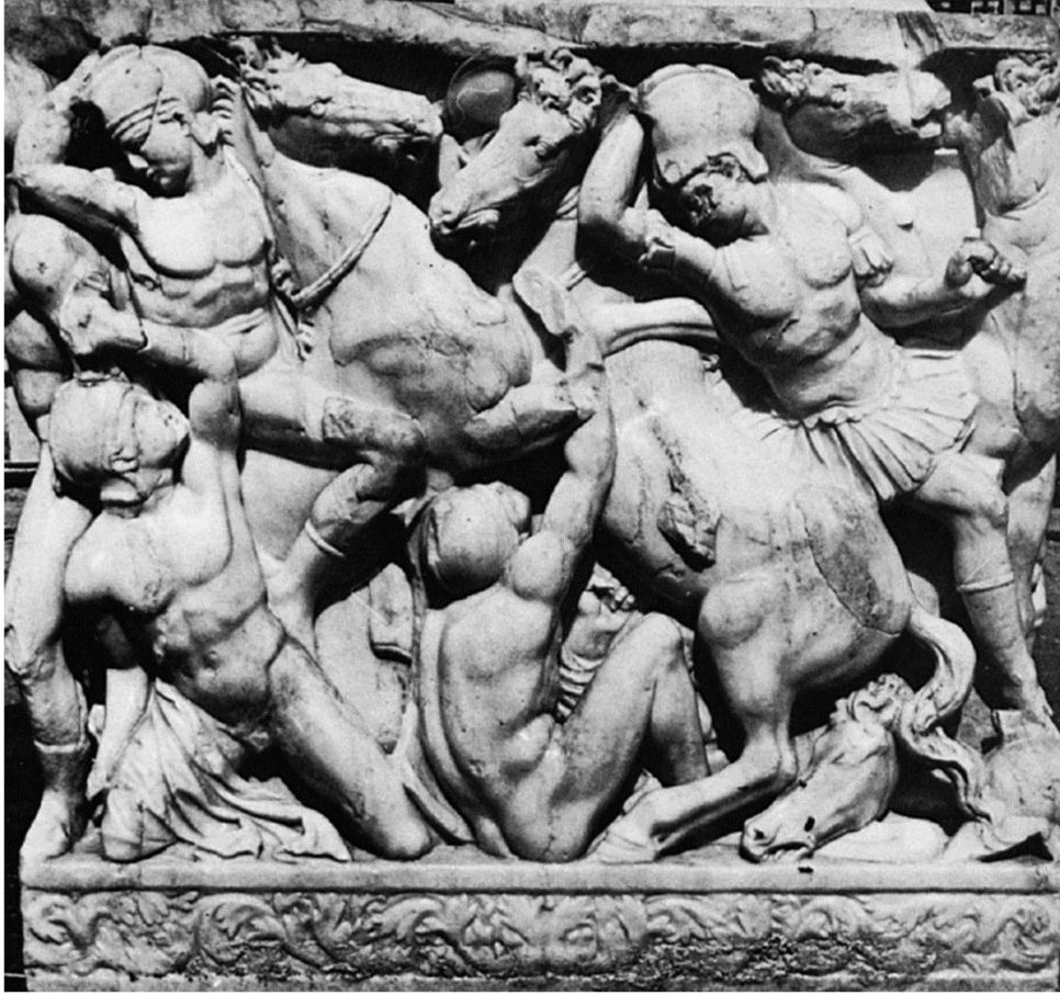
Resim 6: Savaş Konulu Lahit, Tyros Nekropolisi (Chéhab 1968: Pls. 24).