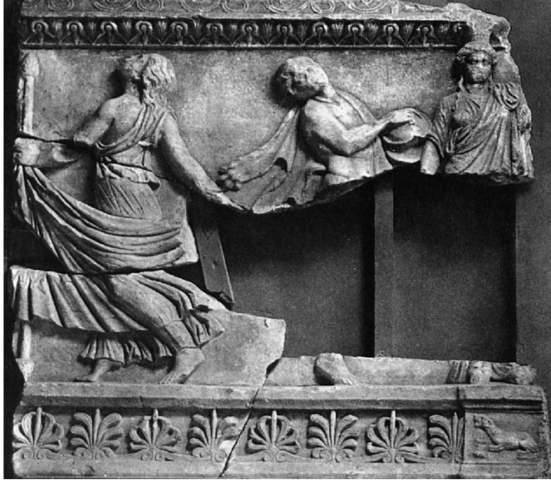
Resim 2: Dionysos Lahdi, Palestrina (Matz 1968a: Taf. 6.6).

olarak, boynun ve üst gövdenin dönüşünde kasılma hissedilmektedir. Bu anlamda Adana örneğinin MS. 2. yüzyılın 2.ve 3. dörtlüklerine tarihlendirilen Palestrina (Resim 2: Matz, 1968a, ss. 102-103, Taf. 6, Nr. 6; Wiegartz, 1977, s. 387), Atina (Resim 3: Matz, 1968a, ss. 101-102, Taf 5, Nr. 4) ve Floransa'daki (Resim 4: Nocentini, 1964, ss. 314-318; Matz, 1968b, ss. 179-180, Taf. 82, Nr. 72) Dionysos lahitleri üzerindeki kymbalon çalan satyros figürleri ile çok yakın benzerlik gösterdiğini söylemek mümkündür. Kas stili ve duruş pozunun yanı sıra, saçların biçimi, derine yerleştirilen gözlerdeki hülyalı bakışlar, yukarıda bahsi geçen lahitler üzerindeki kymbalon çalan satyros figürlerinin tamamında benzer şekilde verilmiştir. Buna ilaveten, Palestrina ve Atina lahitleri ile aynı grup (A Serisi) içinde değerlendirilen ve Mistra'dan gelen bir başka Dionysos lahdi (Matz, 1968a, ss. 99-100, Taf. 2, Nr. 2) üzerindeki silenos figürünün gövde-kas yapısı da Adana örneğindeki silenos figüründe olduğu gibidir.