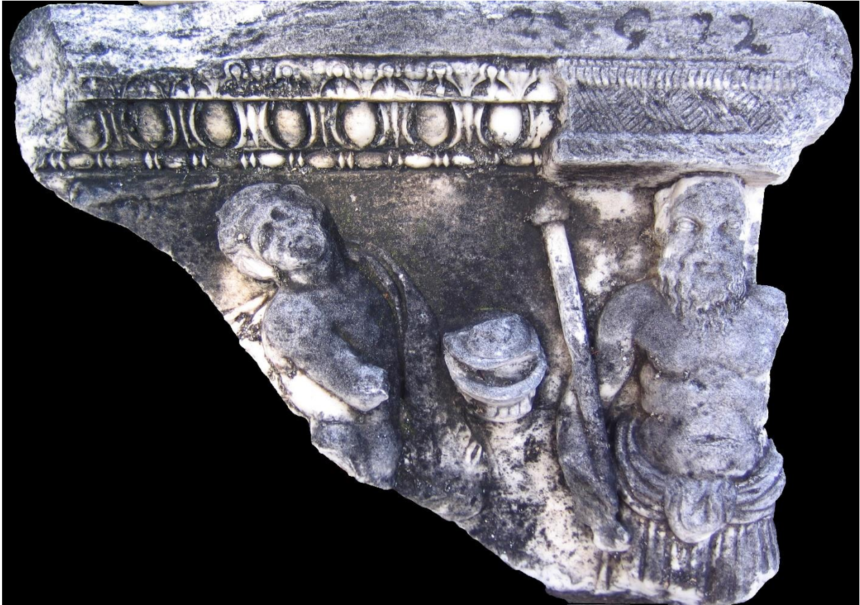
Resim 1: Dionysos Konulu Lahit Parçası, Adana Müzesi.

05.10.1972 tarihinde, Adana Müzesi'ne satın alma yoluyla kazandırılmış olan 5826 envanter numaralı parçanın, korunan yüksekliği, 52 cm., korunan genişliği ise 75 cm. dir. Üzerinde figürlü bir kabartma bulunan bu parça, lahit teknesinin uzun yüzlerinden birine ait olmalıdır. Lahit teknesinin üst pervazında yukarıdan aşağıya doğru sırasıyla, lesbos kymationu, yumurta-mızrak dizisi ve inci dizisi bulunmaktadır. Büyük oranda korunamamış olan kabartma üzerinde iki figür görülmektedir (Resim 1).