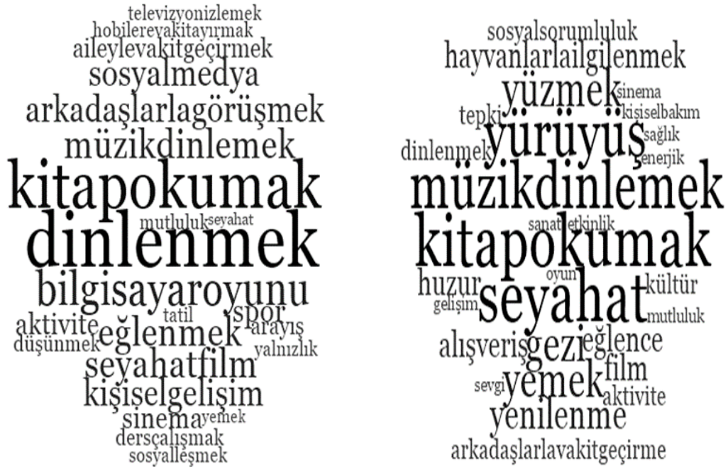
Şekil 1. Katılımcıların Boş Zaman Ve Rekreasyon Kavramlarıyla İlişki Kurdukları Kelimelerin Frekanslarına Göre Kelime Bulutu Görseli

Katılımcıların boş zaman kavramıyla ilişki kurdukları kelimeler ve frekans değerleri dikkate alınarak oluşturulmuş kelime bulutu görseli Şekil 1’de görülmektedir. Kelime bulutunda görüldüğü gibi en çok dinlenmek ve kitap okumak kelimelerinin tekrarlandığı görülmektedir. Bu veriler temel alınarak katılımcıların boş zamanlarını daha çok kitap okuma etkinliği ile geçirdiklerini ve dinlenmek amacıyla boş zaman etkinliklerine katıldıklarını destekler niteliktedir.