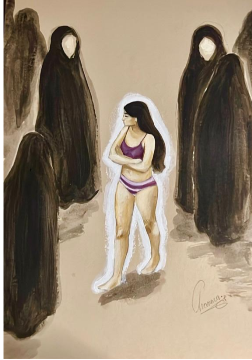
Görsel 3: “Birkaç fırça darbesiyle, cesaret dolu bu kadına saygı göstermek istedim.” 54

Ele alınan üçüncü görseldeki gösterge ve simgeleri açıklamak üzere gösteren ve gösterilenlerin yan anlamlarıyla birlikte yer verilen göstergebilimsel analiz Tablo 3’te verilmiştir.