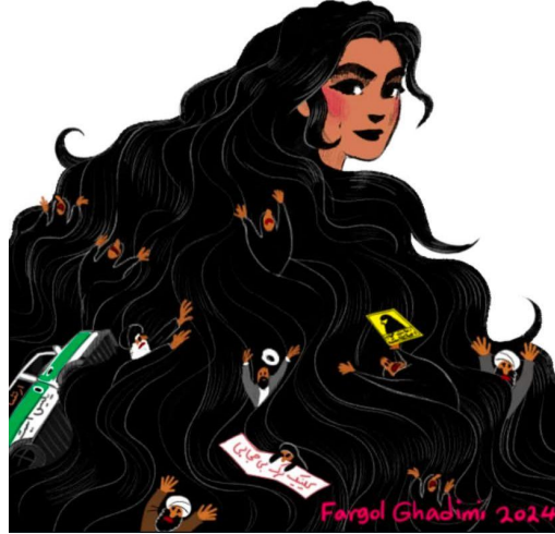
Görsel 2: “Kadınlar kavga edince dünya değişir. Kadın, yaşam, özgürlük.”

İkinci görselin öne çıkan ilk göstergesi siyah, dalgalı saçları açık olan bir kadındır. Kadın yüzünü dönmüş biçimde gülümsemektedir. Kadının dalgalı ve uzun saçlarının arasında; çarşafli kadınlar ile sarıklı ve sakallı erkek figürlerinin adeta boğulduğu görülmektedir. Bununla birlikte kadının dalgalı saçlarında başörtüsü simgesi olan sarı bir tabela ve İran polis aracının da sürüklendiği görülmektedir.