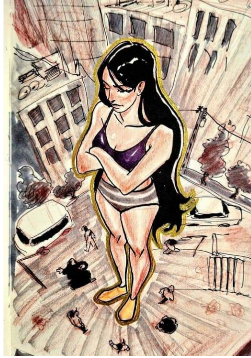
Görsel 5: "İRAN - Kadın, yaşam, özgürlük." 56

Beşinci görselde ilk göze çarpan unsur; Ahoo Daryaei'nin Özgürlük Heykeli'ni andırır biçimde, protestosundaki vakur duruşuyla devasa bir boyutta resmedilmesidir. Kompozisyonun geri kalanını oluşturan mekânsal öğeler, Daryaei'nin etrafında ve onu merkeze alacak bir biçimde konumlandırılmış; kırmızı tonlarla vurgulanarak çarpık bir formda çizilmiştir. Tüm bu karmaşanın ortasında Daryaei; görkemli, nizami renklendirilmiş ve çevresindeki kaotik dünyadan yalıtılmış bir biçimde çerçeveye alınarak kadrajın merkezine yerleştirilmiştir.