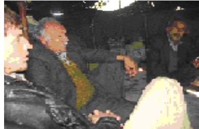
Şekil 11 . Yörük Çadırı