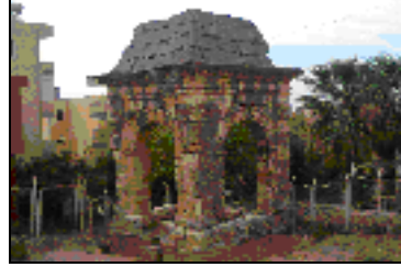
Şekil 7. Dört Ayak Anıt Mezar