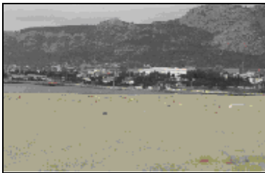
Şekil 2. İncekum Plajı

Akdeniz ve Kumsallar: Aydıncık altı adet büyük koya sahiptir. Bu kumsalların hepsi de sığ, temiz ve incecik kuma sahiptir. İlçenin en doğusunda incecum plajı bulunur. İncecum plajı kafeterya, duş vb ihtiyaçların karşılandığı altyapı tesislerine sahiptir.