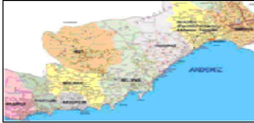
Şekil 1. Aydincik ilçesinin coğrafi konumu

Araştırma alanı olan Mersin ili Aydincik İlçesi, Akdeniz bölgesinde, Mersin İlinin merkezine 173 km, Antalya merkeze ise 325 km. uzaklıkta yer almaktadır. Kuzeyinde Gülnar, doğusunda Silifke, batısında Anamur, güneyinde ise masmavi sularıyla Akdeniz bulunmaktadır. Başkent Ankara'nın Akdeniz'e ulaştığı en kestirme ve kısa güzergâh üzerinde olan Aydincik ilçesi merkezinden, Antalya-Mersin D-400 Karayolu geçmektedir (Şekil 1).