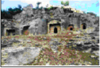
Şekil 6. Duruhan Kaya Mezarları