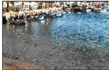
Şekil 3. Aydıncık İskelesi