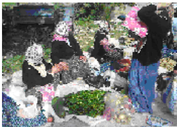
Şekil 10. Yörük Pazarı

Türkiye'nin son konargöçer yörükleri olan Sarıkeçili Yörükleri de Aydıncık ve çevresinde yaşamaktadırlar. Yazları yaylalarda kışları Aydıncık ilçesi ve çevrelerinde hayvan otlatarak geçimlerini sağlamaktadırlar. Sarıkeçili yörüklerin Somut Olmayan Dünya Miras Listesine alınması için çalışmalar sürmektedir. Bu çalışmalar neticelendiğinde Sarıkeçili yörükleri Aydıncık ilçesi için önemli bir turizm potansiyeli yaratacaktır (Şekil 9. -Şekil 10).