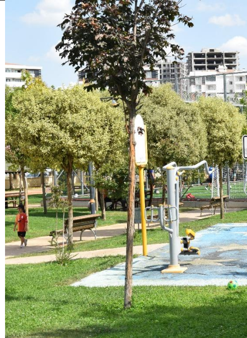
Acer platanoides 'Crimson King'