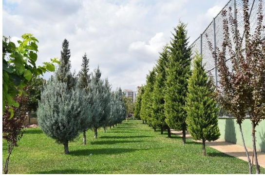
Cupressus arizonica 'Glauca' ve Cupressus macrocarpa