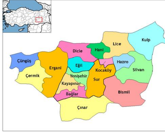
Şekil 1. Bağlar ilçesinin Diyarbakır ilindeki konumu [19].

Diyarbakır sert karasal iklim tipine sahiptir. Yazları çok sıcak kışları ise ılımandır. İl genelinde en sıcak ay temmuz ayı olup sıcaklık ortalaması 31 derece, ocak ayı ise en soğuk ay olup sıcaklık ortalaması 2,1 derecedir. Ortalama yıllık yağış miktarı yaklaşık 550 mm'dir. İle genellikle yaz aylarında haziran ayından eylül ayına kadar hiç yağış düşmez. Meteoroloji Genel Müdürlüğü verilerine göre, yıllık toplam yağış miktarının yalnızca yaklaşık %2'si yaz aylarında gerçekleşmektedir. Son yıllarda bölgede inşa edilen Karakaya, Atatürk, Batman ve Silvan barajlarının oluşturduğu yapay göllerin geniş buharlaşma alanları nedeniyle, Diyarbakır Havzası'nda nispi nem oranında artış gözlemlenmiştir. İlde ortalama nispi nemin en yüksek seviyeye aralık ve ocak aylarında ulaştığı ve bu dönemde %77 olarak ölçüldüğü belirlenmiştir. Buna karşılık, yaz aylarında özellikle temmuz ve ağustos aylarında nispi nem oranı %20'ye kadar düşerek en düşük seviyelere inmektedir [20].