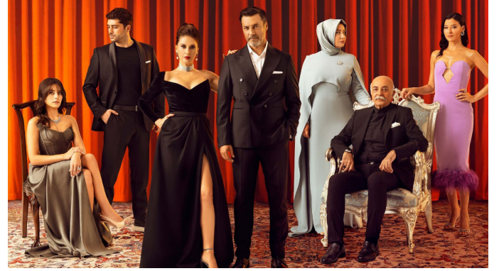
Şekil 2. Kızılıcak Şerbeti 1. Sezon Dizi Afışı

Dizi, toplumsal cinsiyet rolleri, evlilik kurumu, aile içi ilişkiler, gençlerin kimlik arayışı gibi birçok konuya değinmekte, ancak izleyiciyi düşünmeye ve kendi yaşamlarını sorgulamaya teşvik etmemektedir. Tam tersine, kötü ilişkileri sıradanlaştırıp toplumun bunları kabullenmesine zemin hazırlamaktadır.