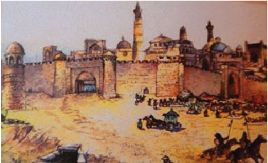
Şekil 1: Sayram Şehri