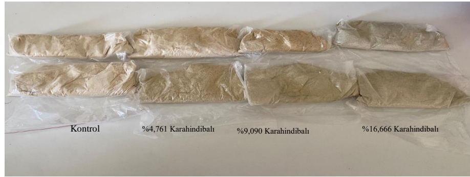
Şekil 1. Karahindibalı tarhana örnekleri

Bu çalışmada tarhana, geleneksel yöntemine uygun olarak yoğurma, fermantasyon, kurutma ve öğütme aşamalarından geçirilerek üretilmiştir. Üretim süreci tamamlandıktan sonra analizlerde kullanılmak üzere elde edilen tarhanalar uygun forma getirilmiş, 500 g'lık porsiyonlar hâlinde ambalajlanarak kontrollü koşullarda muhafaza edilmiştir. Böylece numunelerin dış etkenlerden etkilenmesi önlenmiş, fizikokimyasal ve mikrobiyolojik standardizasyon sağlanmıştır. Karahindiba katkısının tarhana üzerindeki etkilerini değerlendirmek amacıyla kontrol grubu (karahindibasız) ve üç farklı karahindiba konsantrasyonu kullanılarak üretim gerçekleştirilmiş, her bir grup için tekrarlı üretim uygulanmış ve toplamda sekiz adet tarhana örneği elde edilmiştir. Bu tasarım, deneysel güvenilirliği artırmış ve verilerin istatistiksel açıdan anlamlı karşılaştırılmasına olanak tanımıştır. Özellikle kurutma ve öğütme sonrası ambalajlama süreci, nem ve mikrobiyal kontaminasyon risklerini minimize ederek ürünlerin raf ömrünü uzatmayı hedeflemiş, karahindiba katkılı tarhana örneklerinin kurutulduktan sonra ambalajlanmış hali Şekil 1’de gösterilmiştir.