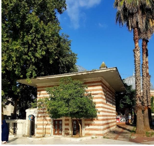
Fotoęraf 2. Ebusuud Efendi Sıbyan Mektebi Yan Cephe (Mert Aęaoęlu)