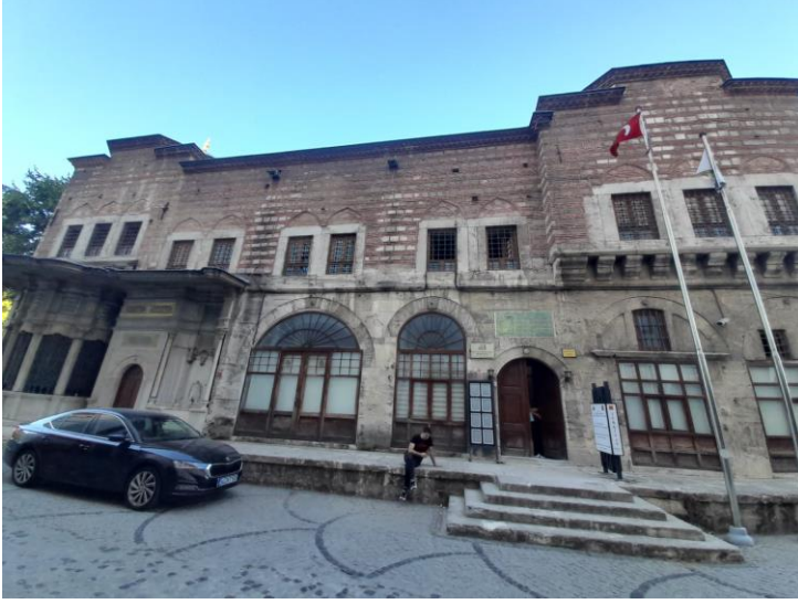
Fotođraf 17. Seyyid Hasan Pařa Medresesi Dershane-Mescid (Tuana irtma)