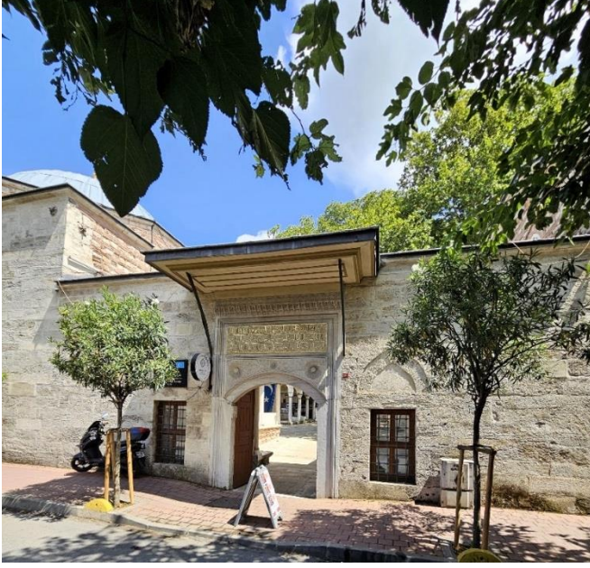
Fotoęraf 12. Nevşehirli İbrahim Paşa Medresesi Yan Cephe (Tuana Çirtma)