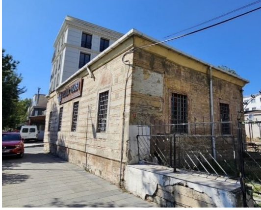
Fotoğraf 4. Kara Ahmed Paşa Sıbyan Mektebi Yan Cephe (Mert Ağaoğlu)