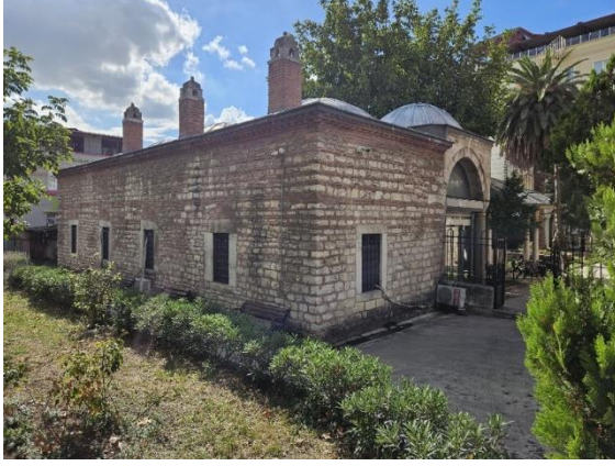
Fotoğraf 7. Feyzullah Efendi Kütüphane ve Dershane (Tuana Çirtma)