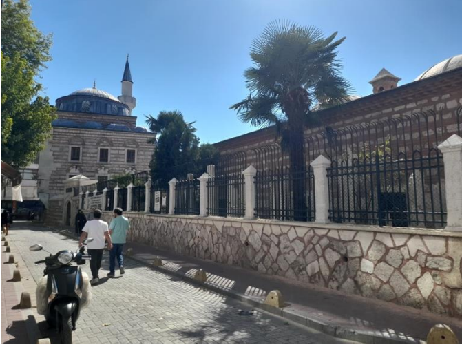
Fotoğraf 15. Şeyhülislam Esad Efendi Medresesi Avlu (Tuana Çirtma)

Fotoğraf 15. İsmail Efendi Cami Yanında Şeyhülislam Esad Efendi Medresesi (Tuana Çirtma)