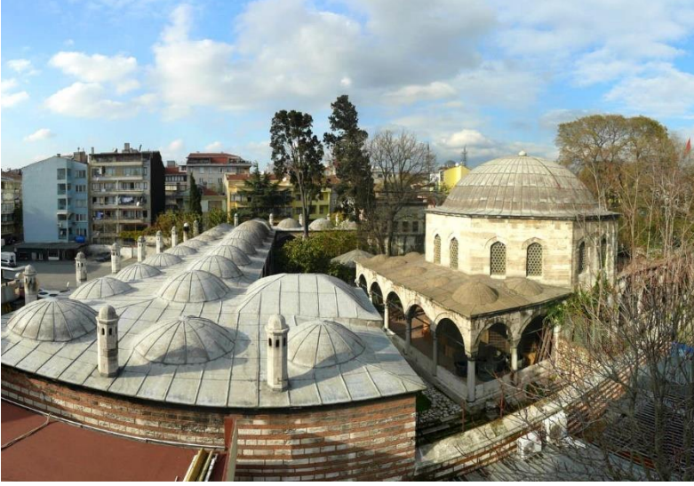
Fotoęraf 9. Amcazade Hüşeyin Pařa Sıbyan Mektebi ve Dükkanlar (Tuana Çirtma)