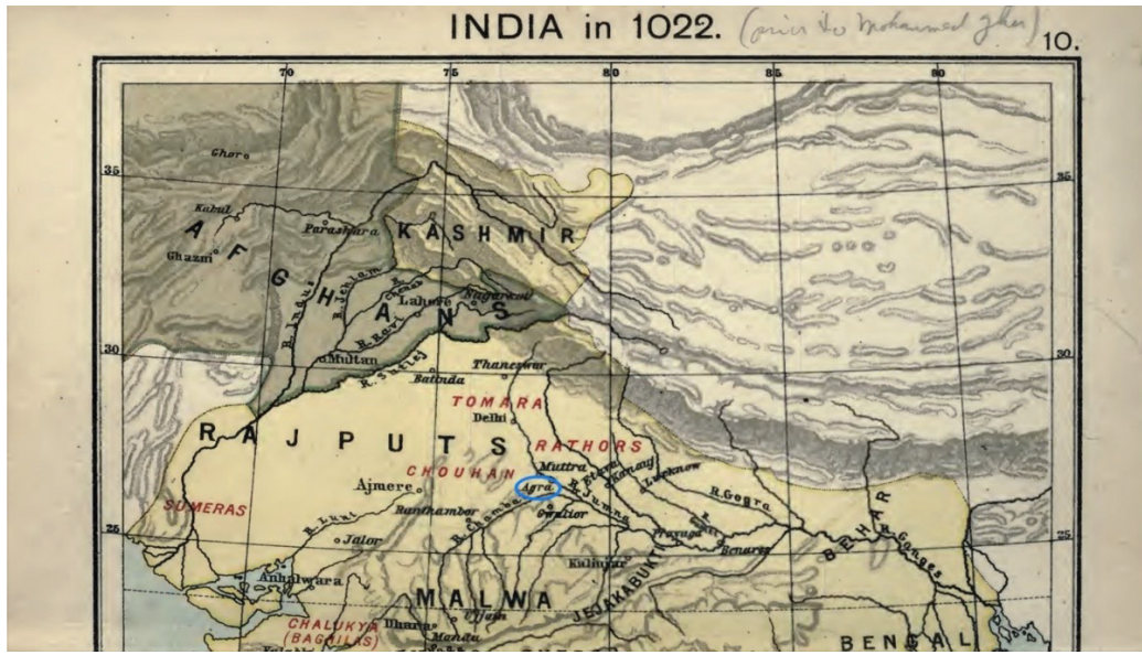
Harita 70 Agra'nın Geniş Görünümü.