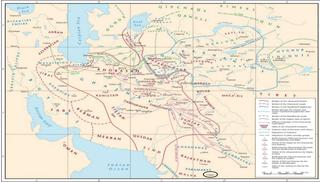
Harita 69 Ujjain'in Geniş Görünümü.